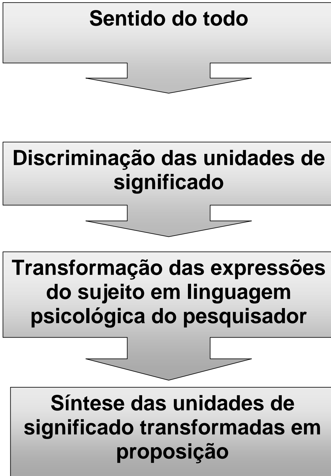
FIGURA 1: Representação gráfica dos momentos da análise.