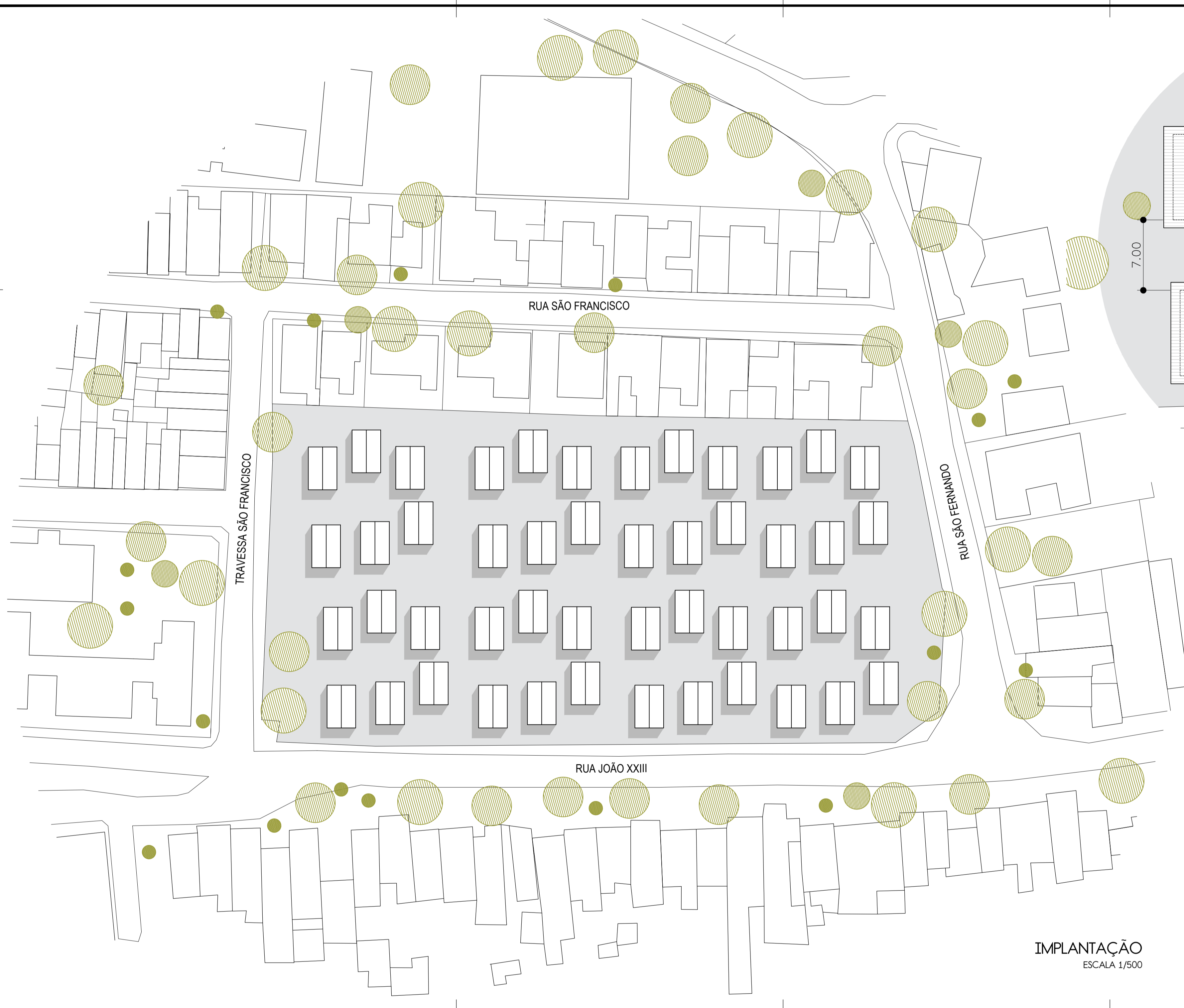
IMPLANTAÇÃO ESCALA 1/500