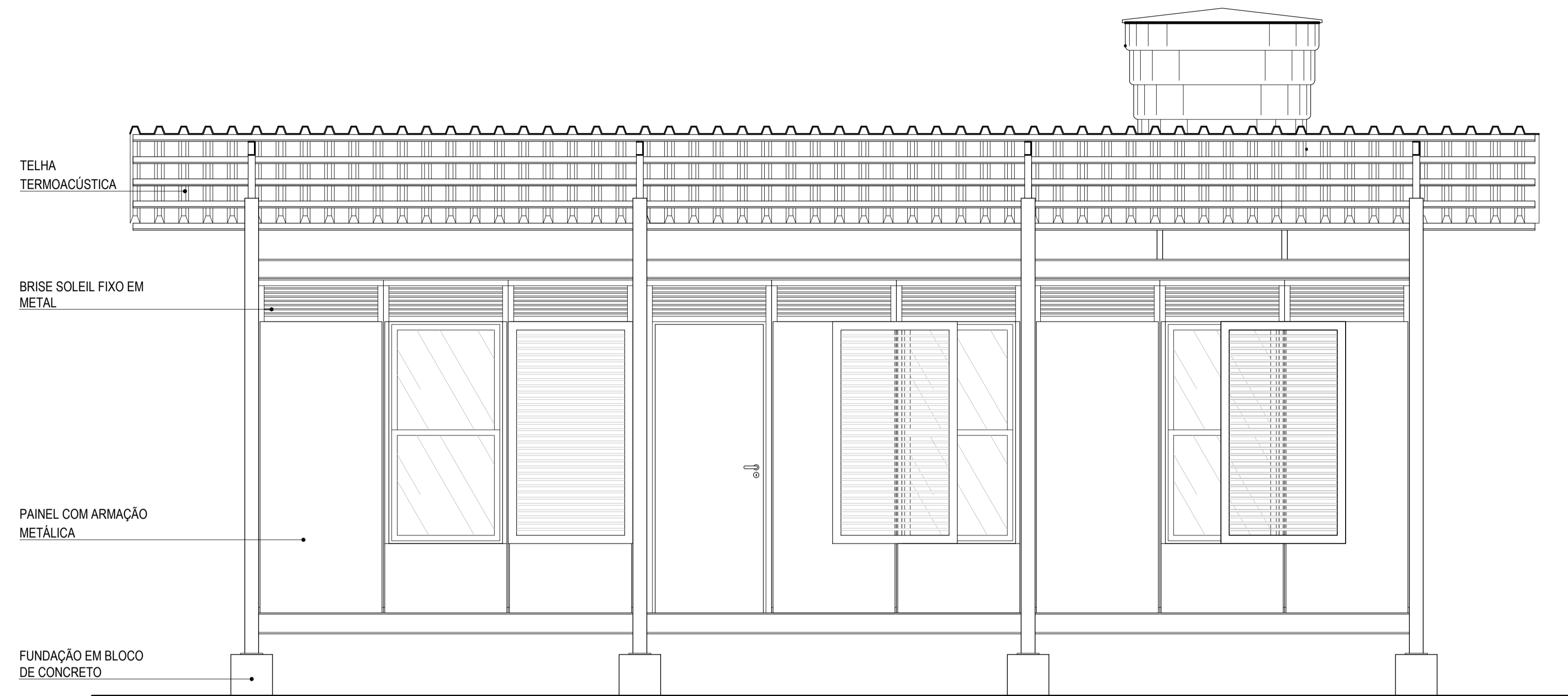
FACHADA FRONTAL ESCALA 1/25