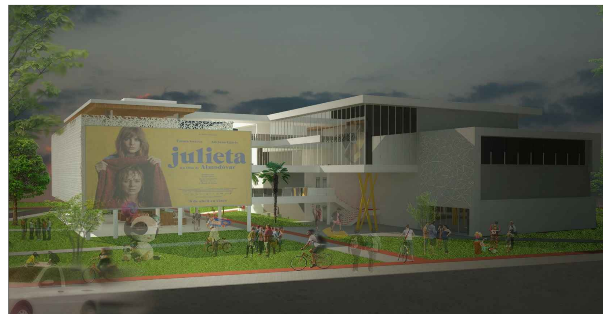
PERSPECTIVA EXTERNA 03