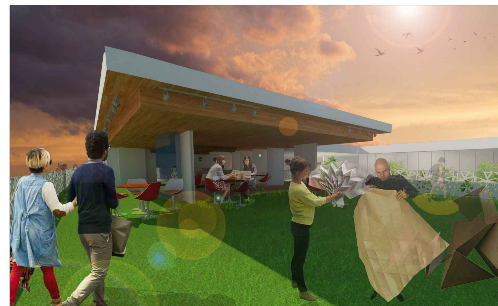
PERSPECTIVA INTERNA 03