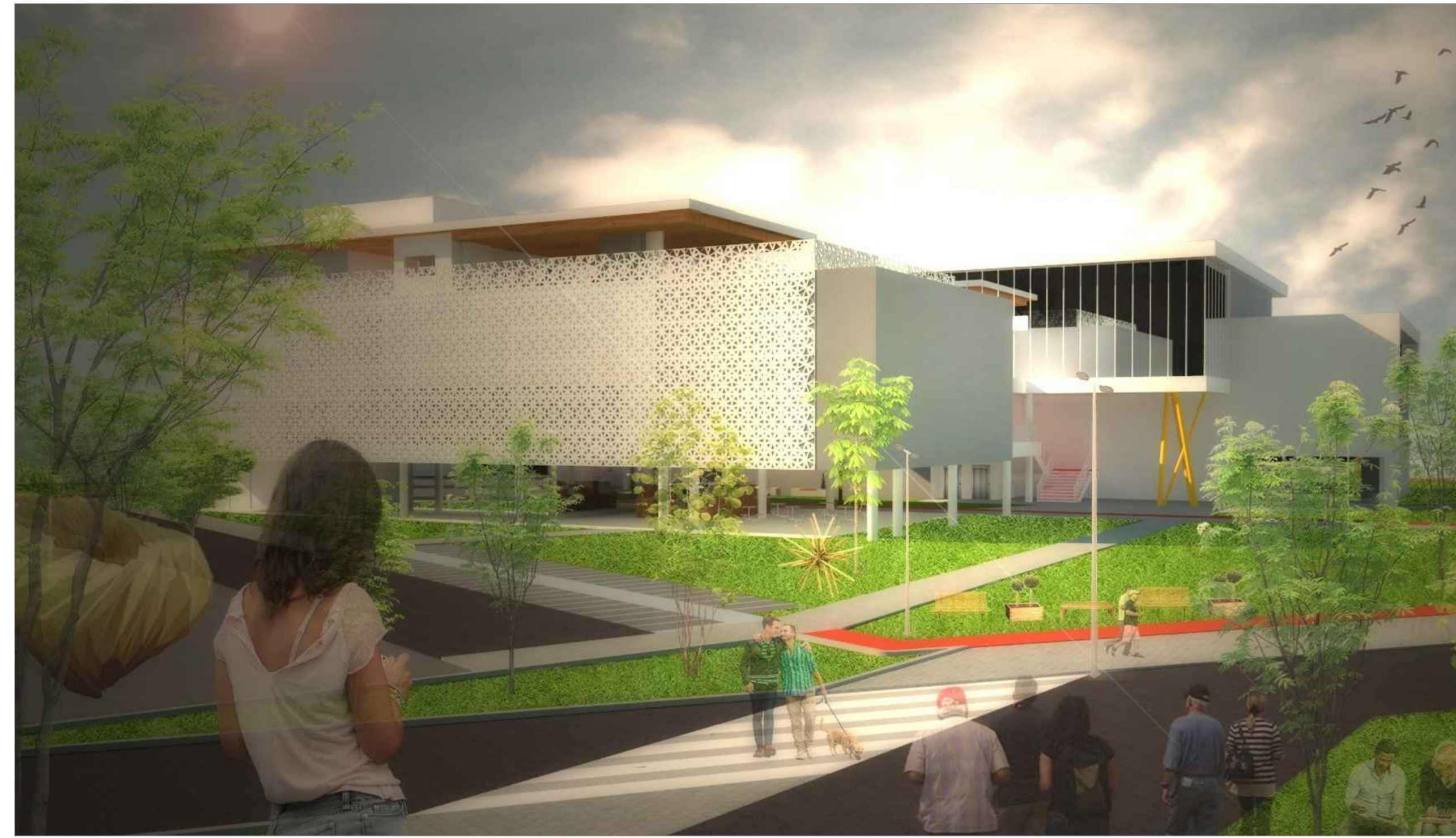
PERSPECTIVA EXTERNA 01