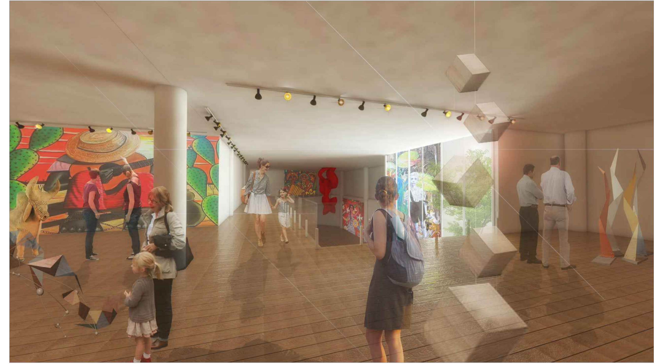
PERSPECTIVA INTERNA 01