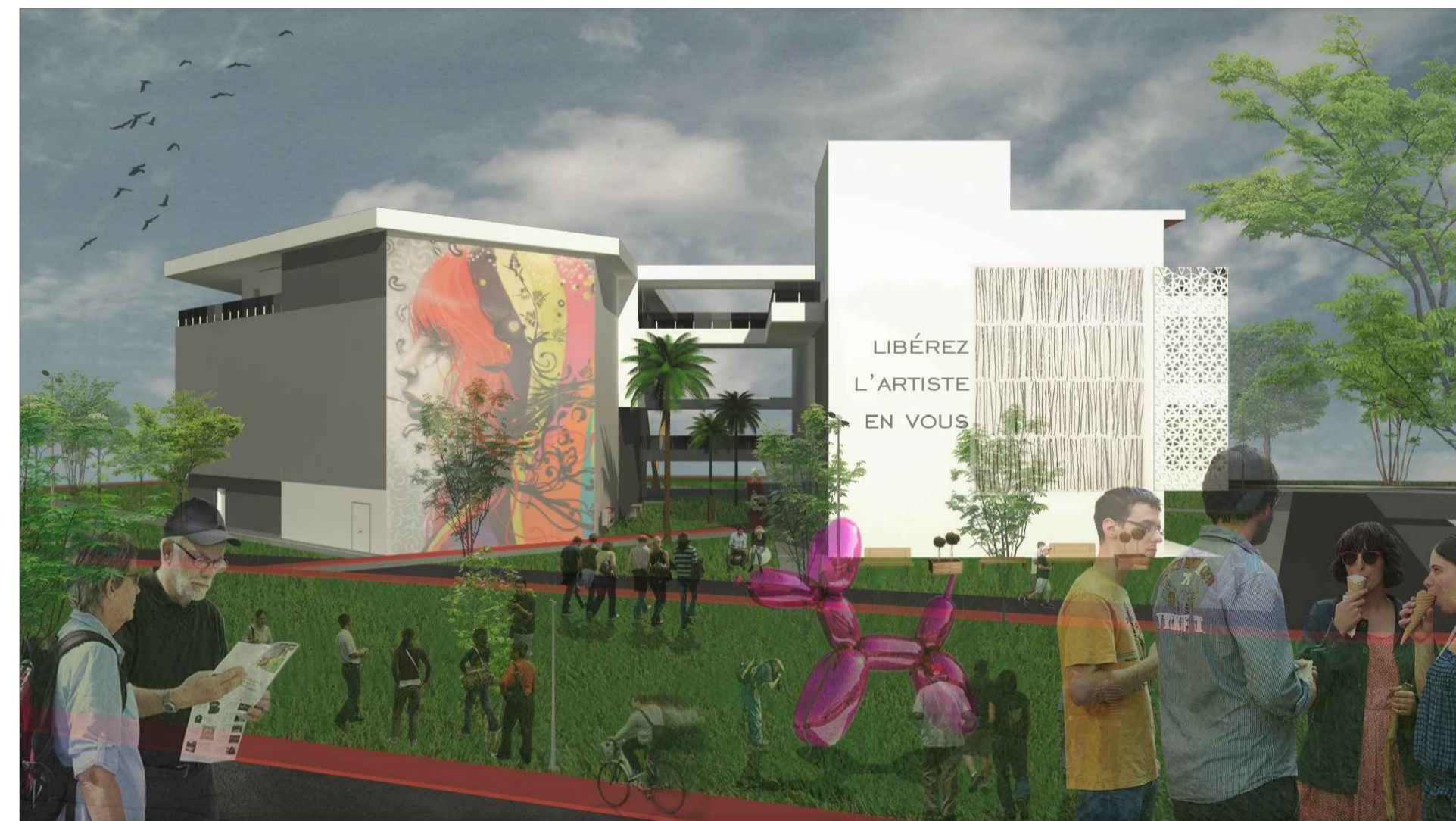
PERSPECTIVA EXTERNA 02