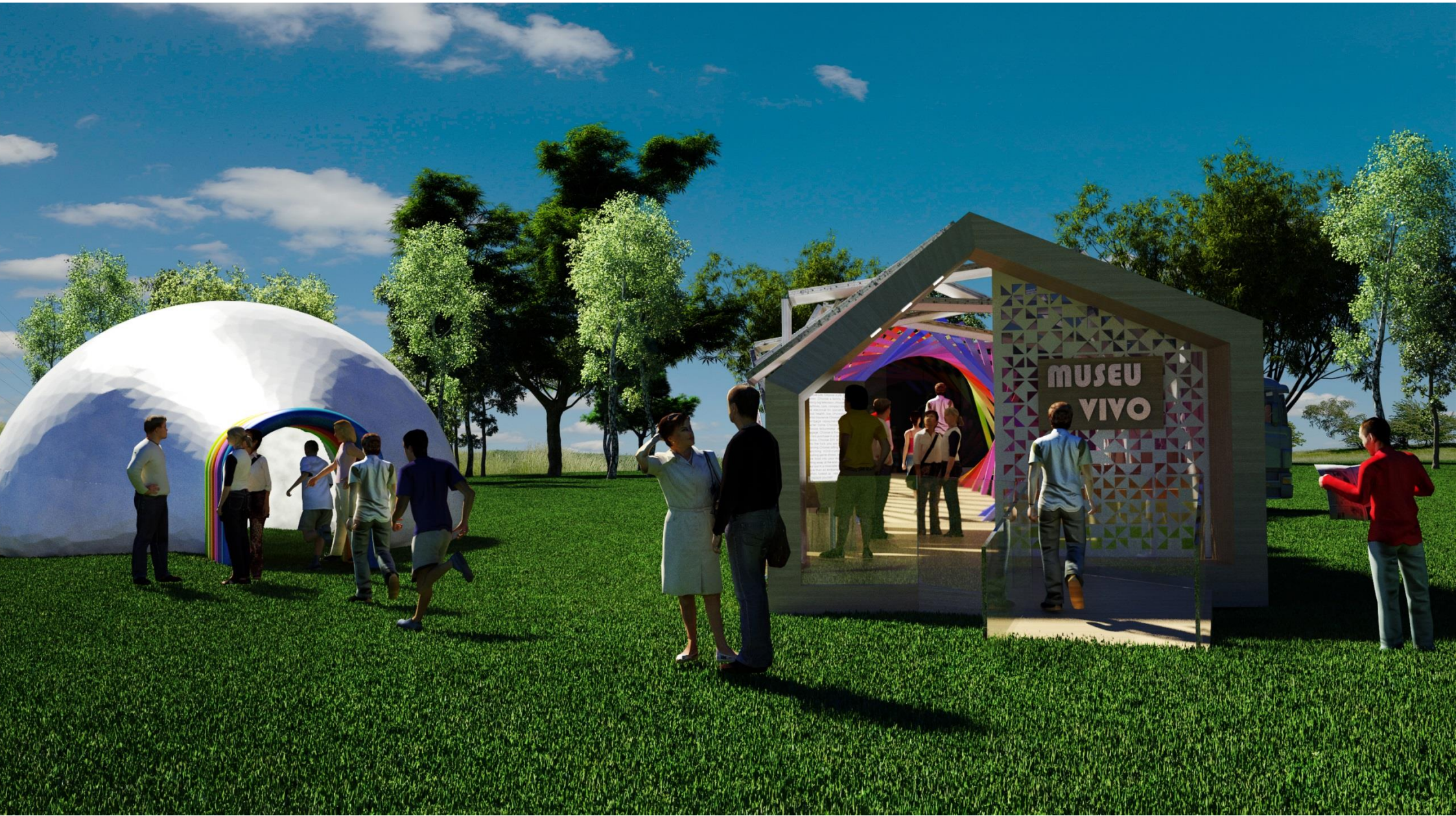
PERSPECTIVA 01 - VISTA EXTERNA