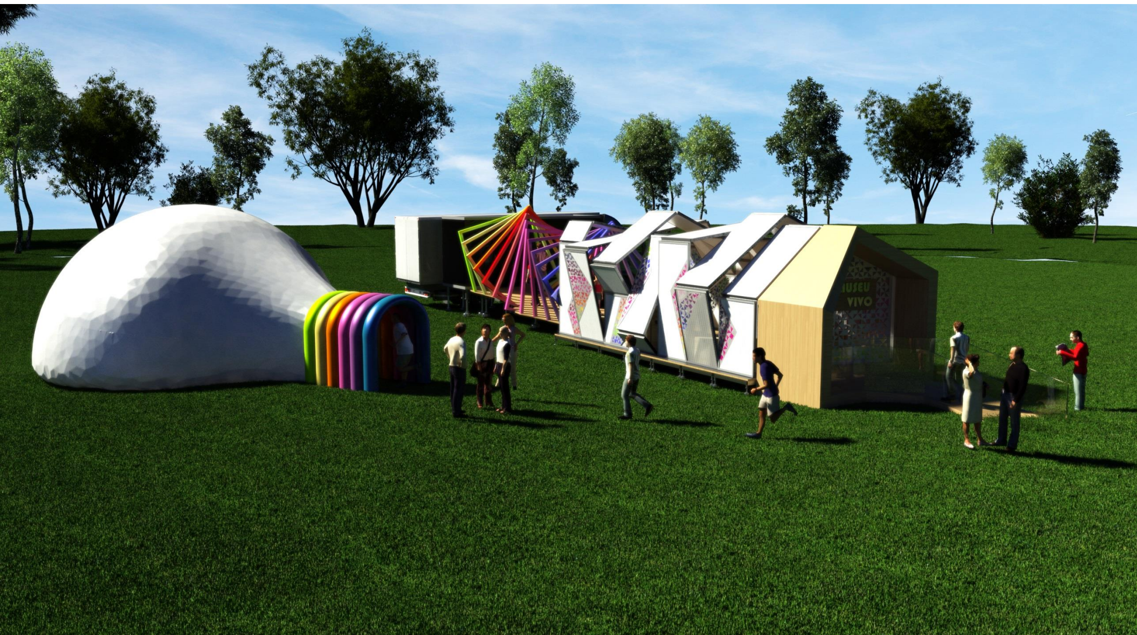
PERSPECTIVA 02 - VISTA EXTERNA EXPOSIÇÃO MÉDIA