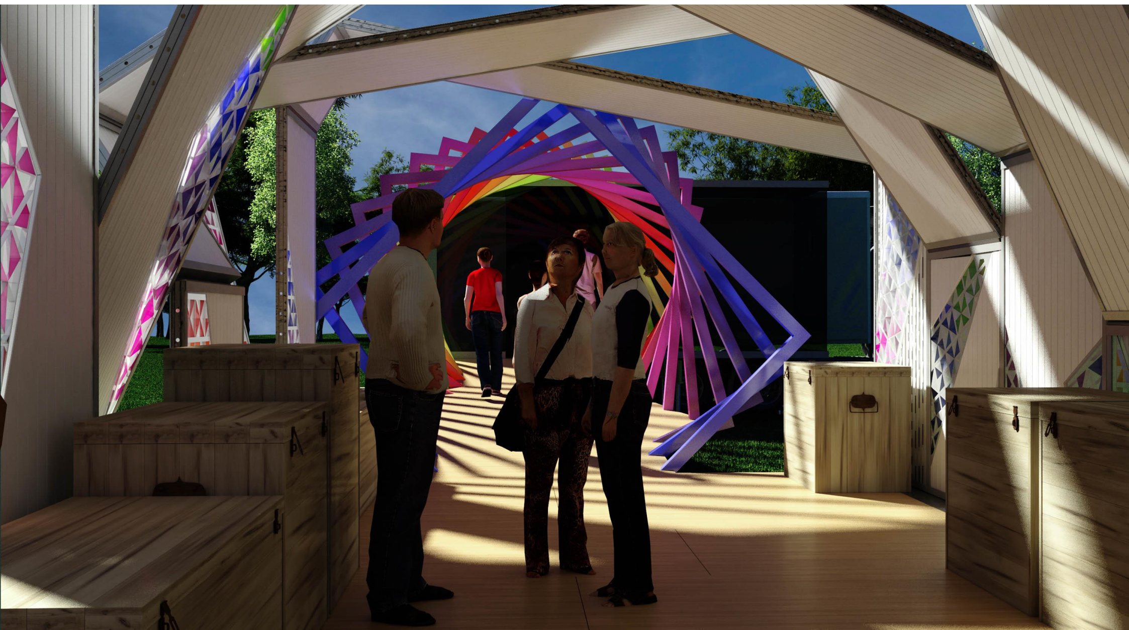
PERSPECTIVA 04 - VISTA INTERNA PAVILHÃO DE EXPERIMENTOS