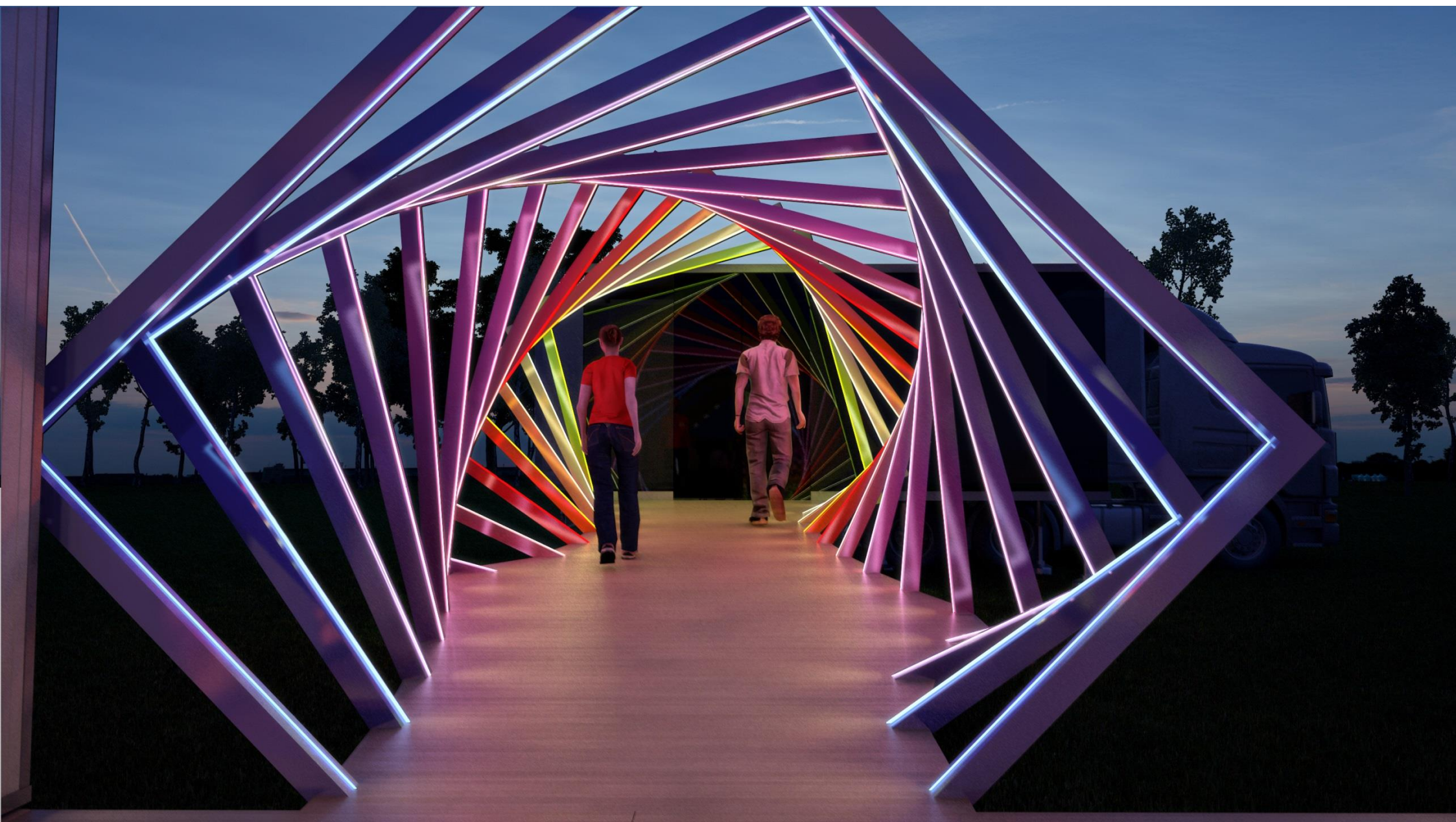
PERSPECTIVA 09 - VISTA NOTURNA DA PASSARELA