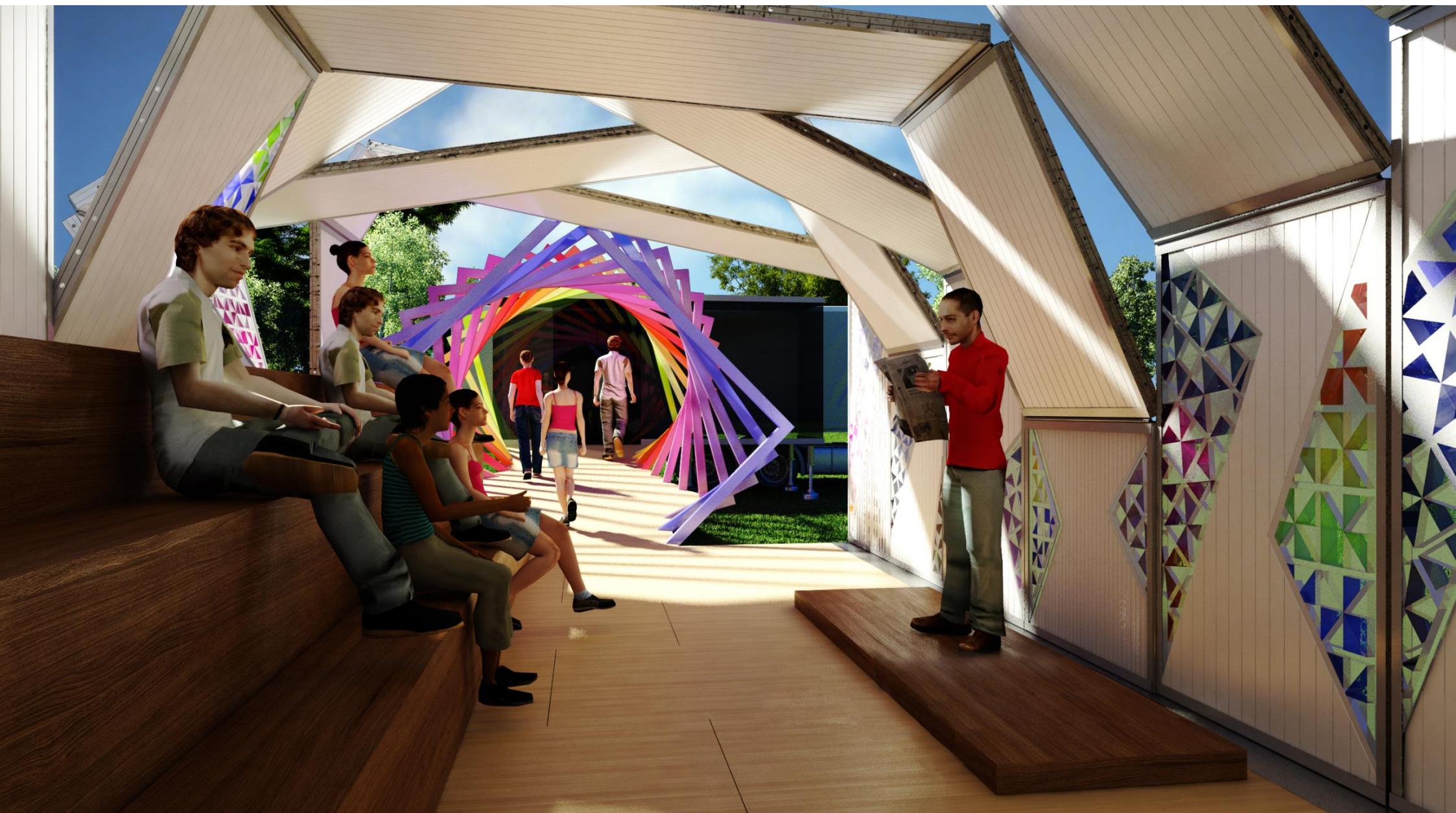
PERSPECTIVA 06 - POSSIBILIDADE DE USO - TEATRO