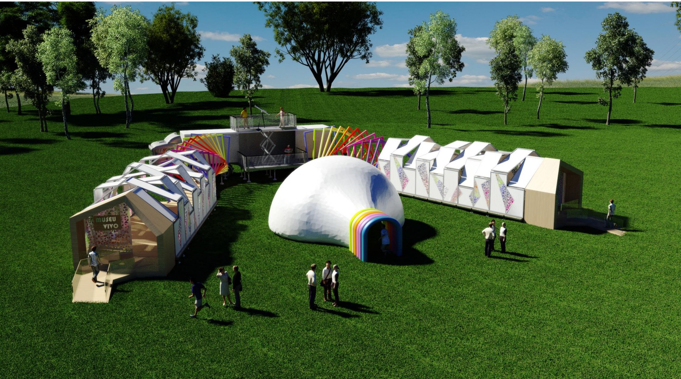
PERSPECTIVA 03 - VISTA EXTERNA EXPOSIÇÃO GRANDE