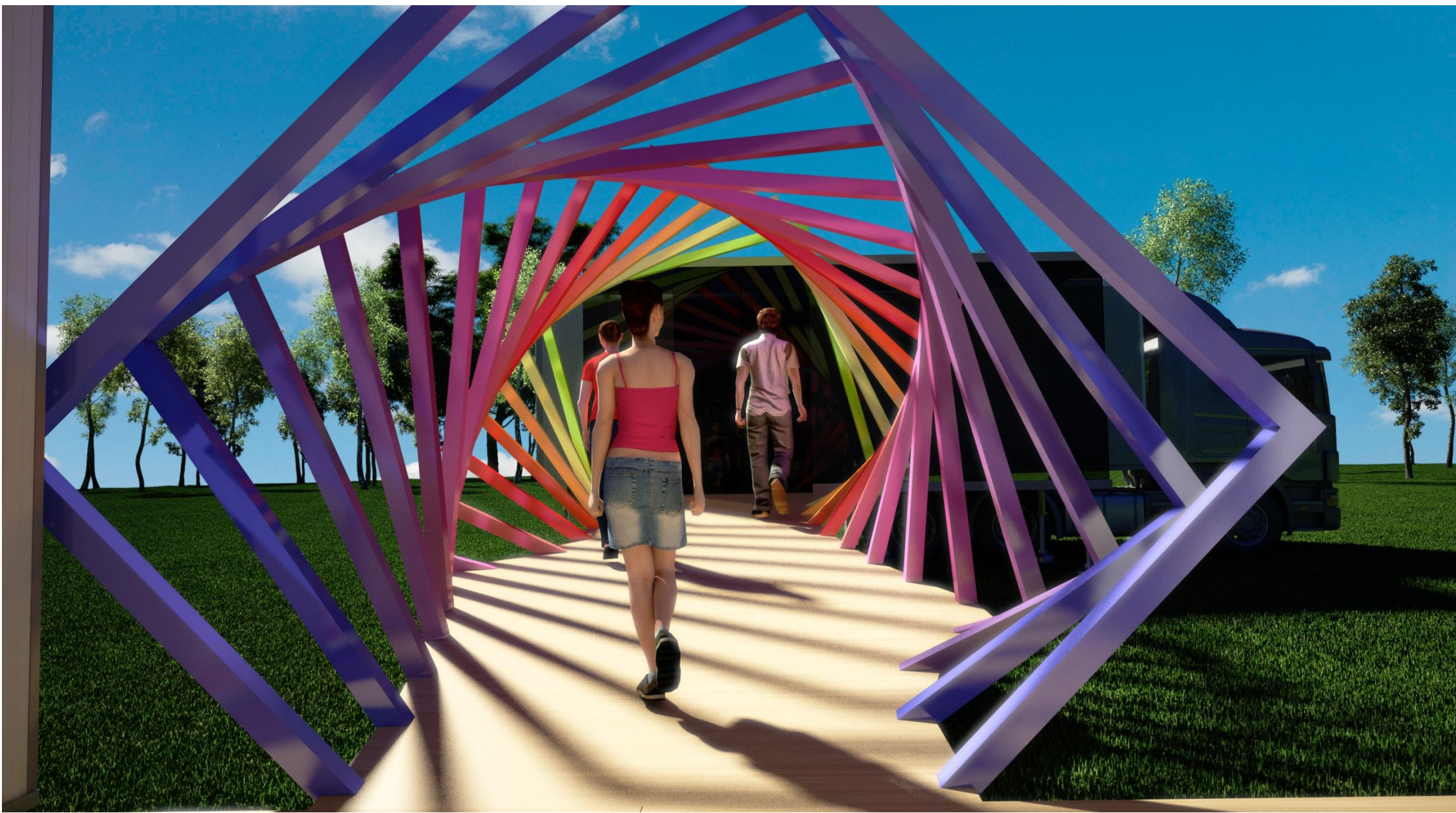
PERSPECTIVA 07 - PASSARELA