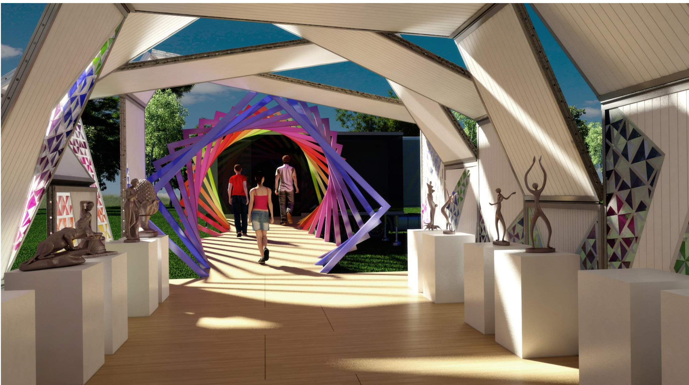
PERSPECTIVA 05 - POSSIBILIDADE DE USO - VISTA INTERNA EXPOSIÇÃO DE ARTES