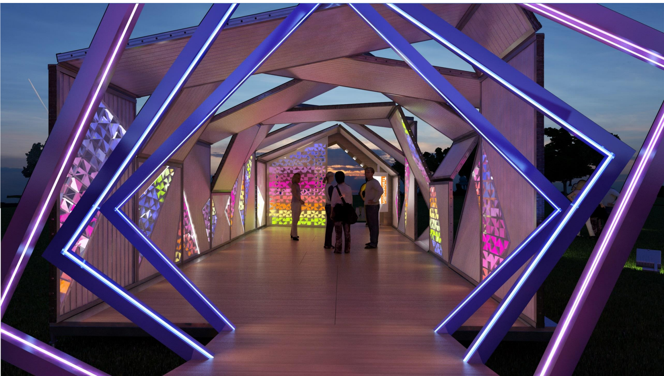
PERSPECTIVA 10 - VISTA INTERNA NOTURNA DO PAVILHÃO DE EXPOSIÇÕES