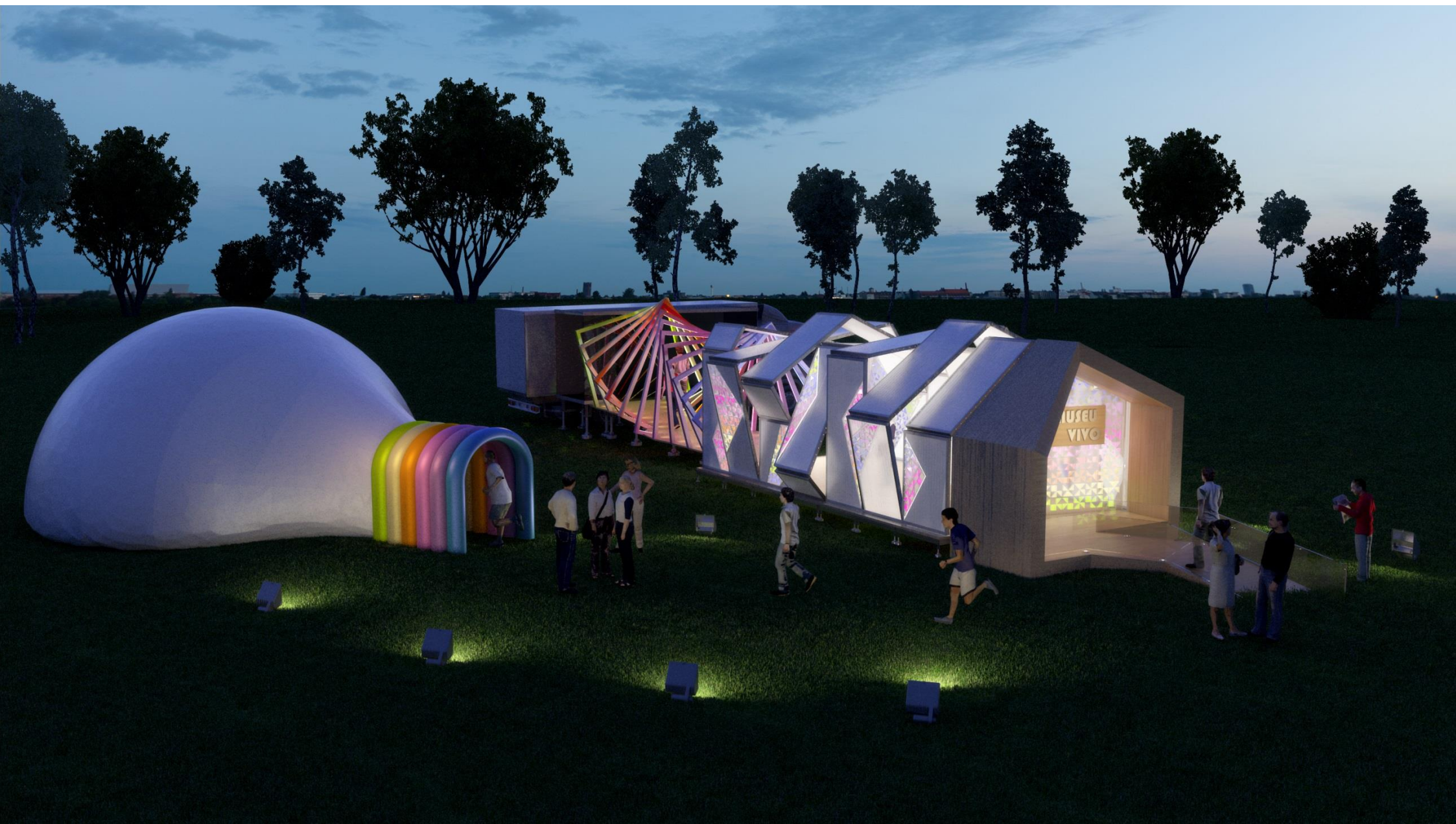
PERSPECTIVA 08 - VISTA NOTURNA