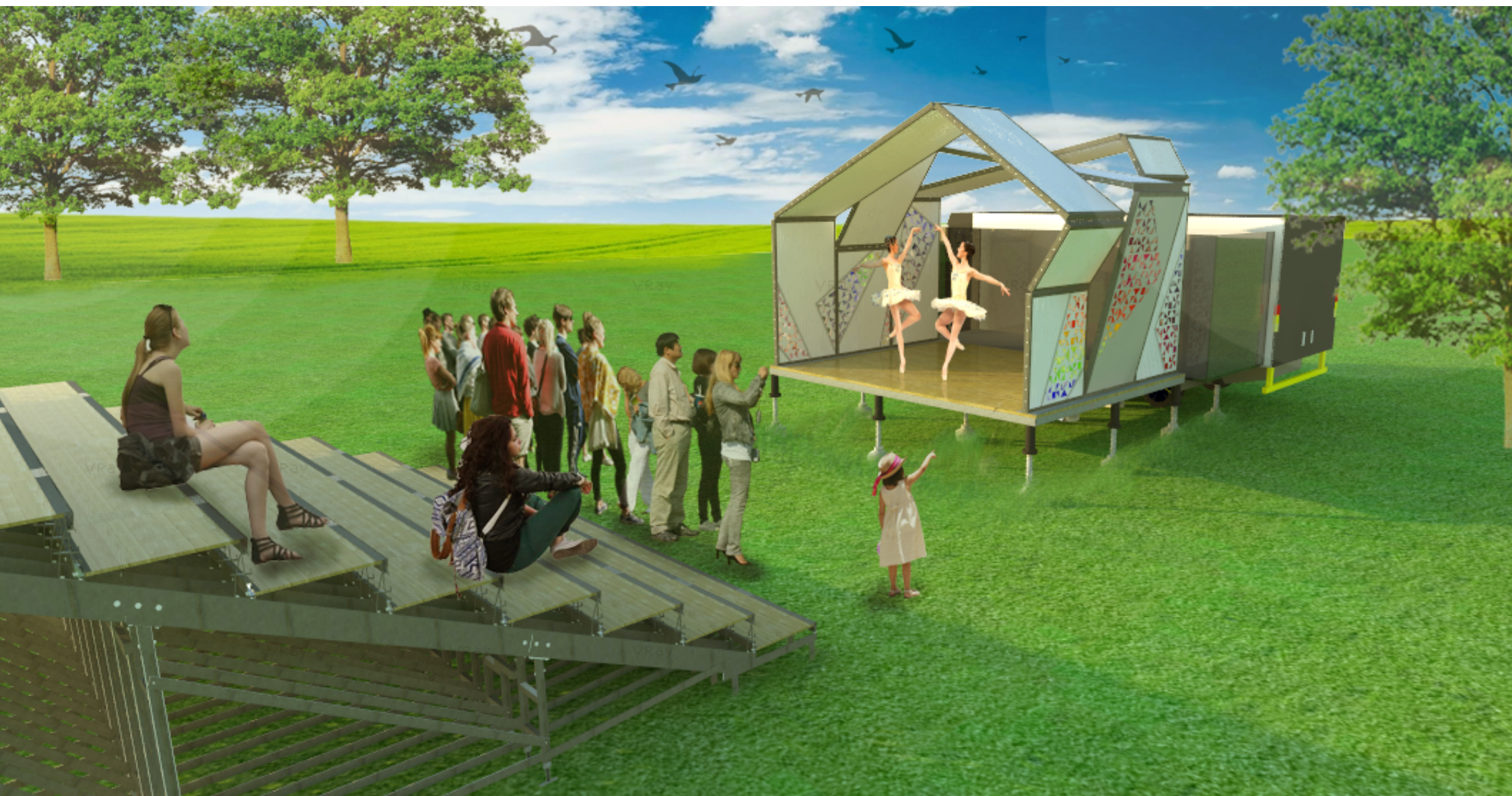
PERSPECTIVA 13 - POSSIBILIDADE DE USO – PALCO PARA APRESENTAÇÕES