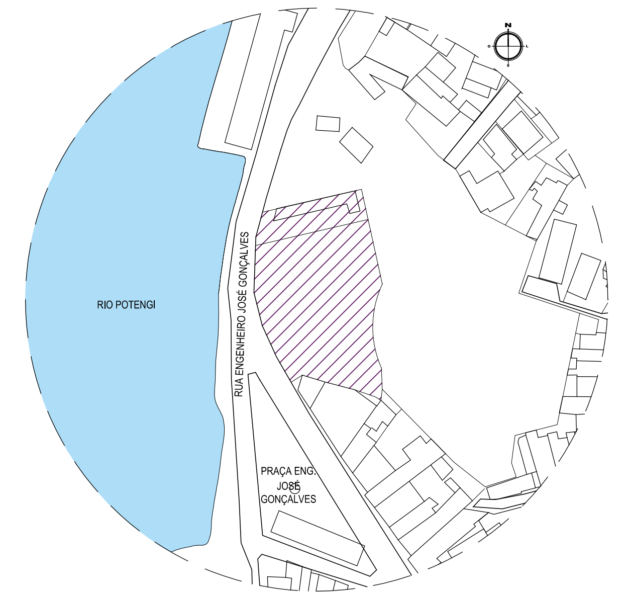
PLANTA DE SITUAÇÃO ESCALA 1/1250