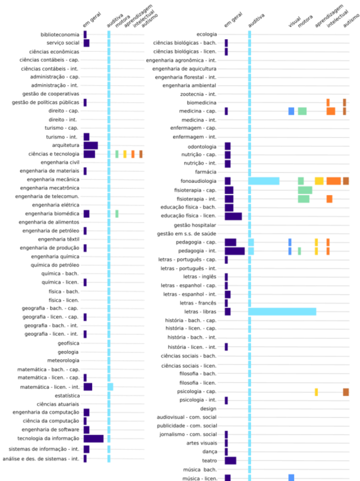
Figura 2. Quantidade de disciplinas nos cursos de graduação da UFRN por deficiência abordada.

Ao somar todas as ocorrências em disciplinas planejadas de cada tipo de deficiência, os cursos que mais explicitaram deficiências em seus currículos foram: Letras – Libras (30 ocorrências), Fonoaudiologia (25), Pedagogia, no interior (13), Medicina, na capital (11),