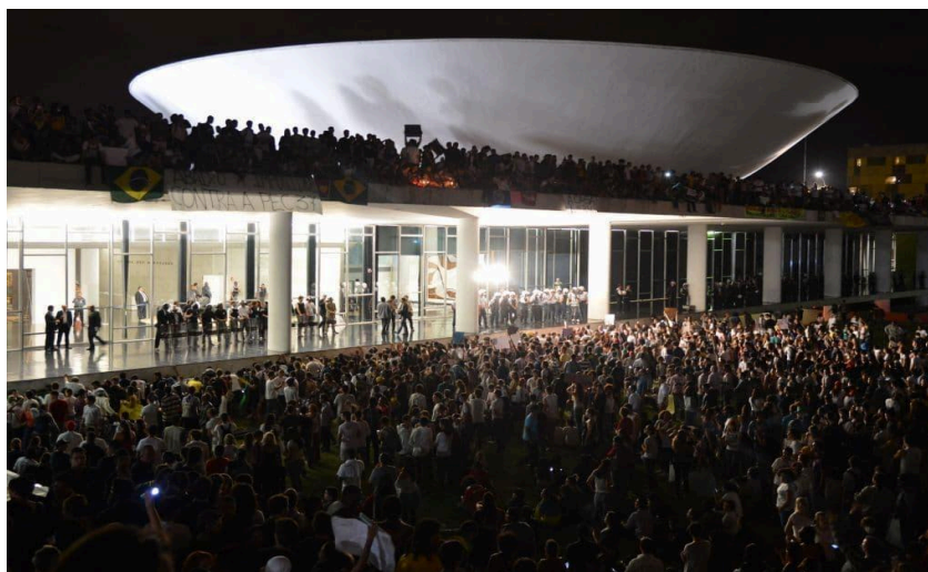
Figura 4 - Manifestantes tomam a Frente do Congresso Nacional, em junho de 2013