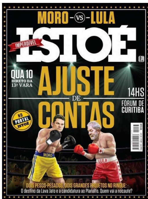
Figura 6 - Capa da Revista Isto é sobre o depoimento de Lula para o então juiz Sérgio Moro