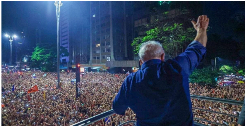
Figura 9 - Lula comemora vitória com simpatizantes na Avenida paulista