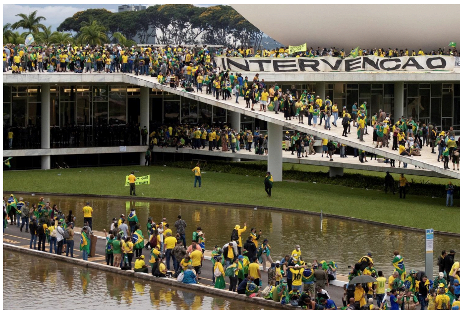
Figura 10- Golpistas invadem Brasília e atacam as sedes dos três poderes