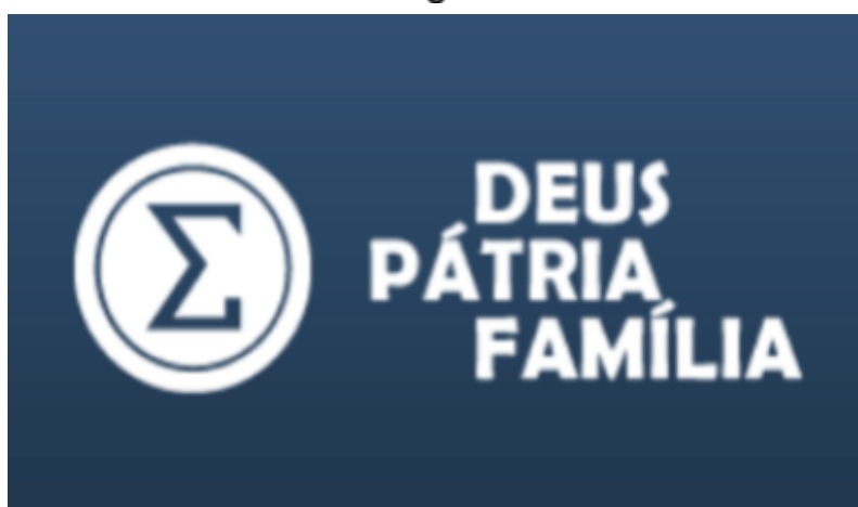
Figura SEQ Figura \* ARABIC 1 - Slogan do integralismo

Em 1932, com a publicação do Manifesto de Outubro, elaborado por Plínio, os integralistas criaram AIB, um partido de massa, bem como passou a adotar o lema, que recentemente foi apropriado pelos novos movimentos de extrema direita, que é o “Deus, Pátria e Família”, cujo o “Deus”, demonstra a influência religiosa cristã, a “pátria” tinha o significado de “lar”, os integralistas defendiam a unificação da população brasileira dentro do território , como uma forma de se contrapor a divisão da sociedade em classes, isso ocorreria por meio da criação de um Estado cooperativo, que saberia equilibrar os diferentes interesses existentes no meio da sociedade Por fim, a “família”, que tem seu significado ligado à manutenção da tradição ,sendo usada como instrumento para garantir a organização social .