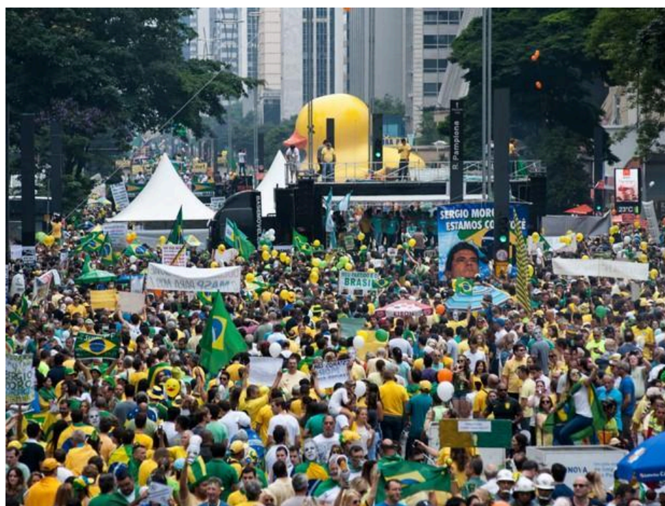
Figura 5 Manifestação contra o governo Dilma e em defesa da lava jato, em São Paulo

Além disso, o governo enfrentava ainda uma campanha massiva de oposição dos principais meios de comunicação do país, combinado com o desenrolar da Operação Lava Jato, iniciada em 2014, com objetivo de investigar um esquema de desvios de recursos na Petrobrás, realizando novas denúncias e prisões decorrentes do esquema, a piora econômica, com encolhimento do PIB e aumento da taxa de desemprego, bem como a crise política levaram ainda nos primeiros meses de 2015, ocorrência de diversas manifestações contra o governo, liderados por movimentos como o MBL e Vem Pra Rua, que passaram a defender o impeachment da presidenta, relacionando o PT e o governo com um projeto de implementação do comunismo no país, bem como os culpados pela corrupção e crise econômica vivenciada.