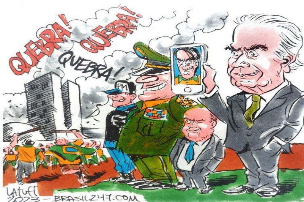
Figura 11 - Charge sobre " a quebradeira acontecida no dia 08 de janeiro".