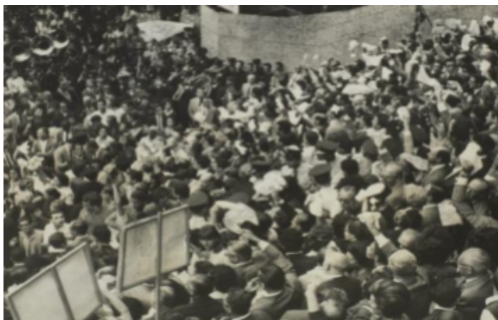
Figura SEQ Figura 1ª ARABIC 2 - Manifestantes na marcha pela liberdade em 19 de março de 1964 na Praça da Sé, em São Paulo

Os militares aproveitaram esse cenário de medo com uma eventual revolução comunista diante dessas medidas defendidas pelo governo Goulart, bem como o apoio dos empresários brasileiros, de parte da mídia e da igreja católica, que já tinha uma relação com o pensamento extremista de direita desde a década de 30, com os integralistas, destituem um governo legítimo e instituem uma ditadura militar.