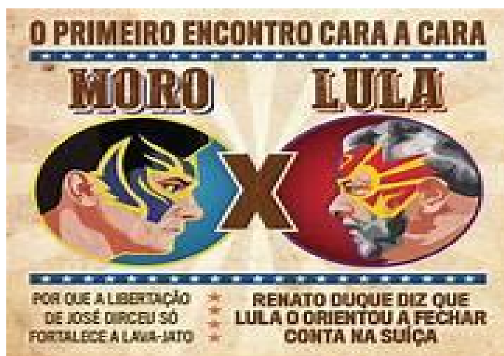
Figura 7 - Capa da Revista Veja retratando o primeiro encontro presencial entre Moro e Lula