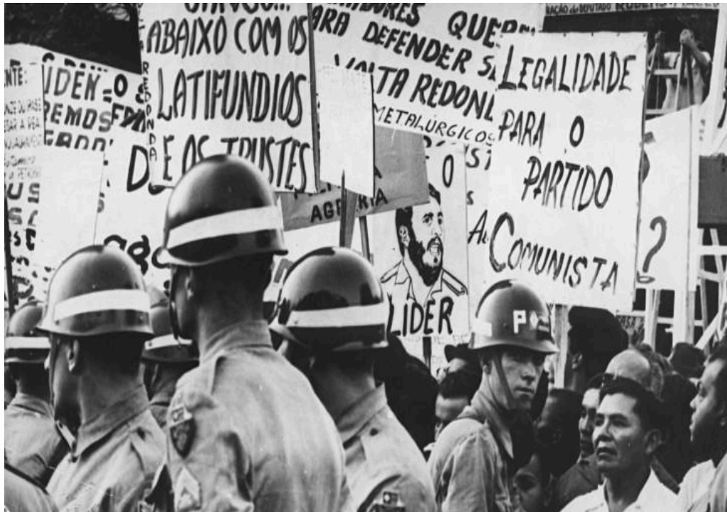
Figura 3 - Apoiadores das reformas de base se reuniram na Central do Brasil para ouvir o discurso de Jango em defesa das reformas