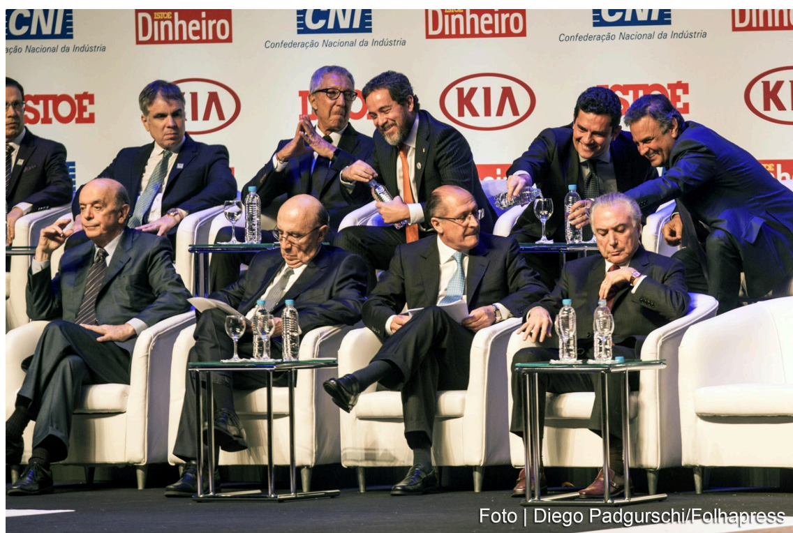
Figura 8- Premiação dos Brasileiros do Ano pela Revista Isto é