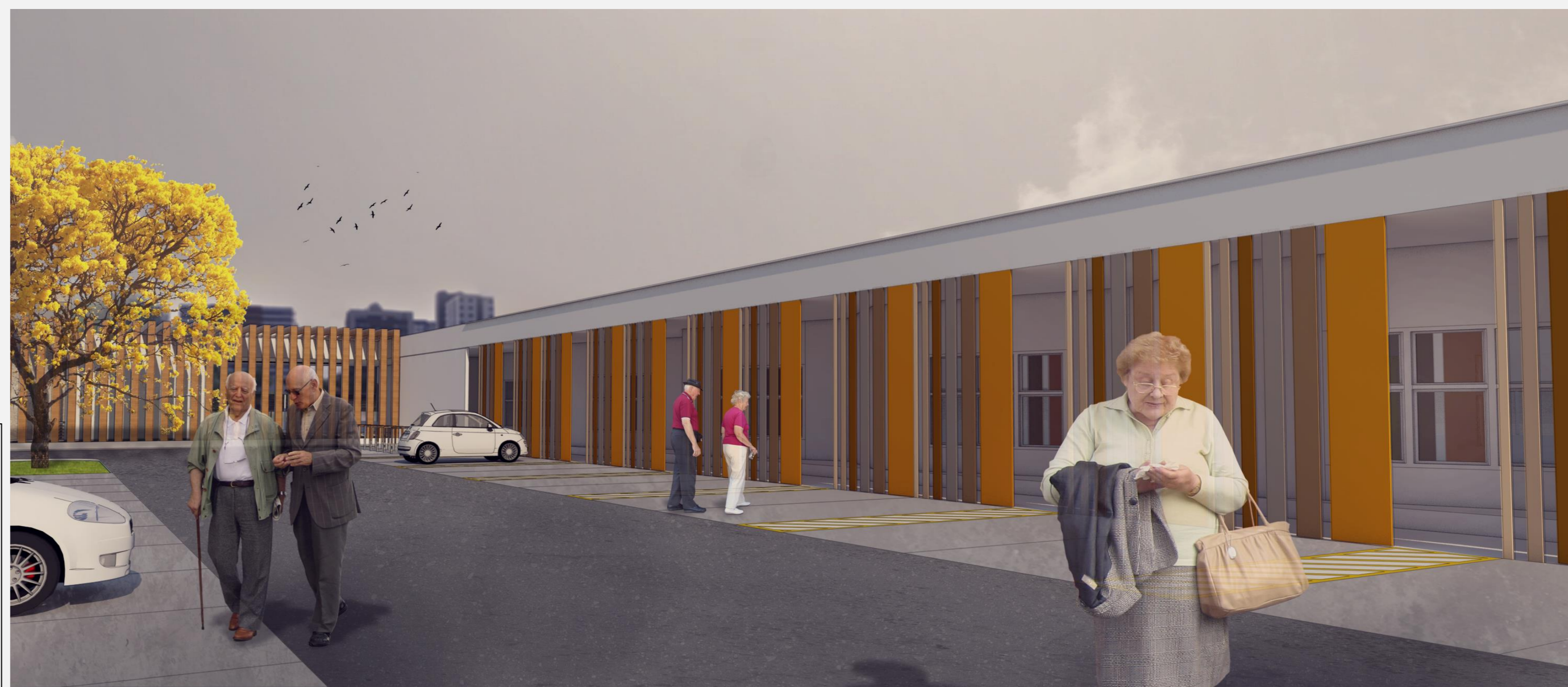
FIGURAS 05, 06, 07 E 08: PERSPECTIVAS DO ENTORNO E FACHADAS DO EDIFÍCIO.