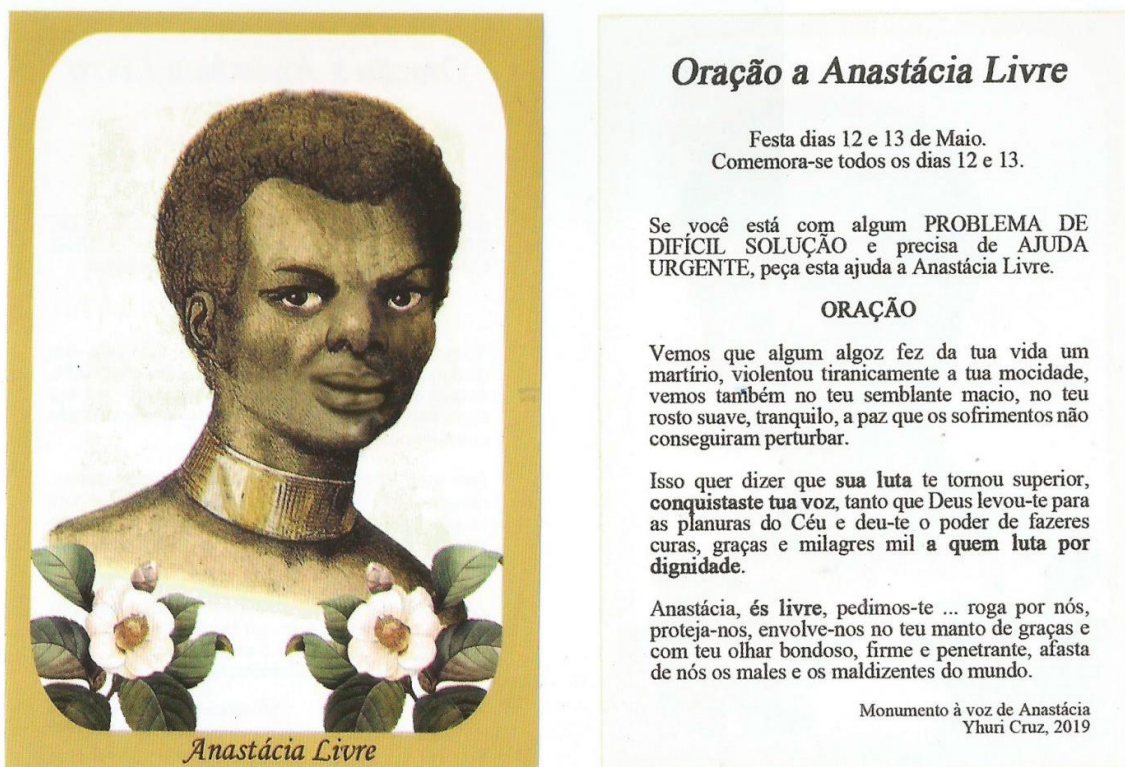
Figura 3: Monumento à Voz de Anastácia, Yhuri Cruz, 2019, disponível em: < http://yhuricruz.com/2019/06/04/monumento-a-voz-de-anastacia-2019/ >.

Nas palavras do designer Yhuri Cruz, é preciso celebrar Anastácia Livre (figura 3). Essa imagem fará parte dos livros de história da rede de ensino Eleva - que inclui escolas como Pensi e o sistema Elite, entre outras. A boca por baixo da máscara de flandres não é apenas um símbolo de tortura imposto pela branquitude. Ela também nos lembra que o projeto colonizador não teve completo sucesso em nos silenciar. Somos sementes: quando tentam nos enterrar, florescemos. Hoje, milhares de mulheres ecoam essa voz, e ela não será mais silenciada.