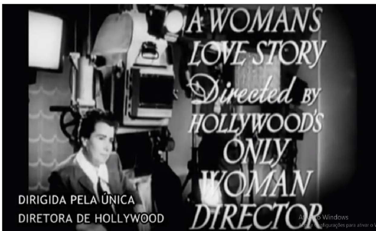
Figura 8 – Ida Lupino, a única mulher de Hollywood. Frame do filme ( E A MULHER , 2016, 38:41:10).

Dorothy Arzner continuou atuante até 1943. Começou como cortadora, pois não haviam convencionado o termo editor, aos 19 anos. Outras como Edith Head, que criou uma carreira como figurinista quando isso ainda nem existia, sendo vencedora de doze Oscar de melhor figurino. Com a Segunda Guerra Mundial, as mulheres foram incorporadas na força de trabalho, mas ao fim da guerra era considerado antipatriótico uma mulher ocupar o emprego de um homem que estivesse em casa.