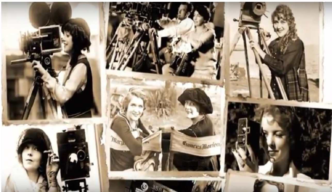
Figura 6: Fotografias de cineastas pioneiras. Frame do filme (E A MULHER, 2016, 00:06:13).