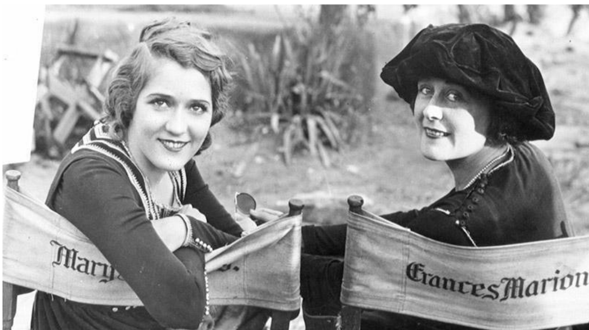
Figura 7: Mary Pickford e Frances Marion trabalhando juntas. Frame do filme ( E A MULHER , 2016, 00:21:27).

Os filmes de Lois Weber trazem nudez, temáticas sobre aborto, métodos contraceptivos, direitos reprodutivos e prostituição. Em 1913, ela escreveu, dirigiu, produziu e estrelou o filme Suspense . Ela criou seu próprio estúdio, sendo a primeira mulher a ter um estúdio com o seu nome, sendo a diretora mais bem paga da época, chegando a ganhar 5.000 dólares por semana em 1915, salário inédito não só para os diretores da época, mas para uma mulher. Foi a primeira a contratar Frances Marion (Figura 6), que se tornaria a única mulher a ganhar dois Oscar por melhor roteiro pelo filme O presídio , de 1930, e dois anos depois, por O Campeão . Frances Marion está nos créditos de mais de 400 filmes e foi a roteirista mais bem paga, entre homens e mulheres, de 1915 a 1935. Foi ela quem primeiro escreveu diálogos para figurantes assim como uma das primeiras a utilizar cenários reais. Ela começa a escrever filmes para Mary Pickford, entre 1914 e 1920 fizeram mais de doze filmes juntas.