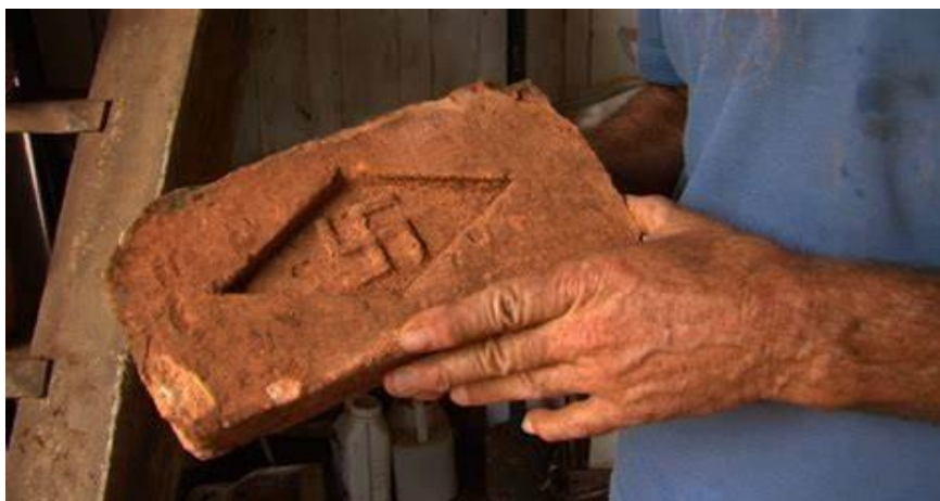
Figura 2: Suástica na bandeira do Brasil. Frame do filme ( MENINO , 2016, 00:05:00).

Infelizmente o racismo não é exclusivo da Europa, América do Norte e Austrália (pra citar apenas aqueles continentes). Também na América Latina, há muitos séculos observa-se um forte racismo contra os povos indígenas e os afrodescendentes, ainda que frequentemente negado por aqueles que o cometem, ou seja, os povos de descendência europeia (Dijk, 2008b, p. 8).