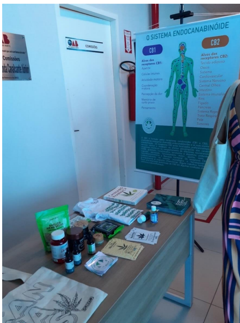
Figura 7 - Banca da associação com exibição de produtos e cartaz informativo

Como a maconha é uma planta que foi domesticada e geneticamente modificada por humanos (Ribeiro, 2023), cada cepa é constituída por uma quantidade maior ou menor de cada canabinoide que a constitui. Dessa forma, uma planta com maior quantidade de THC, por exemplo, pode ser usada para um fim medicinal específico de alguém que precisa desse composto. O mesmo se dá para o CBD, e outros compostos da planta.