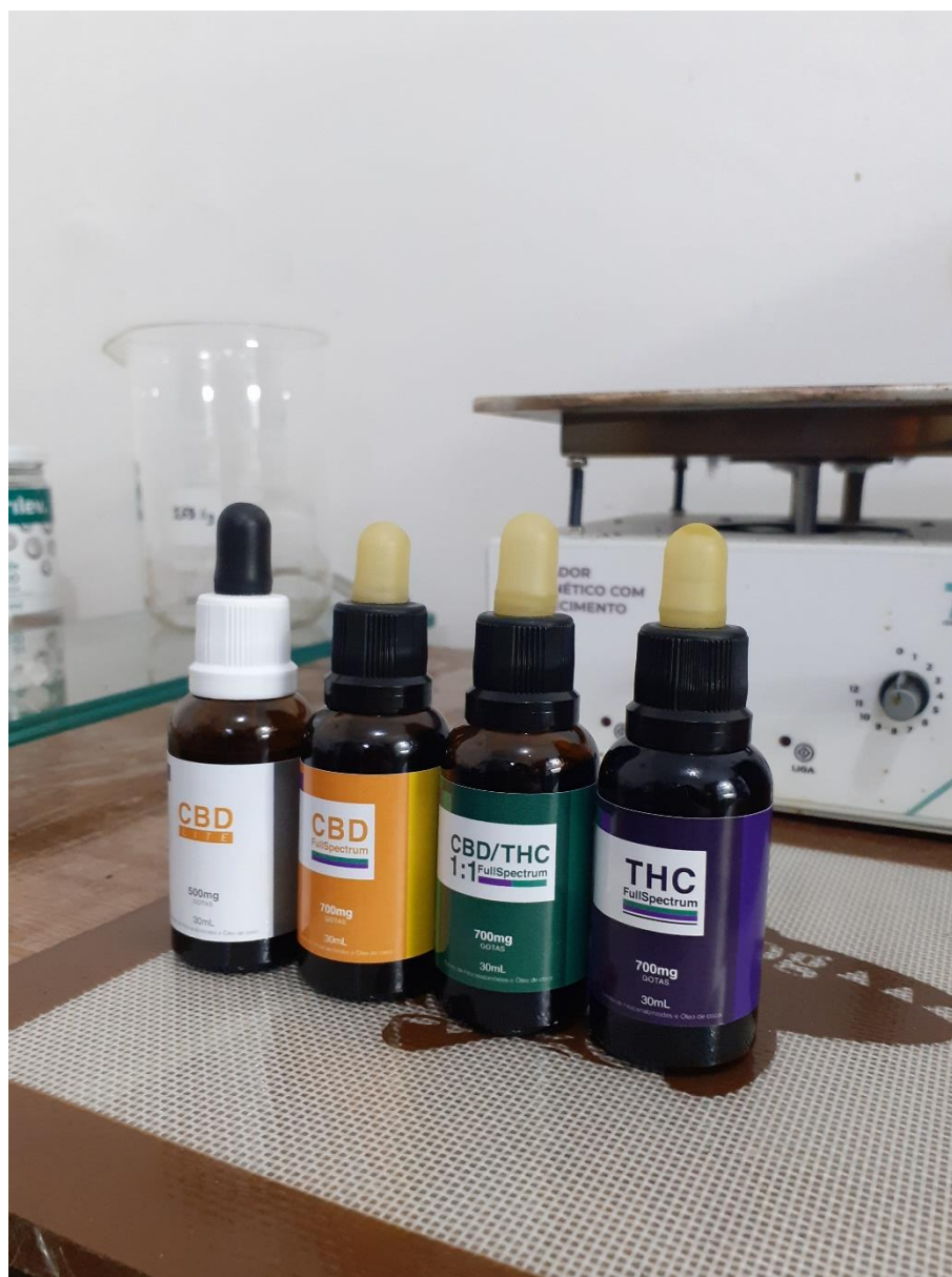
Figura 2 - Frascos dos óleos produzidos pela associação