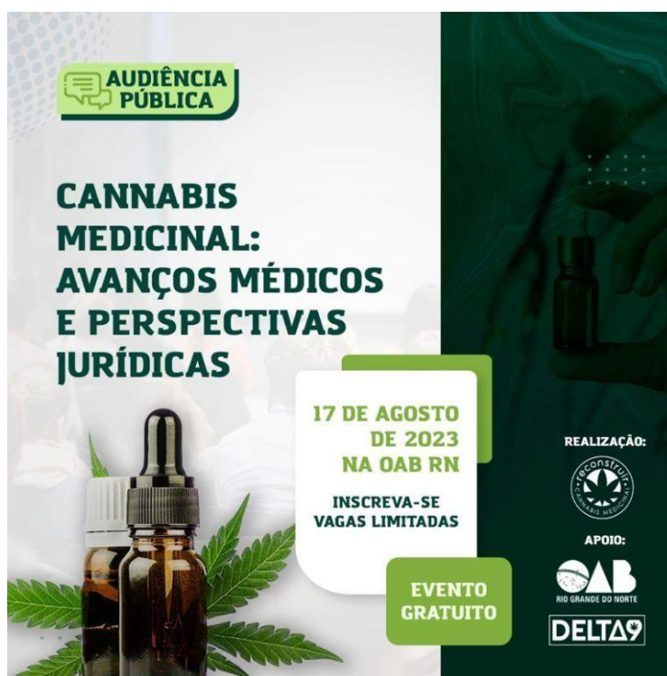
Figura 6 - Cartaz de divulgação do evento

Fonte: https://reconstruir.org.br/ . Acesso em: 20 jul. 2024.