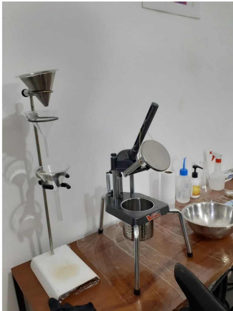
Figura 3 - Equipamentos utilizados para feitura do óleo de cannabis

formalidade, mas como uma condição essencial para a efetividade dos tratamentos.