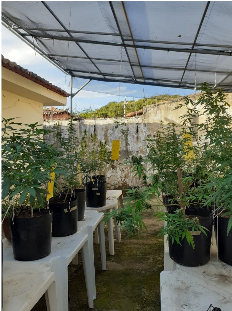
Figura 4 - Plantas cultivadas para produção do remédio