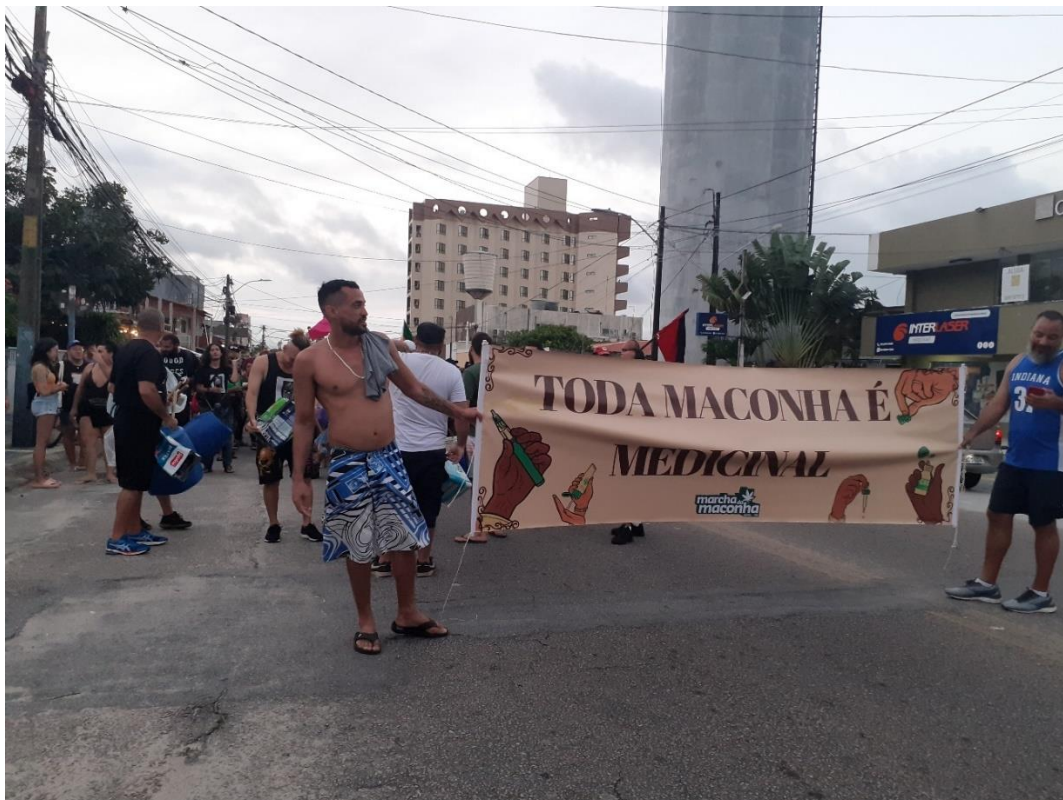
Figura 9 - Cartaz da Marcha da Maconha com o mote “Toda maconha é medicinal”

folhetos e na faixa exibida na Figura 9. O evento contou com ampla participação de pessoas que se identificavam como usuários da planta e de apoiadores da causa. O ambiente, embora festivo, também foi marcado por críticas à atuação da polícia e ao proibicionismo.