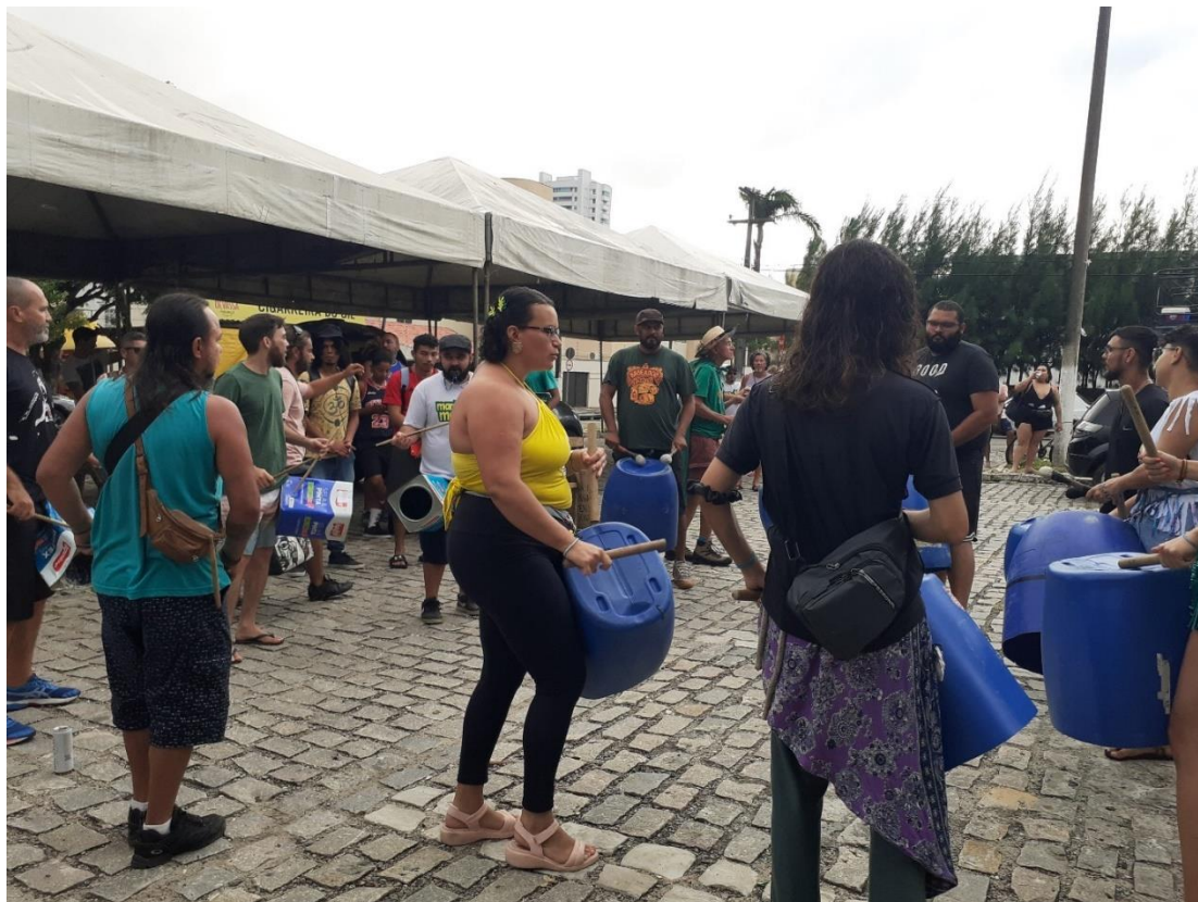
Figura 8 - Batuque na concentração da Marcha da Maconha