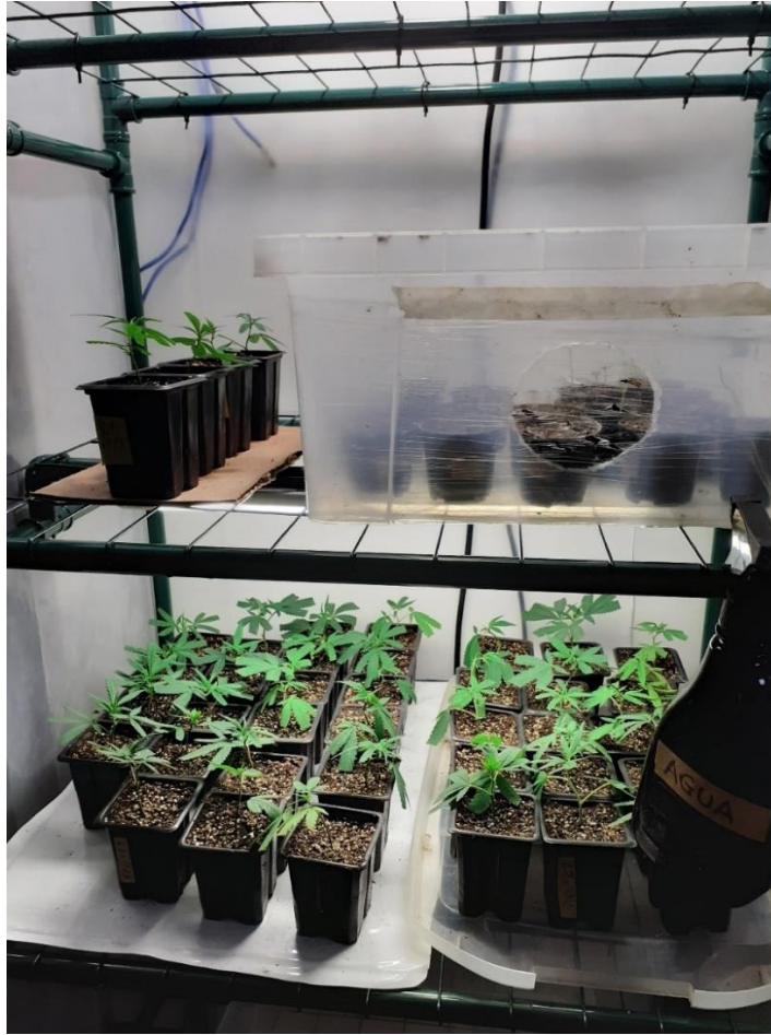
Figura 5 - Plantas em estágio inicial com cultivo indoor