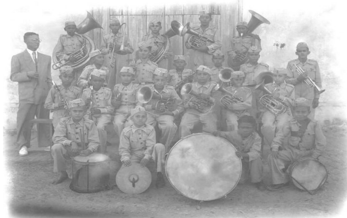
Figura 5 - Banda Paroquial de Adolescentes, fundada em 1944