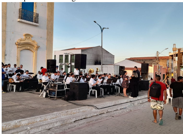
Figura 17 - Banda posicionada e organizadores do evento conversando com o maestro

cidade ou comunidade e, nesse aspecto, Seeger (2008, p. 255) assegura que se compreendemos que “a performance, a audiência e os horários de performance podem ser usados para construir um conjunto de expectativas sobre a música na comunidade. Alguns tipos de música, no entanto, serão apropriados a diversos locais, tempos e audiências”. A partir da visão do autor, fica explícito que a música vai se adequar às peculiaridades de um evento, neste sentido, como se trata diretamente de um concerto musical, é possível entender que o repertório será baseado tanto na música de concerto de tradição europeia, quanto na música popular brasileira.