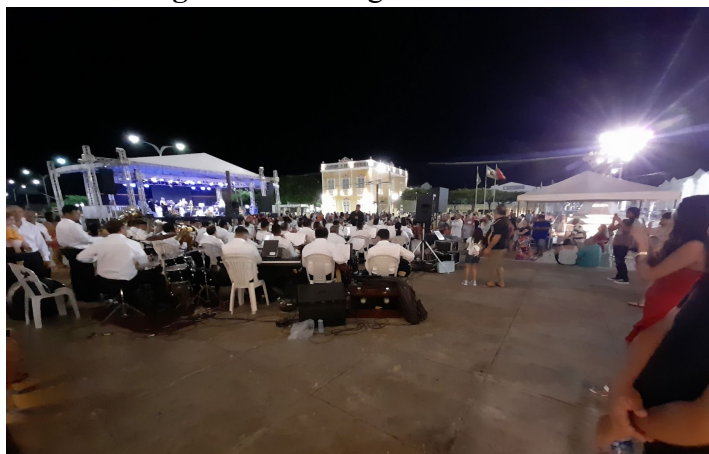
Figura 20 - Vista geral do concerto