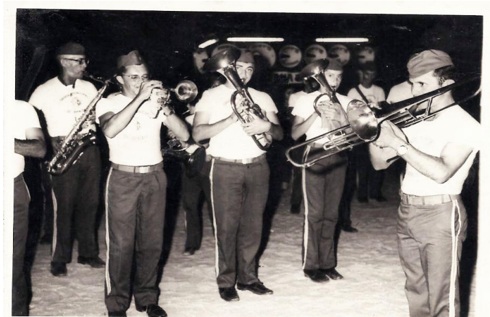
Figura 7 - Banda Jacques Klein atuando em 1979

que durante as décadas de 90 até os anos 2000, ainda mantinha o trabalho educativo com jovens e adultos, que sonhavam ingressar na banda.