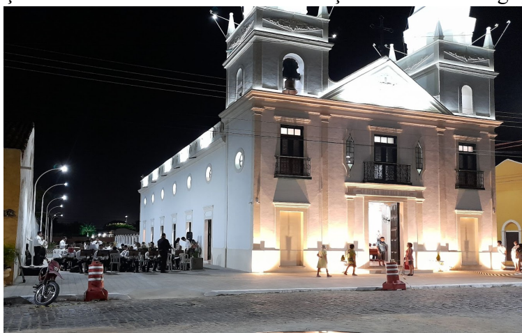
Figura 22 - Disposição da banda no evento em comemoração da reforma da igreja do Bonfim

Assim, já no local do evento, identificamos que a banda Jacques Kleins já estava se organizando para começar sua apresentação posicionada na lateral da igreja, constatamos, também, que não estava na formação marcial, mas com a flexível. Outro detalhe observado, foi o fato de não ter saído, tocando pelas ruas da cidade como, geralmente, fazia quando solicitada para as festas e/ou eventos organizados pela igreja católica.