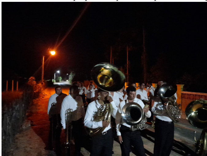
Figura 18 - Agrupamento de músicos se preparando para acompanhar o cortejo na formação marcial