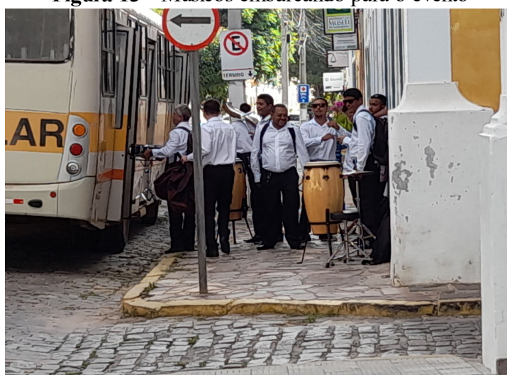
Figura 13 - Músicos embarcando para o evento

percebemos que o casarão, que antes era habitado por um coronel, se transformou em um lugar para acessar e produzir arte. Frente aquele patrimônio, constatamos que já havia uma transformação do espaço, após a chegada dos músicos. Eles se cumprimentavam, brincavam fazendo piadas entre si e, ao mesmo tempo, dirigiam-se às intermediações do prédio para pegarem seus instrumentos, pois os dois ônibus já estavam estacionados para levá-los ao local do evento. Antes da entrada dos músicos no ônibus, o maestro solicitou que os musicistas da percussão se ajudassem, durante o carregamento do equipamento, e que guardassem uma parte do equipamento no bagageiro lateral do ônibus e a outra parte no fundo do ônibus. Após a acomodação dos músicos e do equipamento, perguntamos ao maestro se podíamos acompanhá-los no ônibus e ele respondeu que sim.