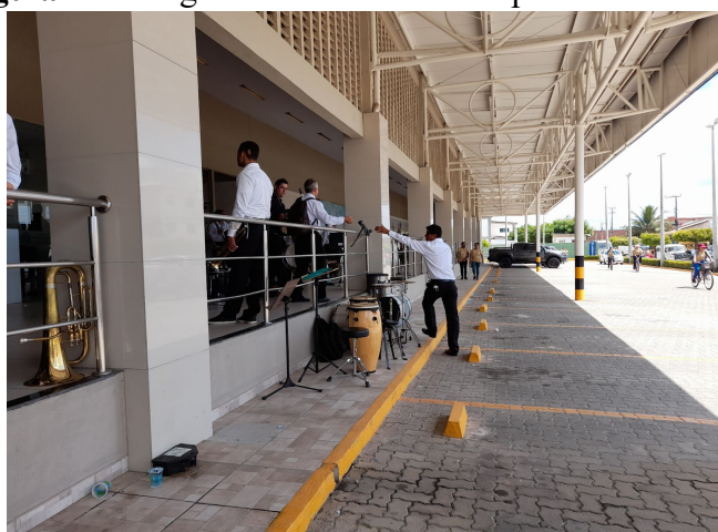
Figura 14- Chegada dos músicos nas dependências do CCI

Vale ressaltar que a solicitação da banda Jacques Klein é realizada, via ofício, enviado ao gabinete do prefeito para despacho. A maioria dos pedidos de solicitação da banda são aceitos e encaminhados à Secretaria que informa o maestro sobre dados gerais como local, horário e transporte. Entretanto, a apresentação da banda no CCI faz parte da hospitalidade entre a Prefeitura Municipal de Aracati e o Governo do Estado do Ceará para abrilhantar o evento.