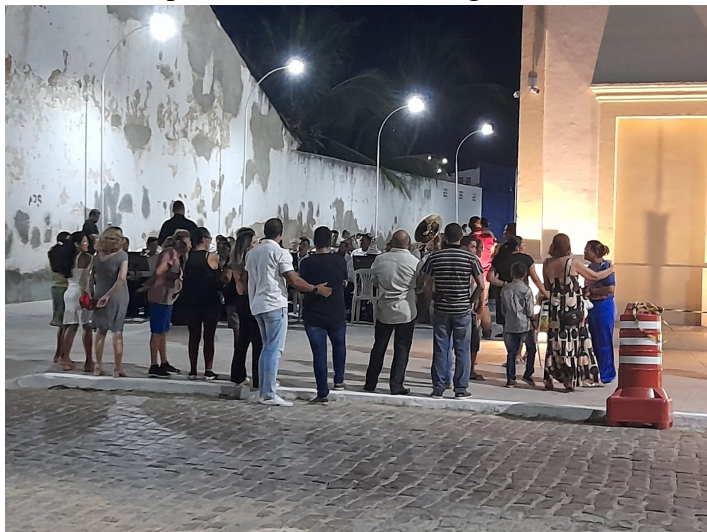
Figura 21 - Municípes conversando e interagindo com a banda