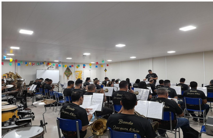
Figura 13 - O ensaio da banda