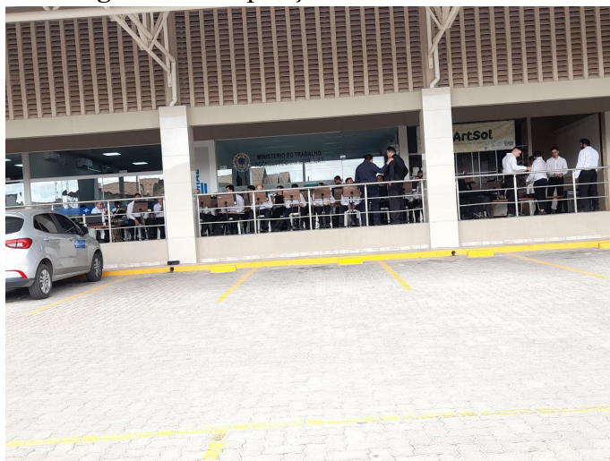
Figura 15 - Disposição da banda no evento