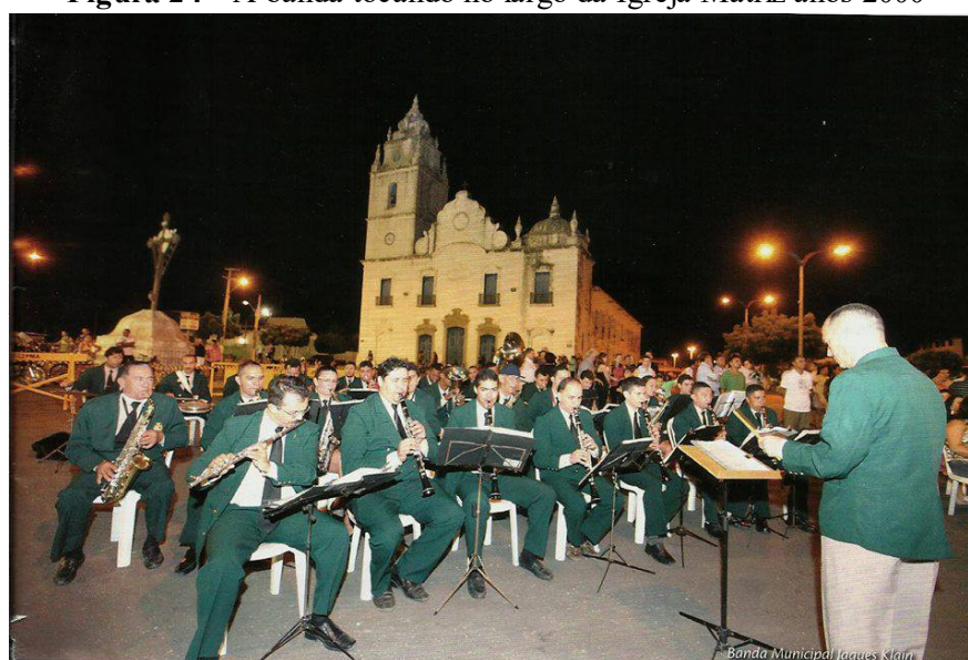
Figura 24 - A banda tocando no largo da Igreja Matriz anos 2000

Durante os anos 2000, a banda Jacques Klein possuía 35 (trinta e cinco) músicos e sua organização era moderna, com flexibilizações na instrumentação e era comum ver a banda passar pelas ruas em direção aos lugares dos eventos. Vale destacar que foi já na década de 90 que a banda começou apresentar flexibilidade enquanto à formação em determinados eventos. Neste período, era bastante comum a incorporação da bateria e de alguns instrumentos idiofônicos e de membrana como bongôs, triângulos e efeitos para executar outros gêneros musicais, como o baião e o mambo.