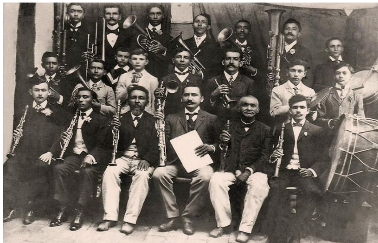
Foto 1 - Filarmônica Zaranza, fundada em 5 de dezembro de 1826