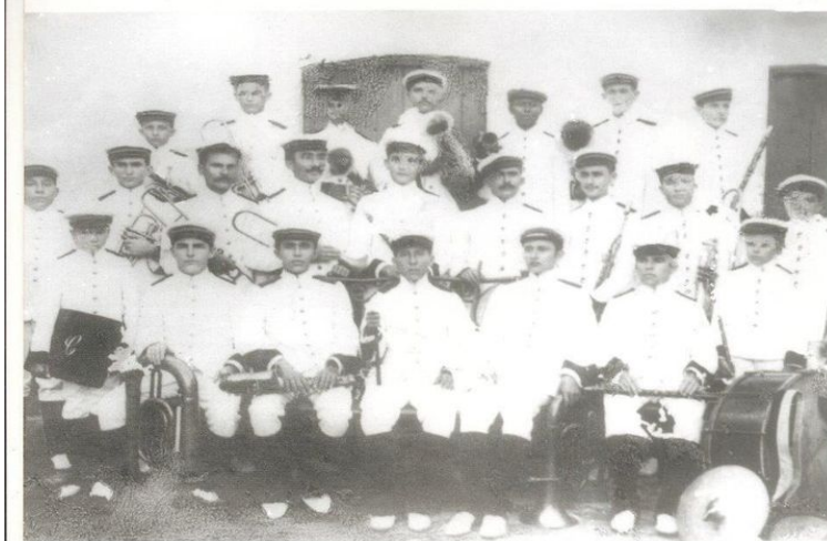
Figura 3 - Charanga 24 de Maio, fundada pela família Costa Lima