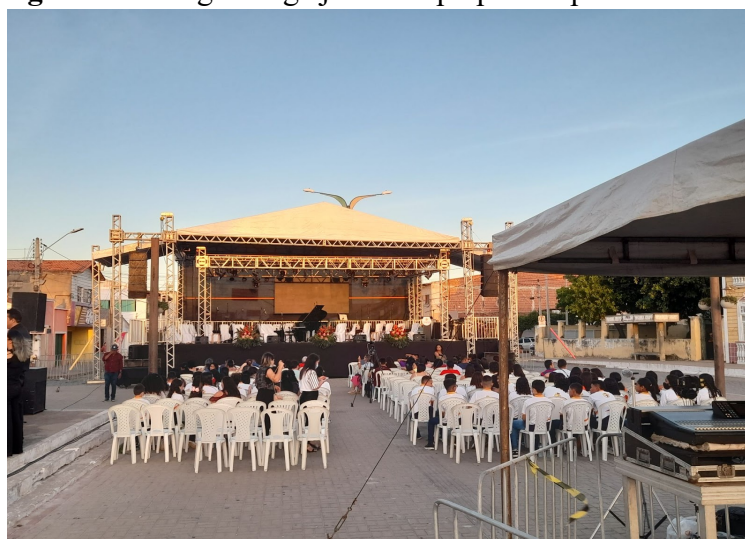
Figura 19 - Largo da Igreja Matriz preparado para o concerto

documentos como lps, medalhas, certificados e fotografias do patrono musical, filho de Aracati, Jacques Klein. Aquele momento foi fantástico, pois ter a oportunidade de ficar mediante objetos pessoais do pianista fez-nos repensar sobre o quanto uma missão musical, bem consolidada, consegue inspirar pessoas a manterem viva a memória e a produção de grandes músicos. Ao sairmos da recepção, percebemos que o Largo da Matriz já estava mudado, pois havia grande estrutura de som e de palco, cadeiras posicionadas de frente ao palco para os ouvintes, os blocos de madeira e a iluminação estavam sendo ajustadas para apresentação da orquestra Jacques Klein e a banda Jacques Klein já estava posicionada nas proximidades do largo, de frente para o Paço Municipal. Naquele momento, já era perceptível a circulação de pessoas no local do evento, estruturalmente falando, já estava tudo pronto para o evento de natureza pública.