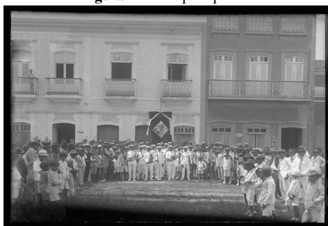
Figura 4 - Euterpe Operária

Iniciada a 22 de dezembro com a cerimônia da Bandeira, partindo da Igreja Matriz, conduzida por um grupo de senhoritas e crianças e hasteada ao som de cânticos, em frente daquela Capela, local, onde nas noites de 23 e 31 deste mês, o reverendíssimo padre Manuel Antônio Pacheco S.J. oficiará o novenário, com pregação e Benção do Santíssimo Sacramento. Diariamente, Missa cantada, às 7 horas, com comunhão geral dos integrantes das associações religiosas da paróquia. No dia 1º de janeiro, Missa solene e sermão às 10 horas; à tarde, solene procissão, como de costume, pelas principais ruas da cidade, com grande afluência de fiéis. Em todos os dias da novena, a presença da popular e garbosa Euterpe Operária. Nos três últimos dias, as festas foram abrilhantadas com a galhardia e vivacidade da famosa Euterpe Afonso Lima de São Bernardo das Russas (LEAL, 2003, p. 49)