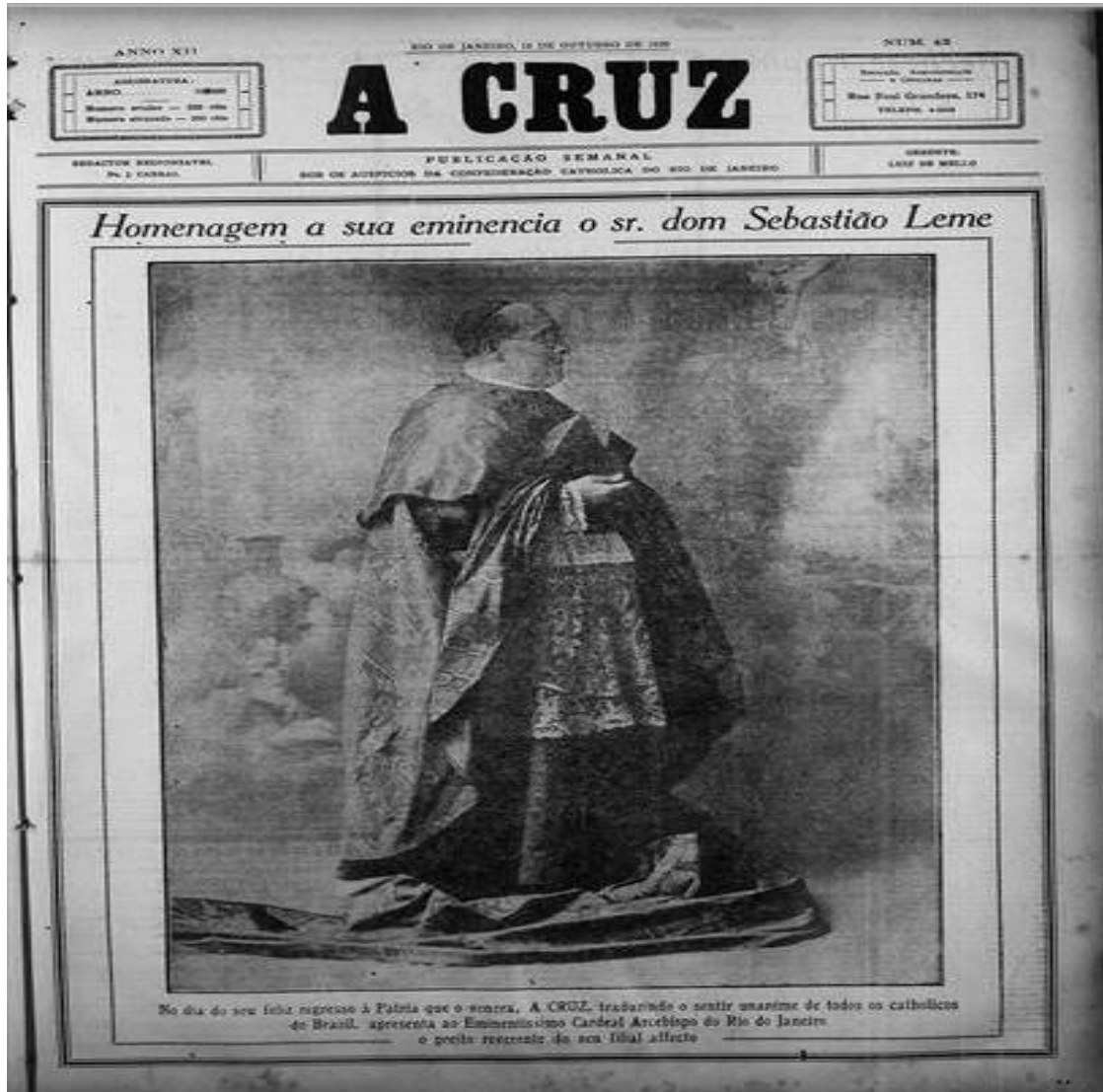
Figura 01 – Capa do jornal “A Cruz” - Cardeal Leme 80 .