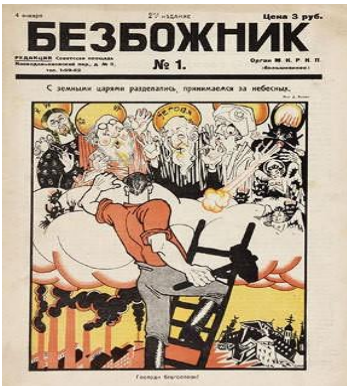
Figura 04 – Capa da Revista Bezbozhnik u Stanka 174

A citação acima (se confirmada) é uma manifestação clara e contundente de ódio aos cristãos e as religiões em geral. Ao dizer que derrubaria os reis dos céus e logo em seguida conchamar a luta contra todas as religiões, o líder soviético demonstra da forma mais radical possível a antirreligiosidade que o Pe. J. Cabral aponta ser um dos principais alicerces do bolchevismo soviético. Não foi possível atestar a veracidade da citação, porém podemos atestar que havia uma propaganda antirreligiosa em circulação na União Soviética. O Jornal