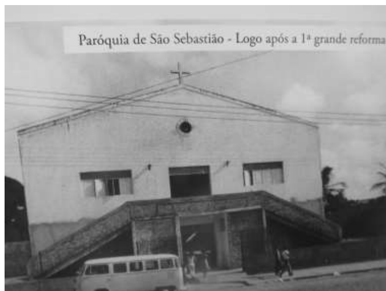
Figura 5 - Igreja após a primeira reforma realizada pelo padre Valdemar Fernandes