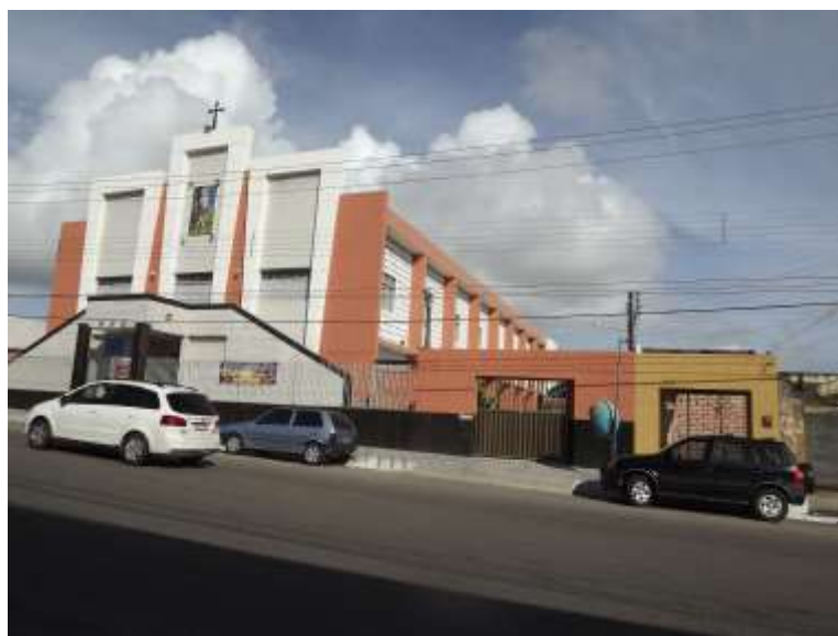
A igreja matriz fica localizada na Avenida 9 entre casas de um lado e de outro.