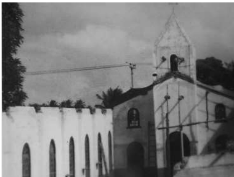
Fonte: Livro publicado em comemoração aos 65 anos de paróquia na festa de 2014.