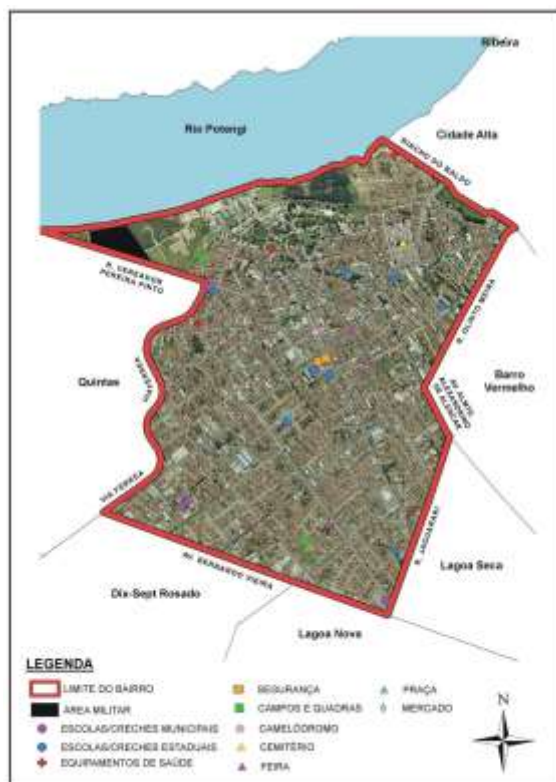
Figura 12 - Mapa 2 – Área do Bairro do Alecrim