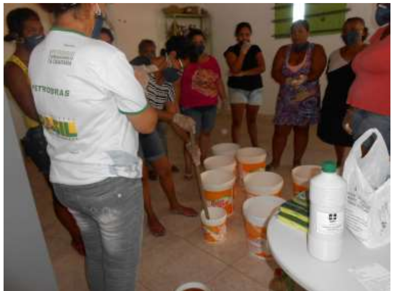
Oficina de Sabão com as mães que têm os filhos cadastrados no Projeto