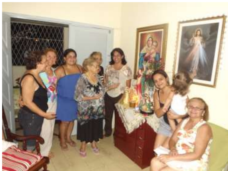
A organização do altar muda de São Sebastião.