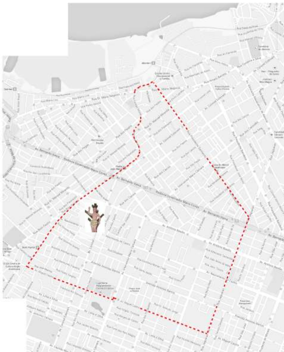
Figura 7 - Mapa 1- Limites geográficos da Paróquia de São Sebastião.