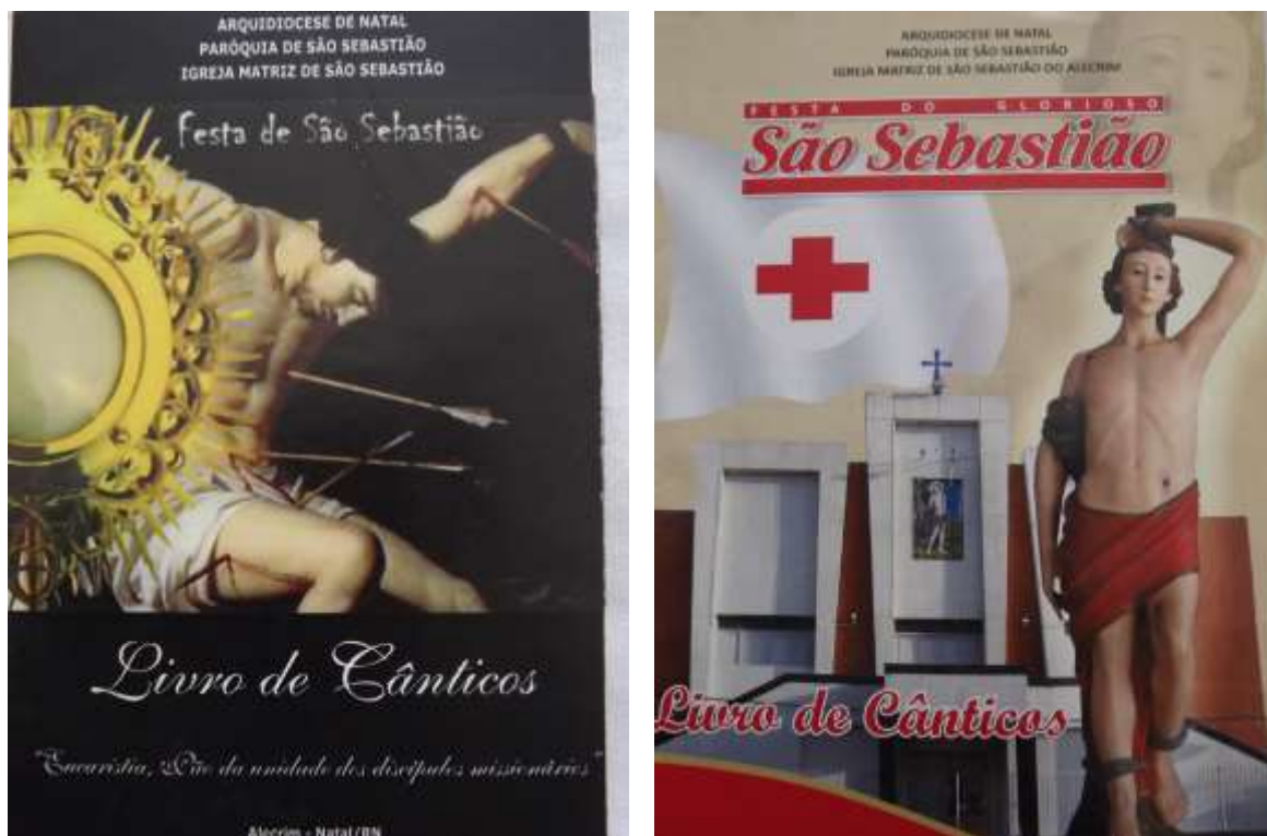
As duas artes que foram utilizadas na festa de São Sebastião em 2010.

Figuras 29 e 30– Capa com as imagens do folder e Capa do livrinho de cânticos.