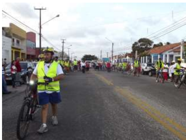
Figura 57 – Bicicletas que seguem à frente da procissão de São Sebastião.

Outros participantes carregam seus cartazes fazendo propaganda das atividades com seus horários respectivos: “oração de cura e libertação no Eremitério em Macaíba”; “é o amor que converte os corações e promove a paz”. E há também quem exponha na porta de casa a bandeira do Brasil. Todo simbolismo ganha sentido, comunica nesta hora.