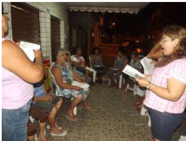
Grupo rezando a pré-novena na calçada da casa de uma devota na Av. 8.