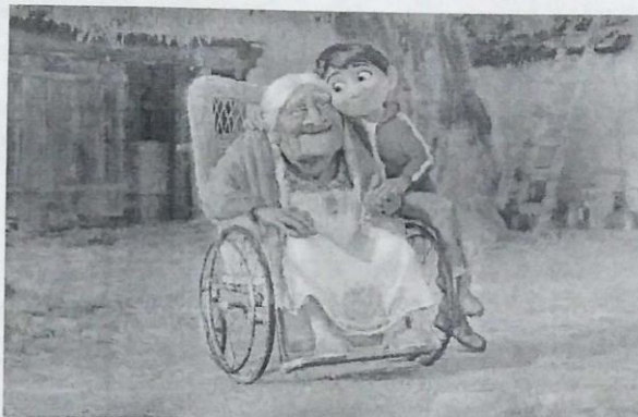
Viva – a vida é uma festa! (2017)