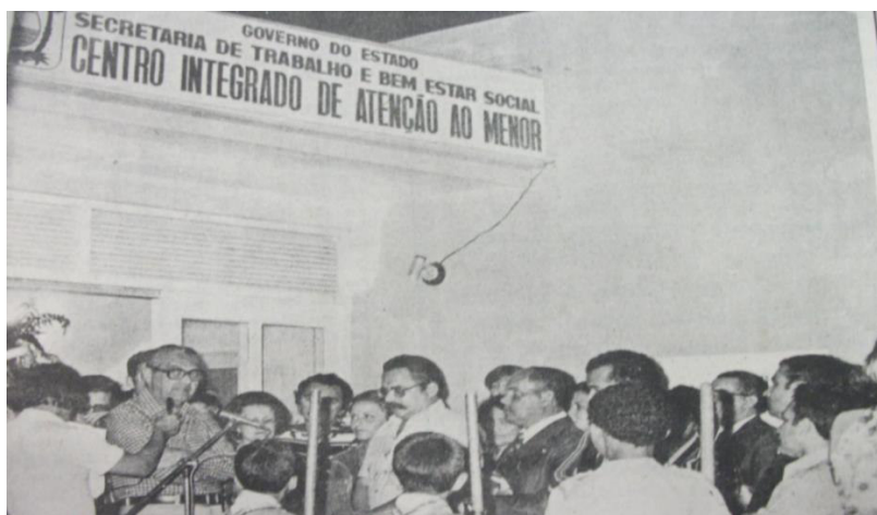
Figura 3: Inauguração do CIAM.