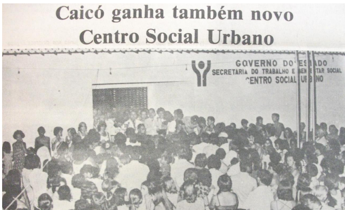
Figura 5: Inauguração do CSU de Caicó.

Com os CSU’s, a abrangência da assistência não se limitava ao acolhimento da criança e do adolescente em atividades preventivas em relação à marginalização, sejam elas educacionais, esportivas, profissionalizantes, culturais ou de lazer. Este programa tinha a finalidade de impulsionar o processo de desenvolvimento comunitário e a promoção da população economicamente pobre. Era fundamentalmente um programa de incidência na comunidade, visando seu desenvolvimento e sua autonomia. As atividades desenvolvidas compreendiam formação e assessoramento a grupos de base, assessoramento às obras sociais, treinamento de líderes, educação comunitária, assistência às crianças e à família, prática de esportes e estímulo e incentivo à cultura local.