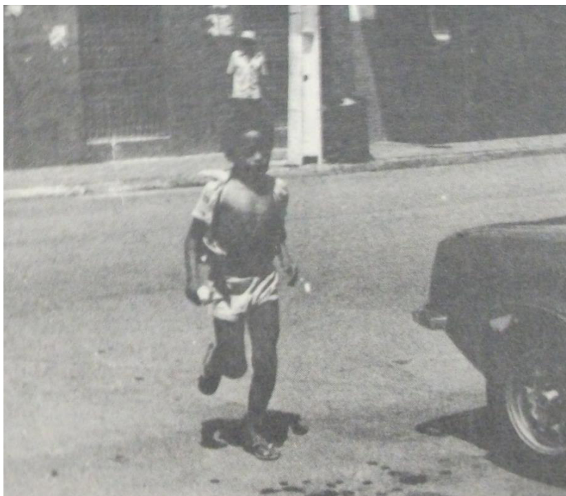
Figura 4: “Menino de rua” em Mossoró.

A reportagem seguiu como um alerta tanto para as autoridades, quanto para a sociedade, no sentido de mostrar que o problema não é propriamente das famílias, tampouco das crianças e adolescentes, vítimas neste processo de marginalização. Na verdade, a notícia expõe o cuidado que se deveria ter com o tema abordado, indicando que este (já nesta época) era um problema não da família, não somente do Estado, mas também de toda a sociedade.