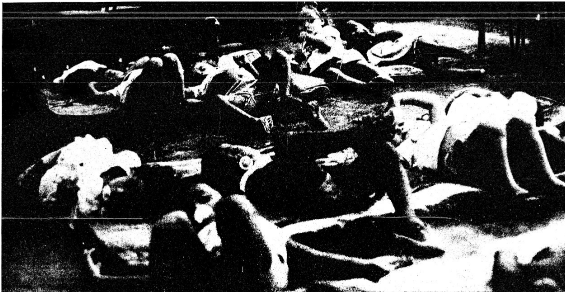
Figura 8: Crianças deitadas no chão do CIAM, do bairro Nazaré.

servisse para fazer a proteção do local, elas não podiam ficar no pátio. Em toda a parte da creche, era notório o abandono pelo estado, segundo as informações.