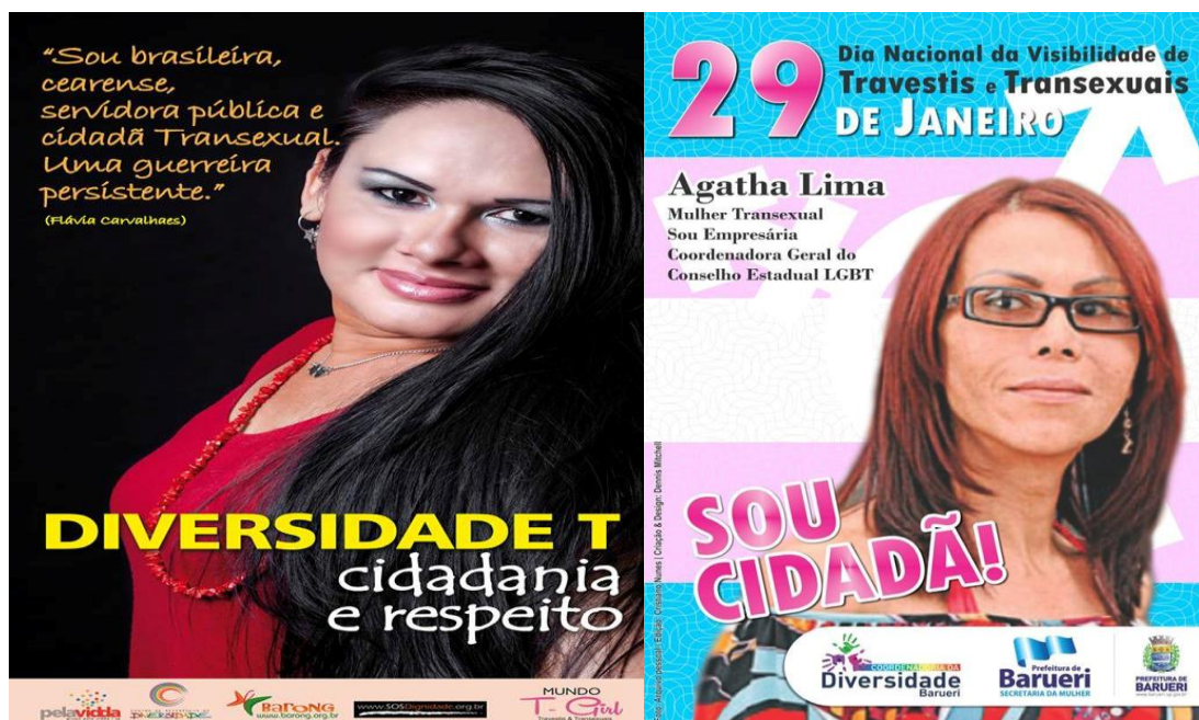
Figura 3: Cartazes de campanhas pela Visibilidade Trans

Porém, nem todas as mulheres travestis tem a disponibilidade emocional diária de luta e enfrentamento, algumas querem apenas realizar as suas atividades sem serem notadas: