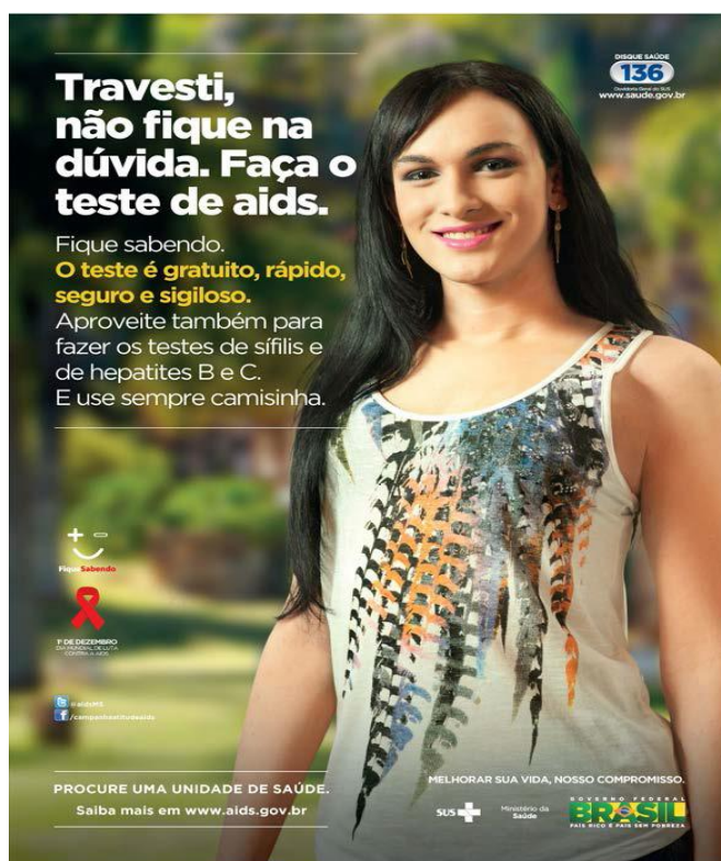
Figura 4: Cartaz do Ministério da Saúde no combate à AIDS

Vejamos abaixo um dos cartazes de campanhas do Ministério da Saúde no combate à AIDS: