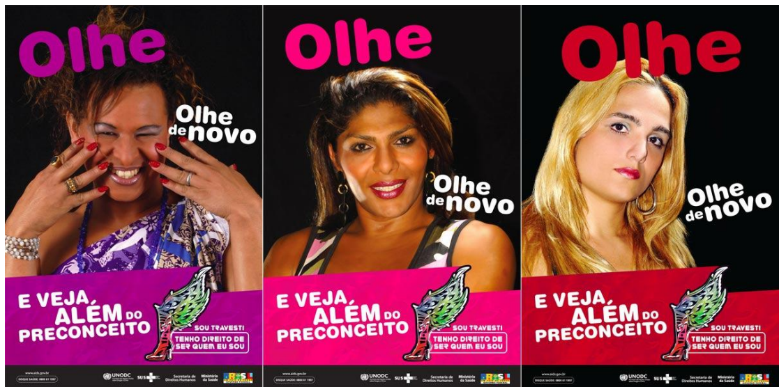
Figura 2: Cartazes de campanhas pela Visibilidade Trans

Essa busca pela visibilidade positiva se faz notar, segundo Carvalho (2013), na tentativa cada vez maior de retratar imagens de travestis e transexuais ligadas a aspectos de certa “cidadania burguesa” a fim de conferir respeitabilidade num processo de luta simbólica por estima social. Assim, o material produzido fala menos de prostituição e reproduz imagens de “pessoas trans” com empregos considerados respeitáveis dentro da moral burguesa. Um exemplo da “visibilidade burguesa” é apresentado a seguir, onde ressalta-se a profissão exercida pelas pessoas da foto: