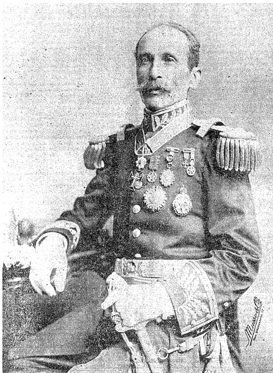
Figura 1 – Imagem do general Thaumaturgo de Azevedo.