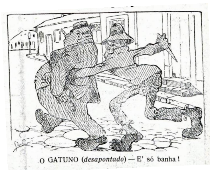
Figura 1: Ilustração “Desillusão”.

fevereiro de 1911 explora aquelas características, quando o seu ilustrador 306 apresenta a figura do gatuno segurando uma arma branca na mão, e abordando um outro personagem distraído na rua. A pretensa vítima, certamente, é um burocrata pois foi comum a identificação desse personagem pelos traços do pançudo, de alguém com feições esféricas e rosto arredondado, como se vê a seguir.