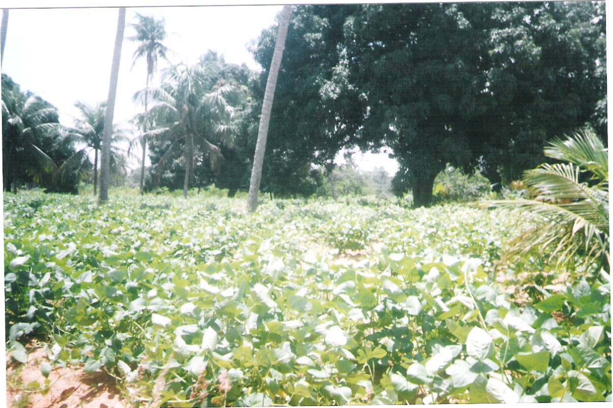
Figura 10 – Plantação de feijão na Fazenda Jacoca. Foto: Bruno Montenegro, março de 2004.