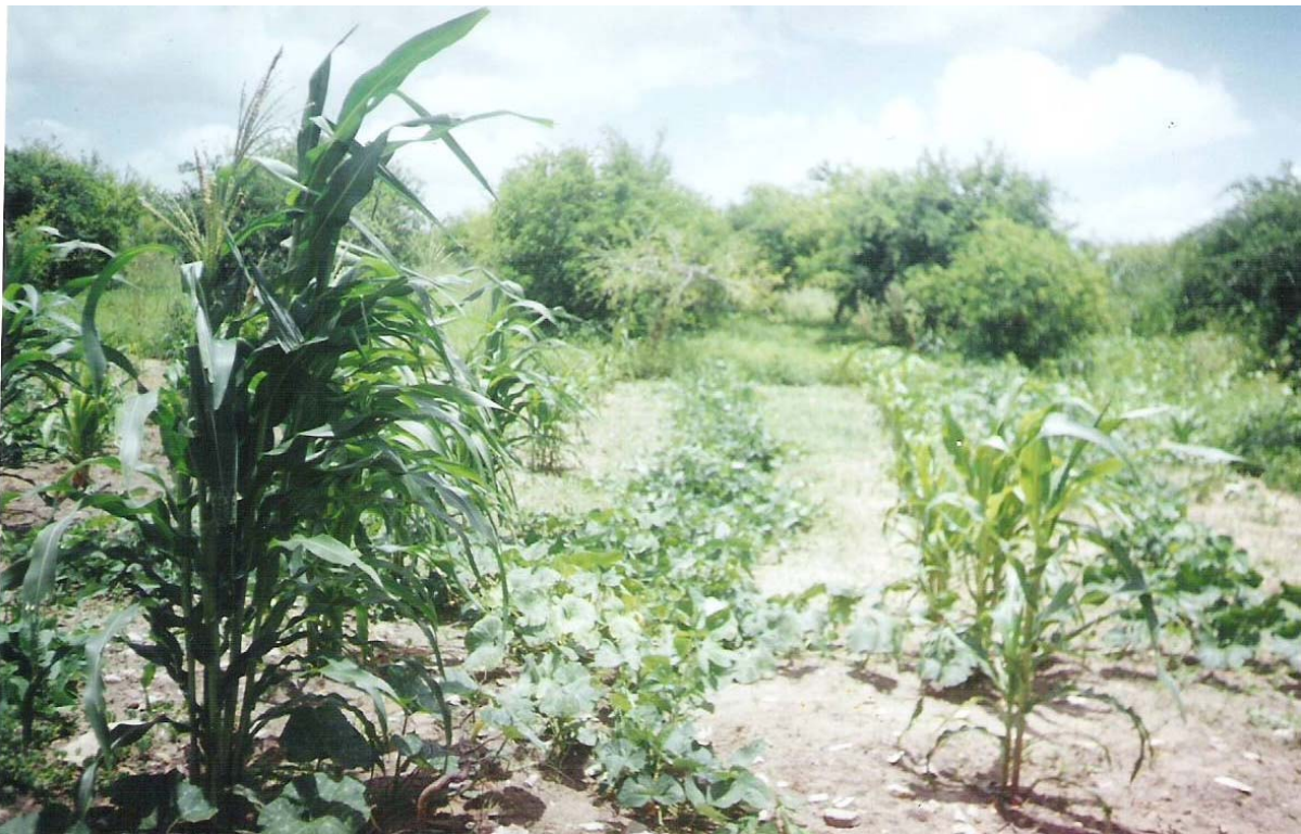
Figura 11 – Plantação de milho e feijão na Fazenda Jacoca.

As fazendas que desenvolvem apenas agricultura compreendem um quantitativo de 29 estabelecimentos. Deste total, 27 declararam área (entre 9,5 e 13.000 hectares) e duas não declararam.