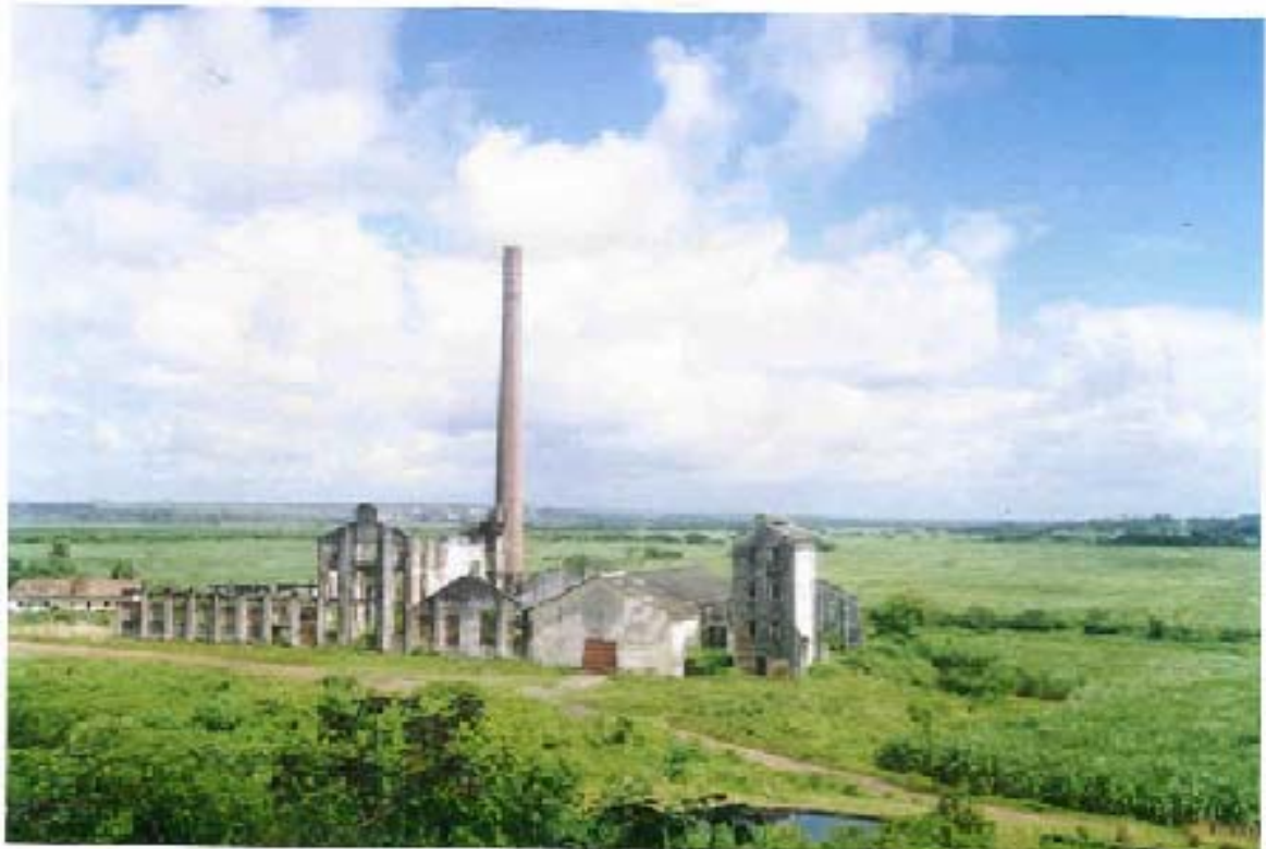
Figura 6 – Ruínas da Usina Ilha Bela março de 2002