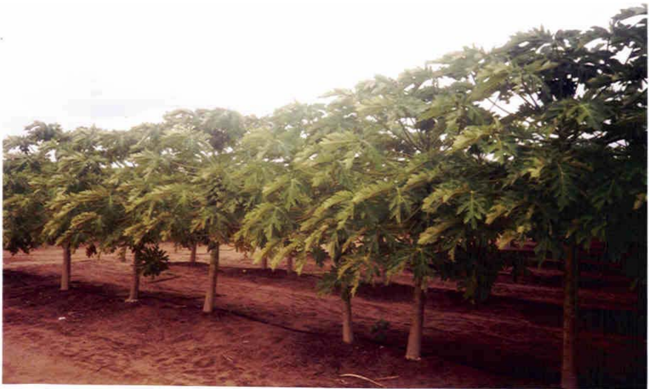
Figura 7 – Plantação de mamão na fazenda Diamante, Ceará-Mirim.

Apesar de demandar um alto grau de investimento, a cultura do mamão tem mostrado crescimento na região analisada, dado o seu aspecto lucrativo advindo da garantia de mercado. Dessa forma é que algumas fazendas, utilizando suas áreas de pastagens ou matas nativas, tornaram-se plantadoras e fornecedoras desse produto às empresas já mencionadas. Isto se dá mediante a celebração de um contrato no qual a empresa se compromete em fornecer as sementes, caixas plásticas para o armazenamento e assistência técnica com a finalidade de acompanhar a produção desde o plantio até a fase da colheita. As fazendas são responsáveis pela contratação de seu pessoal e pela entrega de um produto de boa qualidade, o que inclui ter sido colhido no prazo de maturação estabelecido para suportar o período de transporte e o peso na medida do exigido.