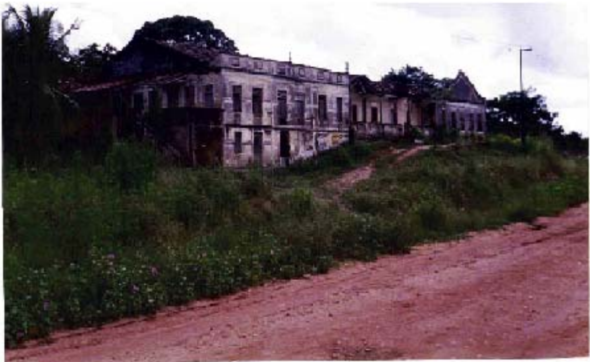
Figura 3 – Casa grande do antigo Engenho Cruzeiro (hoje totalmente destruído) Foto: Gerinaldo Moura, junho de 1992.