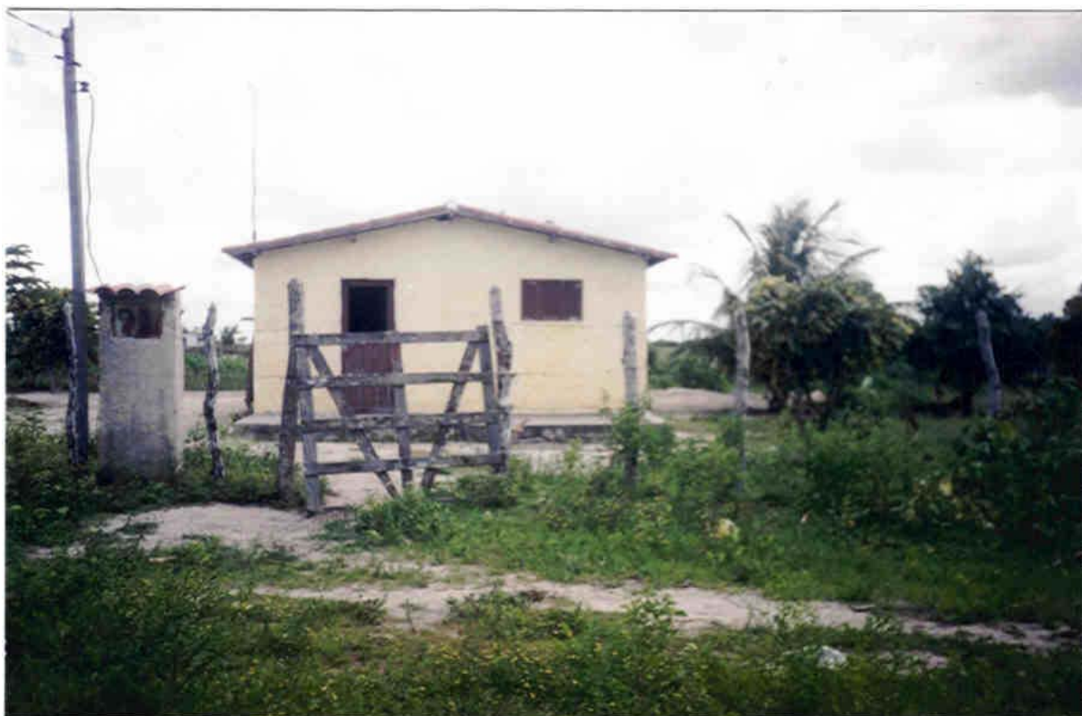
Figura 15 – Casa no Assentamento Espírito Santo em Ceará-Mirim.