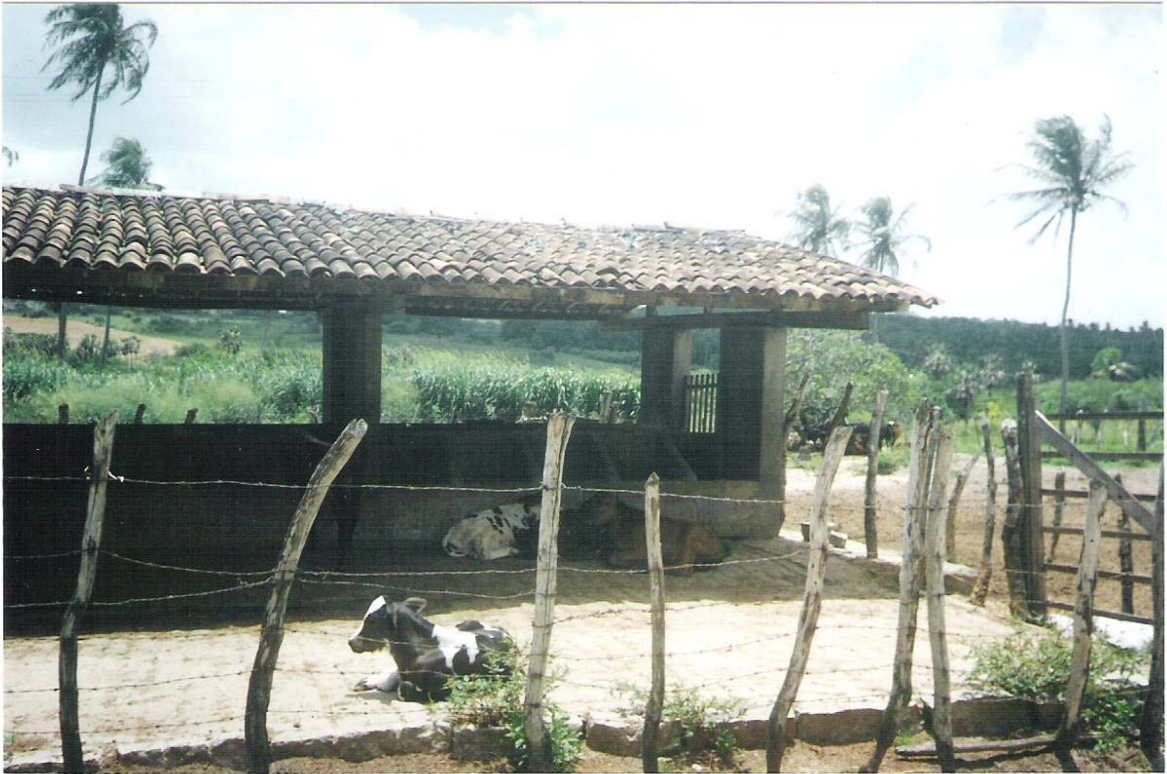
Figura 9 – Bovinos da Fazenda Jacoca. Foto: Bruno Montenegro, março de 2004.