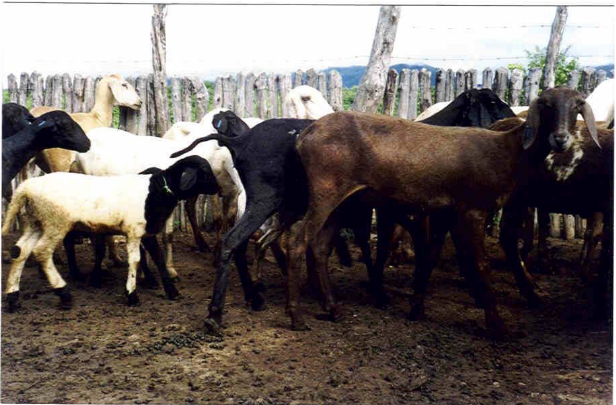
Figura 8 – Caprinos da Fazenda LANILA.