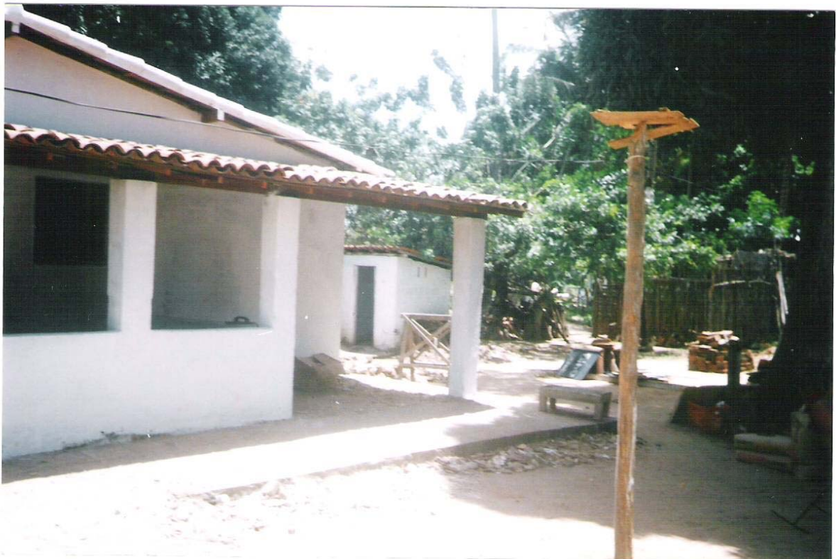
Figura 13 – Sítio Lagoa do Cosme, distrito de Ceará-Mirim.

Na área rural de Ceará-Mirim existem 27 sítios, os quais encontram-se assim divididos: cinco com criação de animais e atividades agrícolas, dois apenas com criação de animais e vinte somente com atividade agrícola. Outra divisão que pode ser feita no que diz respeito aos sítios é a seguinte: sítios de lazer (4) e sítio de morada (14).