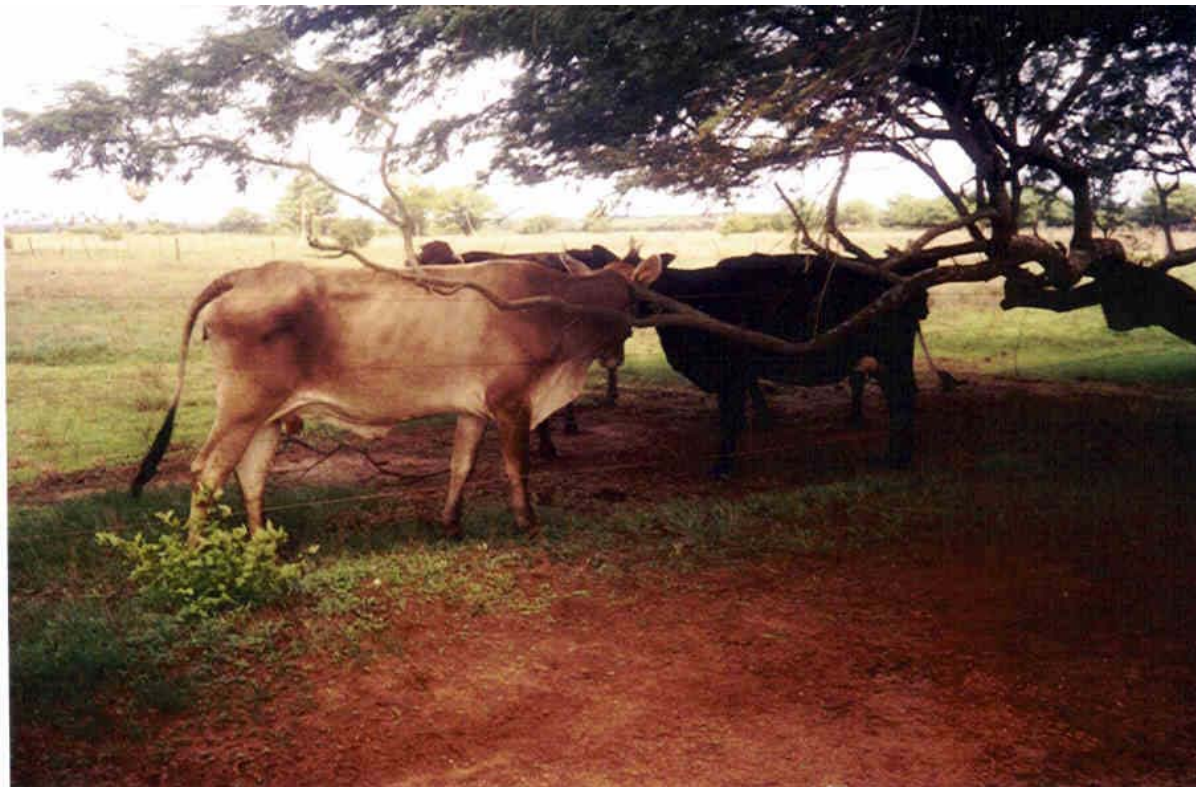
Figura 12 – Bovinos da Fazenda Igarapé Foto: Eliane Montenegro, outubro de 2003.

Encontram-se na área rural de Ceará-Mirim 38 fazendas de pecuária. Deste total 33 declararam a área, a maioria adquirida através de compra.