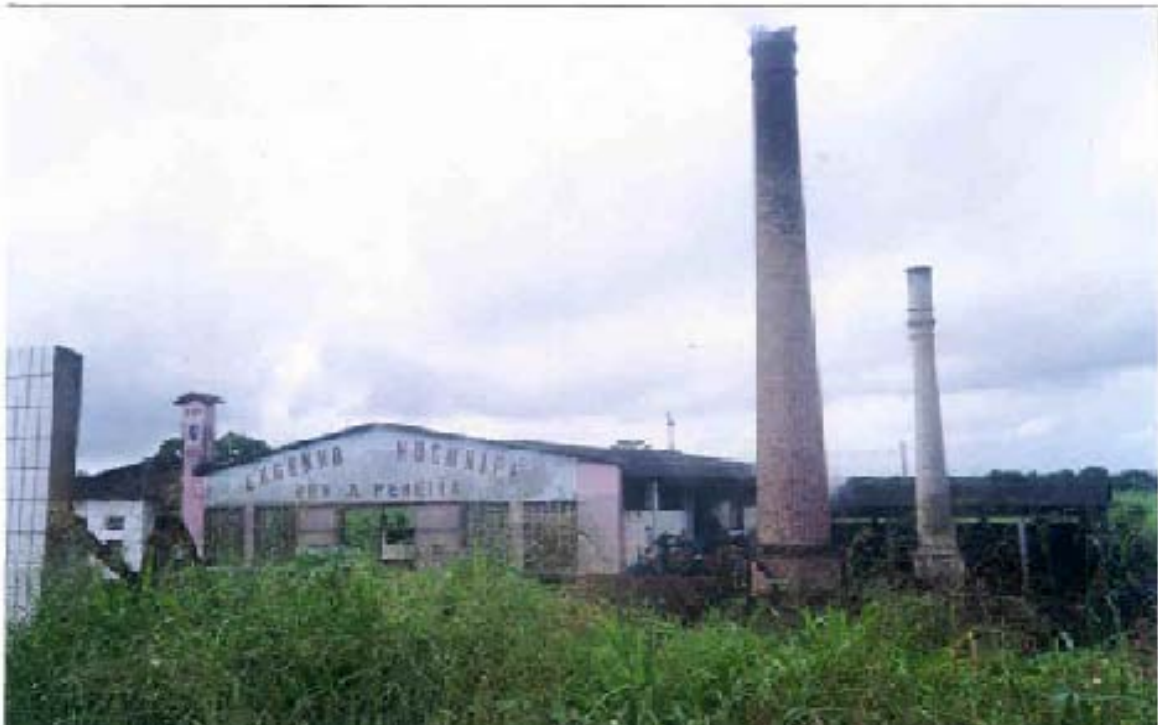
Figura 5 – Engenho Mucuripe Foto: acervo Gibson Machado Alves, maio de 1999.