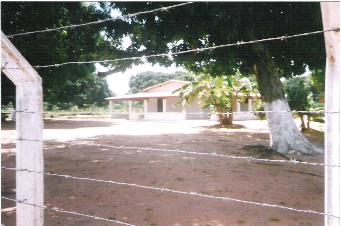
Figura 14 – Granja São José, distrito de Lagoa do Cosme – Ceará-Mirim.

O município de Ceará-Mirim conta em sua área rural com dezenove granjas, assim distribuídas: quatro com atividades mistas, cinco apenas com criação de animais e dez com plantio de culturas agrícolas (ver tabela 9). Outra classificação possível para as granjas cearamirinsenses, tal como ocorre com os sítios, é entre aquelas de lazer e aquelas de morada.