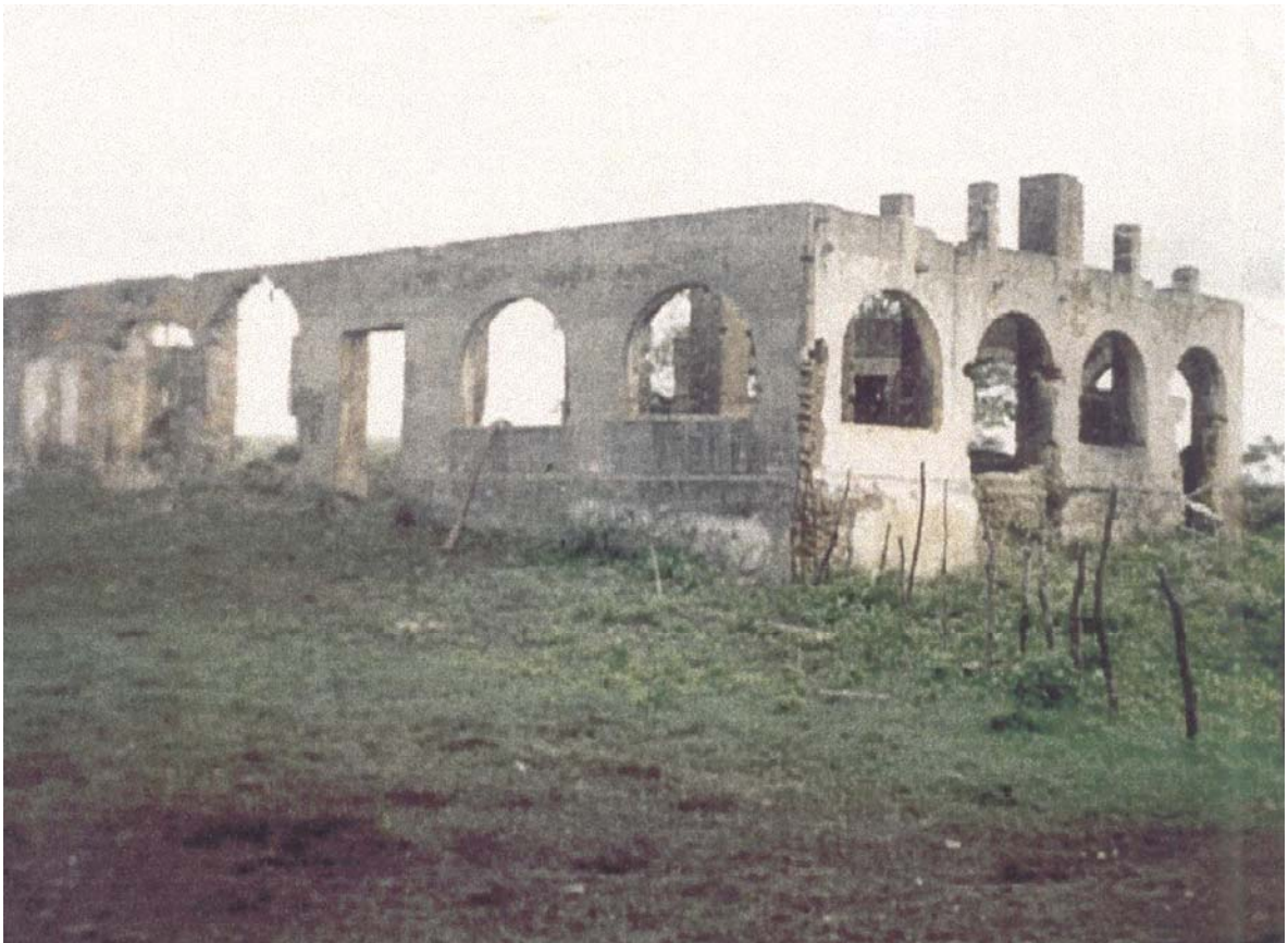
Figura 2 – Ruínas do Engenho Carnaubal Foto: Gerinaldo Moura, junho de 1991.