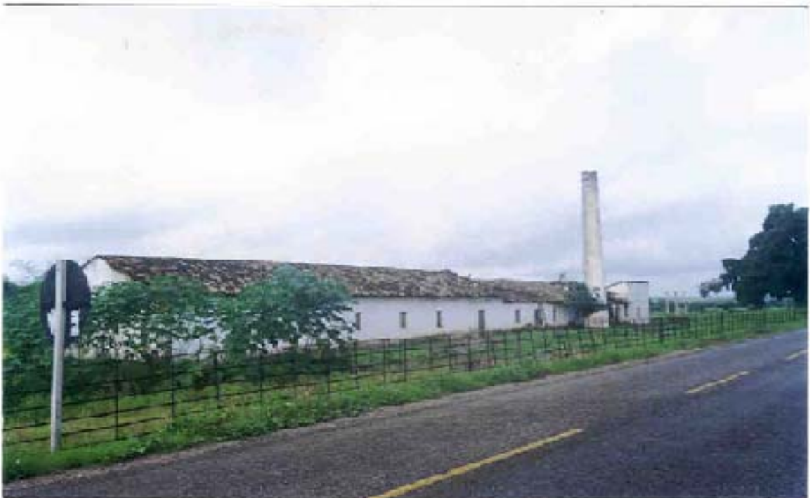
Figura 4 – Engenho Verde Nasce Foto: acervo Gibson Machado Alves, maio de 1999