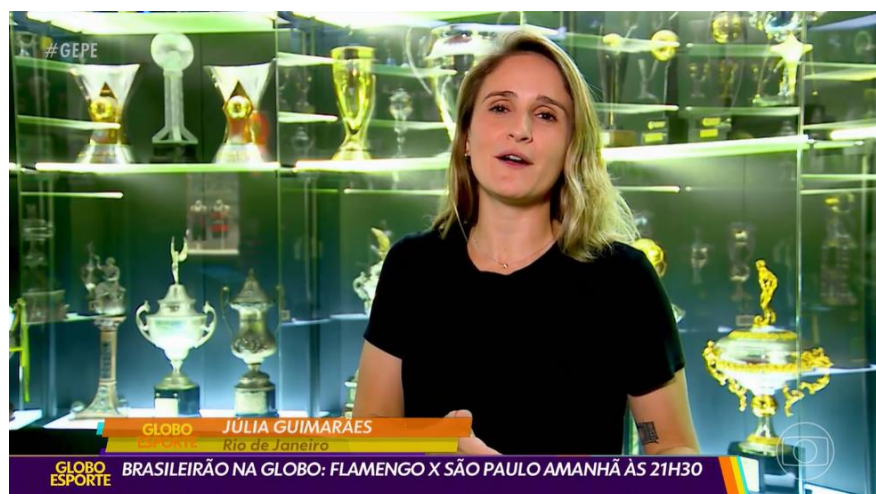
Imagem 7 - Reportagem de Júlia Guimarães produzida no Rio de Janeiro