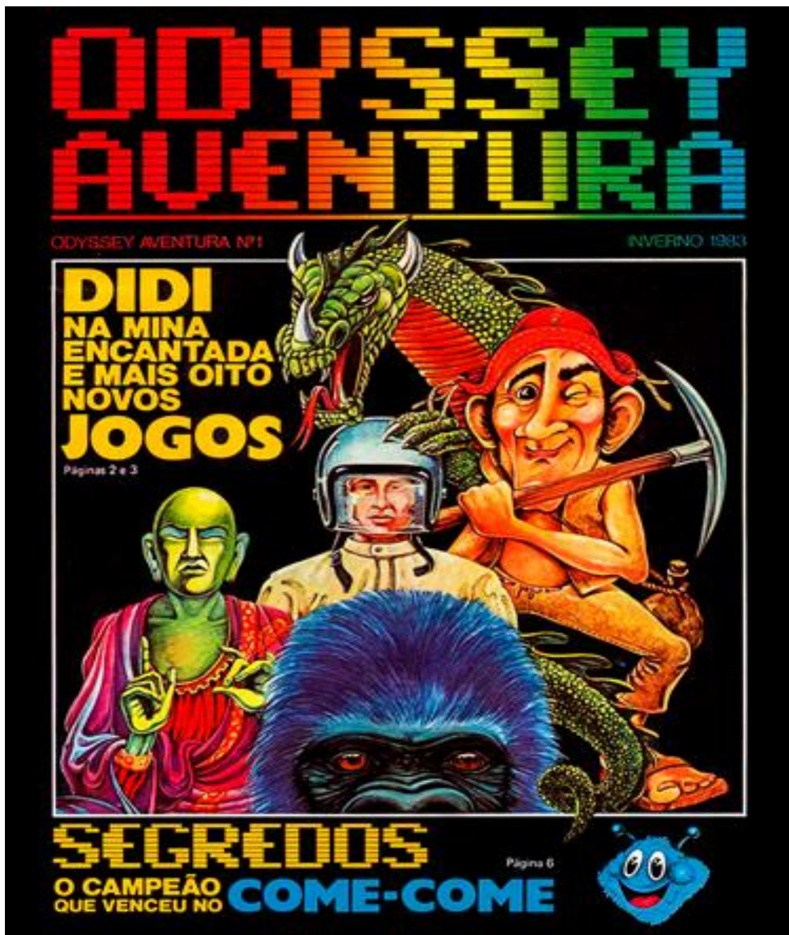
Figura 1- edição da revista “Odyssey Aventura” n°1