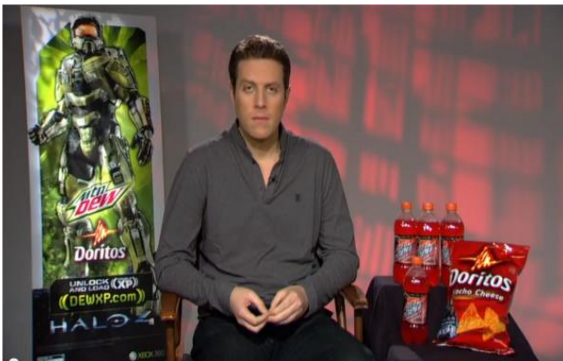
Figura 4 - A imagem que, para muitos, sintetiza o jornalismo de games atual.

proceda dessa forma. Boaventura (2016) ainda recupera o fato de o jornalista Geoff Keighley, organizador da premiação The Games Awards , dar uma despreziosa entrevista em um cenário em que havia um pôster do jogo Halo 4 , pacotes de Doritos e garrafas de Mountain Dew . A curiosa cena ocorreu em 2012 e o público entendeu as relações dos anunciantes com o jornalista como eticamente reprováveis. Keighley é um dos críticos de games mais proeminentes do mundo e não deveria se sentir confortável ao pousar ao lado da indústria. Sua imagem estava sendo usada nesse momento como elemento publicitário do lançamento de um jogo, no caso, o Halo 4 (BOAVENTURA, 2016)