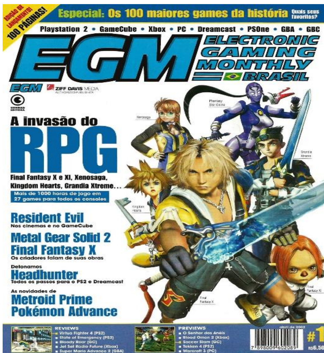
Figura 2- primeira edição da “EGM Brasil” e suas 100 páginas