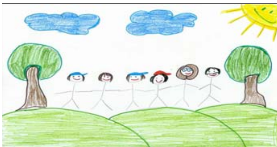
Figura 4: Álbum da história de vida de Beatriz – Família

Luíza: É... um coração com uma flecha. É porque num tenho minha mãe por perto. Queria que a gente se encontrasse de novo e ficasse junto pra sempre. Aí a gente podia ficá todo mundo junto e feliz.