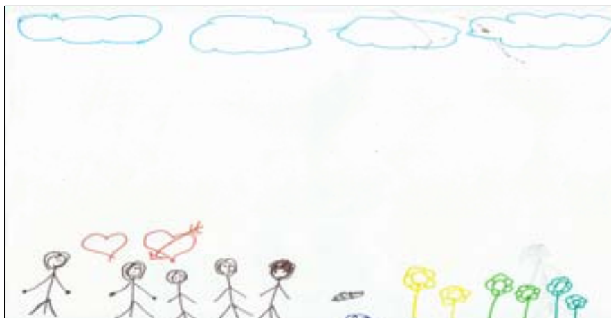
Figura 3: Álbum da história de vida de Luíza – Família