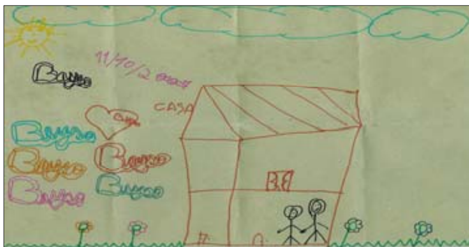
Figura 7 – Desejo de Luíza

Beatriz: Meu maior desejo é quando eu tiver maior ajudá minha mãe, meu pai. Dá do melhor e do bom... Se Deus quiser... ajudá meu pai e minha mãe. Eu sei que é difícil... mais Deus vai me ajudá .