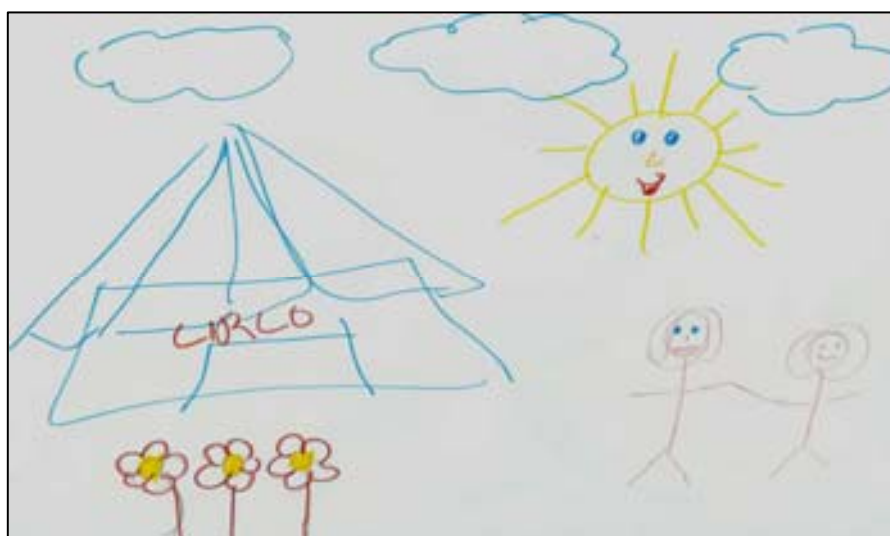
Figura 6 – Álbum da história de vida – Luíza

Ao observar a trajetória de vida das participantes, percebemos que o processo de inserção das adolescentes na ESCCA está atrelado, também, a institucionalização das mesmas. O que passamos a discutir na seqüência.