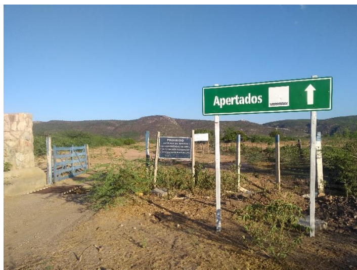
FIGURA 15 - PLACA INDICATIVA DE ACESSO AO CÂNION DOS APERTADOS

Apesar de não possuir uma placa informativa do percurso na sua entrada, as placas indicativas dentro da estrada encontram-se bem distribuídas e facilitam a localização do atrativo e esse aspecto influencia para que o visitante mesmo leigo consiga chegar ao local desejado.