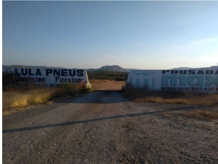
FIGURA 12 - ENTRADA DE ACESSO SENTIDO CÂNIÓN DOS APERTADOS

pode acarretar de um visitante passar despercebido pela estrada de acesso ou até mesmo dificultar para que o mesmo localize a rota sentido ao local desejado.