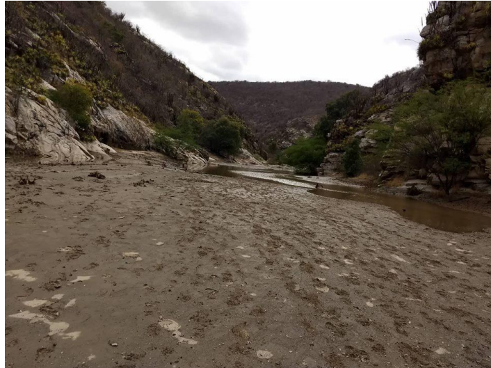
FIGURA 17 - ATRATIVO CÂNION DOS APERTADOS