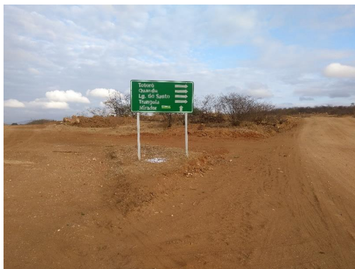
FIGURA 6 - PLACA INDICADORA DE ACESSO AOS ATRATIVOS DISTRIBUÍDA NO TRECHO

Percebe-se através da imagem a mudança no sentido da qualidade de acesso ao atrativo, pois a partir desse trecho até se chegar ao Pico do Totoró o acesso continua por meio de uma estrada de chão batido e alguns trechos de areia que podem que devem ser percorridos com atenção. Com relação a placas indicadoras de acesso o município distribuiu algumas espalhadas pelo trecho de acesso que permitem um fácil entendimento sobre o percurso (rota) e mesmo um visitante leigo é capaz de chegar ao destino que se pretende visitar (atrativo), conforme ilustrado na figura 6