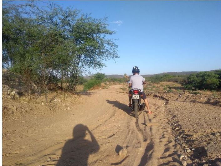
FIGURA 14 - ROTA SENTIDO CÂNION DOS APERTADOS

existem muitos trechos em que a areia fofa e buracos (alguns até com dimensões grandes) podem são os principais obstáculos, podendo causar acidentes, derrapagens e afins. Em períodos chuvosos além dos desafios citados anteriormente ainda existem a possibilidade de atolamento de veículos, causado pelo excesso de lama.