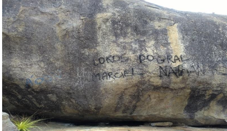
FIGURA 11 - PICHAÇÕES LOCALIZADAS NO ATRATIVO PICO DO TOTORÓ

formações rochosas durante a subida, portanto se faz necessário realizar ações de manutenções objetivando a conservação do espaço.