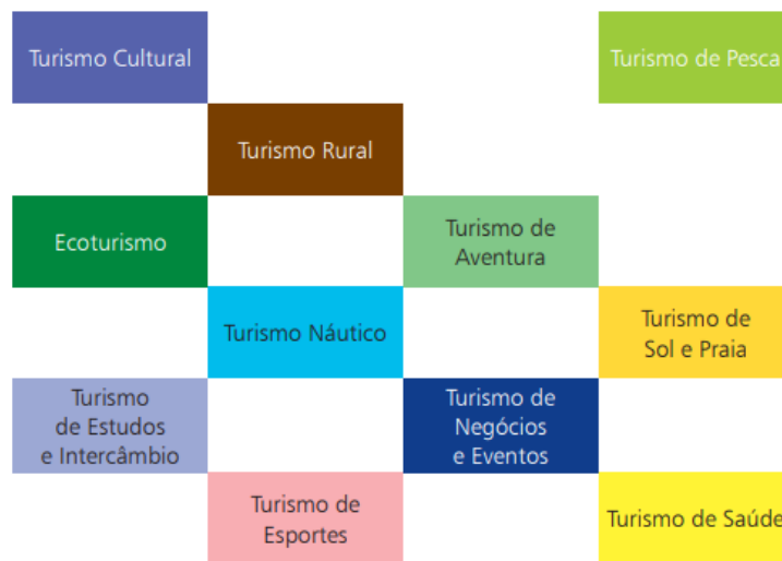
FIGURA 1 - SEGMENTOS PRIORITÁRIOS DO TURISMO NO BRASIL

Dessa forma, a segmentação do turismo tem como objetivo principal englobar diversos grupos com gostos exóticos e modos de agir distintos, além de poder aquisitivo diferente e fazer com que o mercado se expanda de forma a captar o máximo de pessoas e atingir um nível satisfatório de público alvo. Por esse motivo, em 2006 o Ministério do Turismo estabeleceu os segmentos prioritários para o desenvolvimento da atividade turística do Brasil. (Mtur,2010) (figura 1).