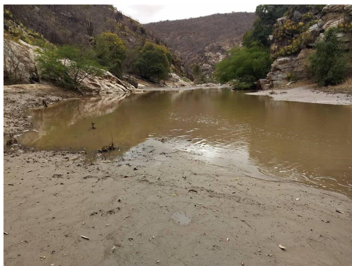
FIGURA 18 - LAGO FORMADO EM ALGUM PONTO DO LEITO DO RIO SECO

O trajeto pelo atrativo se dá por uma trilha pelo leito do rio seco onde é possível verificar a existência de formações geológicas típicas do lugar que contribuem para o embelezamento cênico do atrativo além de proporcionar certa adrenalina ao passar por alguns obstáculos que de certa forma dificultam e proporcionam emoção durante a sua travessia. Agregando valor ao local em períodos de chuva é possível banhar-se em pequenos lagos que se formam no lugar.