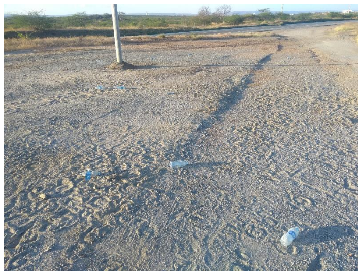
FIGURA 13 - DESCARTE INCONSCIENTE DE GARRAFAS PET E AFINS

Além dessa dificuldade de orientação com relação ao acesso do atrativo, outra questão é percebida é o descarte inconsciente de garrafas pet, latas de refrigerante dentre outros a partir da entrada de acesso e em outros pontos espalhados pelo trajeto, fator esse que contribui para a poluição o meio ambiente ainda contribui para a poluição visual do lugar.