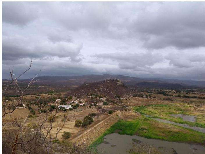
FIGURA 10 - VISTA DO ALTO DO PICO DO TOTORÓ

Ao atravessar boa parte dos obstáculos é possível enxergar uma bela paisagem do lugar, mas para que isso ocorra é necessário bastante atenção para não acontecer nenhum acidente, pois o local como já mencionado é de difícil acesso e não existe equipes de primeiros socorros no lugar. É impossível que uma pessoa com modalidade reduzida, por exemplo, realize essa subida a não ser que se planeje um sistema que facilite essa escalada/trilha no atrativo.