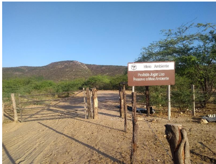
FIGURA 16 - PLACA DE CUNHO PRESERVACIONISTA

Ao todo foram contabilizadas de 5 a 6 placas indicativas, distribuídas até o acesso ao atrativo e uma delas chama atenção justamente ao ponto observado acima que é em relação ao descarte de lixo, essa placa foi instalada justamente com o intuito de conscientizar o visitante em relação a conservação do ambiente, e de certa forma observa-se que a comunidade em si se preocupa com questões ambientais que envolvem a conservação do atrativo.