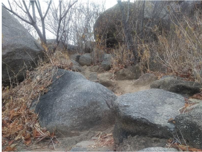
FIGURA 9 - OBSTÁCULOS NA SUBIDA AO PICO DO TOTORÓ