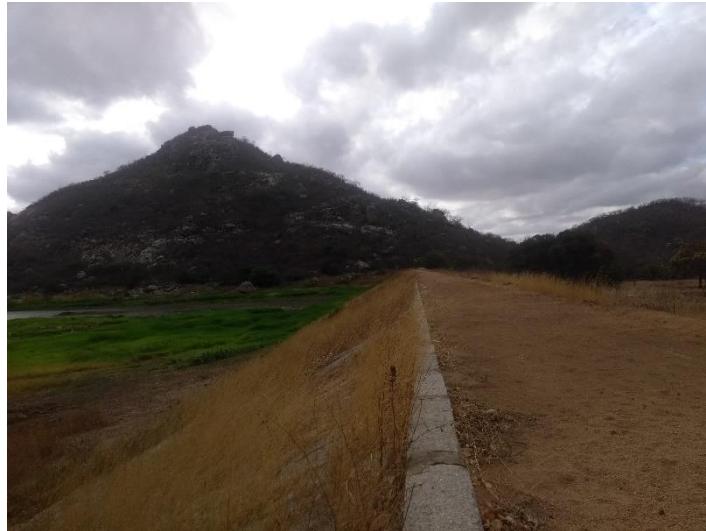
FIGURA 7 - PICO DO TOTORÓ E AÇUDE DO TOTORÓ

O atrativo Pico do Totoró está localizado dentro da comunidade do Totoró e seu acesso se dá pela parede do açude do Totoró que é um dos atrativos visitados no local, mostrado a seguir na figura 7.