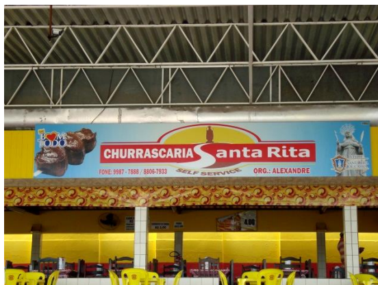
Figura 5 – Churrascaria Santa Rita