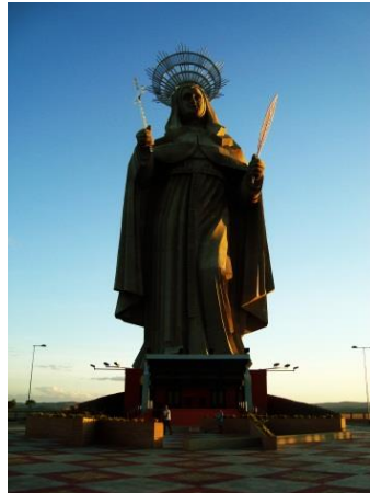
Figura 15 – Estátua colossal de Santa Rita