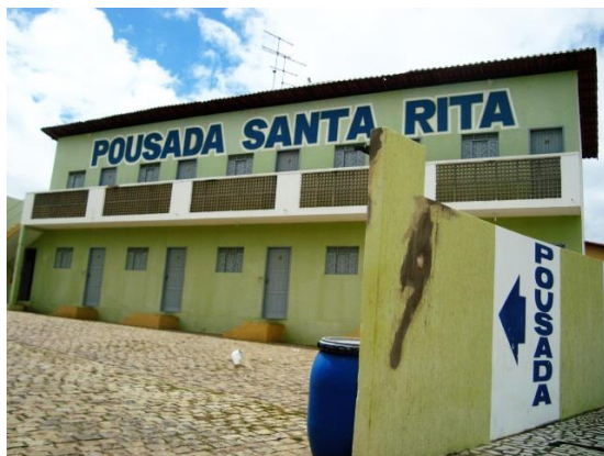
Figura 4 – Pousada Santa Rita I

A fotografia da Pousada Santa Rita I (Figura 4) e a da Churrascaria Santa Rita (Figura 5) carregam tal nomeação devido ao fato de os estabelecimentos terem sido comprados já com esse nome. Quando os proprietários foram indagados por que permaneceram, a justificativa recebida foi de que consideram o nome Santa Rita como uma tradição e um nome importante para os estabelecimentos comerciais e para a cidade de Santa Cruz. Assim, não teriam motivos para mudar os nomes desses comércios.