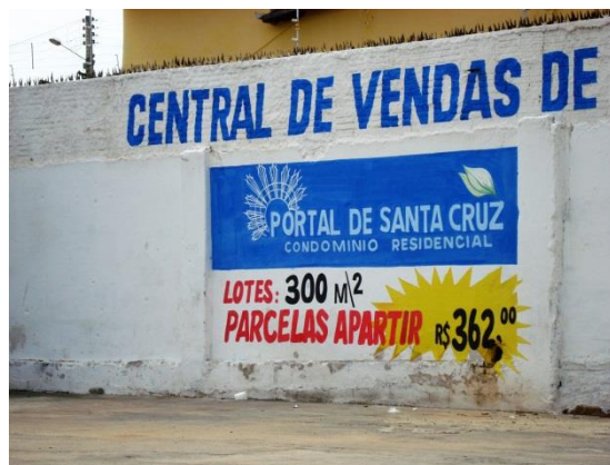
Figura 12 – Venda de terrenos