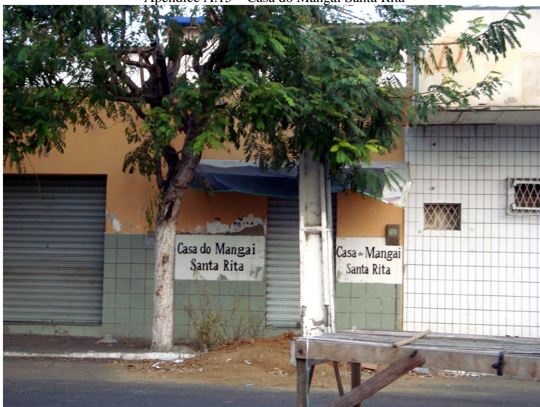
Apêndice A.15 – Casa do Mangai Santa Rita