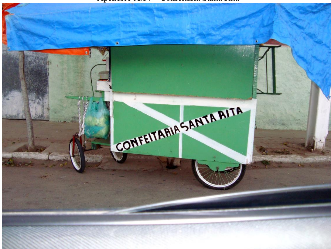
Apêndice A.14 – Confeitaria Santa Rita