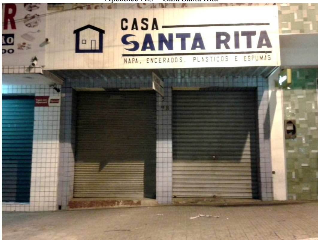
Apêndice A.5 – Casa Santa Rita