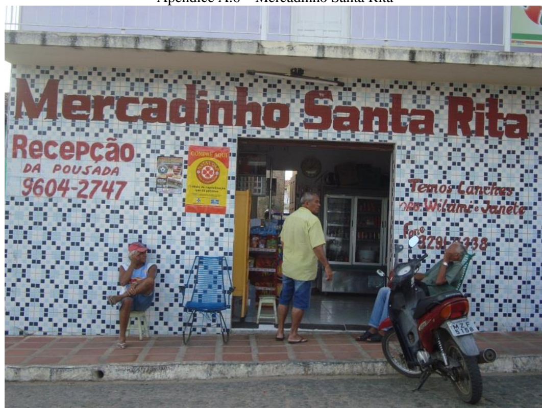
Apêndice A.6 – Mercadinho Santa Rita