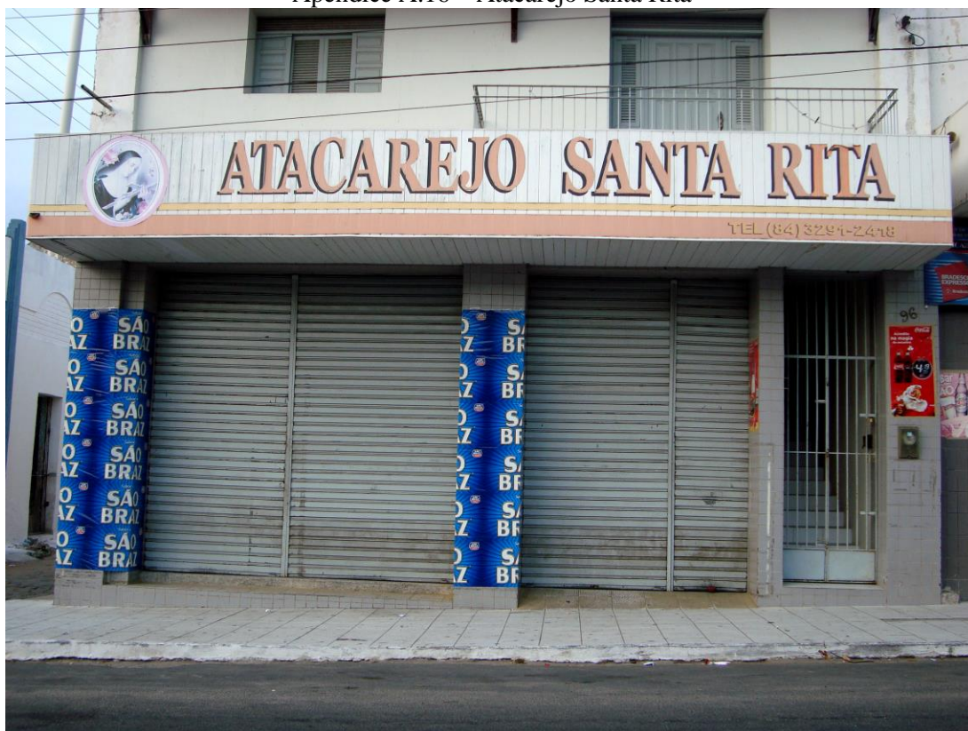
Apêndice A.16 – Atacarejo Santa Rita