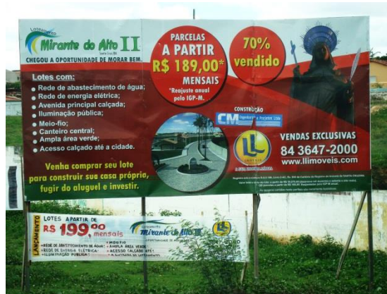
Figura 11 – Central de vendas de lotes

conhecimento prévio sobre estes dois símbolos ritianos: um, à esquerda, é o resplendor (uma coroa); outro, à direita, é uma palma (uma planta).