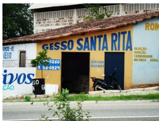
Figura 7 – Gesso Santa Rita

A loja Gesso Santa Rita (Figura 7) recebe esse nome porque o casal dono do estabelecimento tem devoção por Santa Rita. Em entrevista, a proprietária falou que quando conseguisse colocar um negócio para o casal, colocaria o nome de Santa Rita no estabelecimento, independente do tipo de serviço ou de loja.