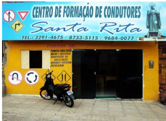
Figura 6 – Centro de Formação de Condutores Santa Rita

Já a nomeação do Centro de Formação de Condutores Santa Rita (Figura 6) dá-se porque os três donos e irmãos quiseram homenagear a Padroeira da cidade como também a mãe deles, que é devota de Santa Rita. “Ela não perde uma Missa da Coroa 49 . Nossa mãe sempre se esforçou para que os filhos dessem certo no trabalho, e com esse nome nosso comércio vem melhorando cada vez mais”, disse um dos proprietários quando entrevistado.