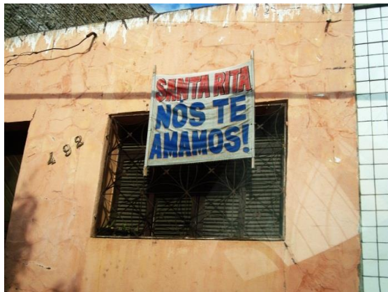
Figura 14 – Enunciado em casa de morador (faixa)