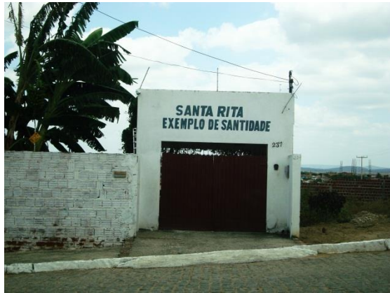
Figura 13 – Enunciado em casa de morador

O enunciado “Santa Rita, exemplo de santidade” (Figura 13), por exemplo, tem como suporte a própria parede externa da casa do morador santa-cruzense, o que faz com que a durabilidade do registro ocorra por mais tempo do que o do enunciado “Santa Rita, nós te amamos!” (Figura 14), fixado por meio de faixa.