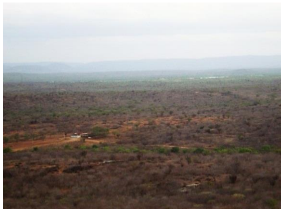
Figura 2 – Caatinga santa-cruzens (visão panorâmica)

As fotografias seguintes (Figura 2 e Figura 3) foram registradas a fim de demonstrarmos o clima semiárido da região bem como a paisagem da caatinga em dois pontos distintos da cidade. De acordo com telejornais nacionais, a seca de 2013 tem sido bastante intensa, classificando-se como a maior dos últimos quarenta anos.