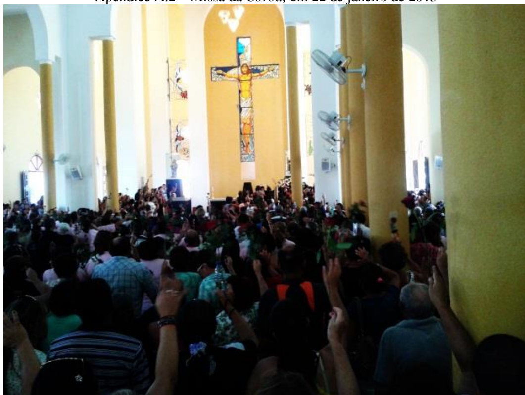
Apêndice A.2 – Missa da Coroa , em 22 de janeiro de 2013