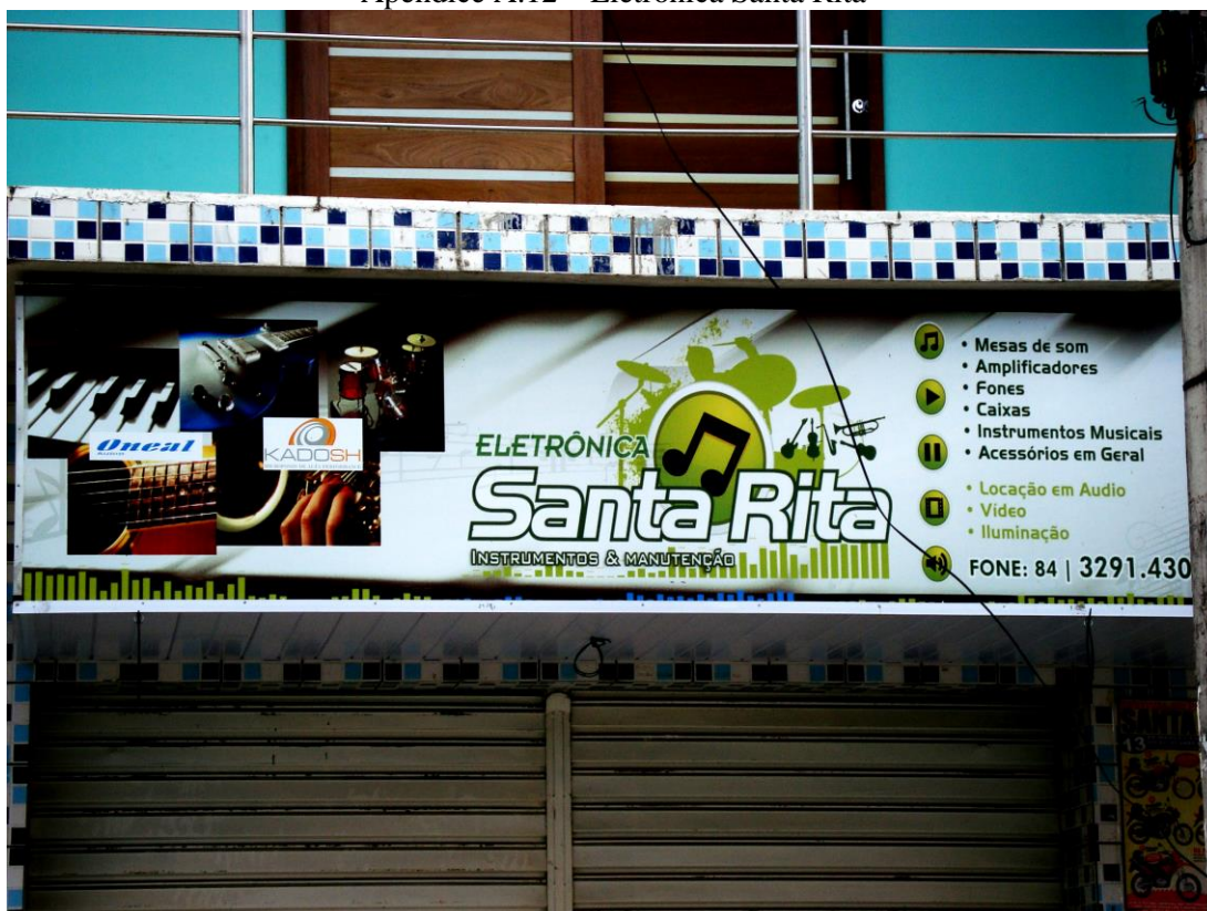
Apêndice A.12 – Eletrônica Santa Rita