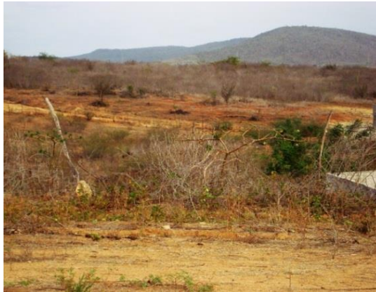
Figura 3 – Caatinga santa-cruzense

meses. Na Figura 3, à margem direita da BR 206, sentido oposto à capital, repete-se a paisagem da seca: sem água para dessedentação, sem animais e sem solo propício para plantação.