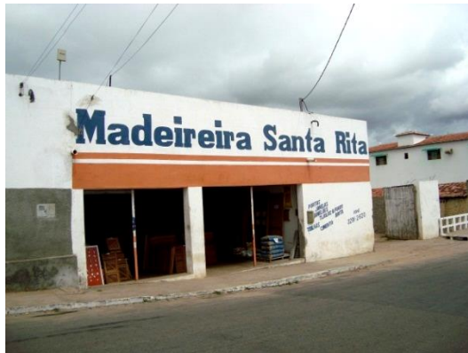
Figura 8 – Madeireira Santa Rita

A proprietária explicitou ainda que tanto ela quanto seu esposo são nascidos e criados em Santa Cruz, e esse nome é tradicional e muito forte na cidade. Corrobora com essa opinião o proprietário da Madeireira Santa Rita (Figura 8), que nomeou seu comércio desde 1998, ano de fundação da loja, por também ser devoto da Santa.