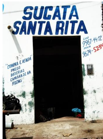
Figura 9 – Sucata Santa Rita

A Sucata Santa Rita (Figura 9) fica localizada em um ponto estratégico à visualização da estátua, no Alto de Santa Rita . Em entrevista, o dono disse que vê a estátua no momento que desejar, e Santa Rita, além de vê-lo, fica ajudando-o nas dificuldades diárias. Nas palavras do entrevistado: “Essa sucata é de Santa Rita. Eu estou o tempo todo vendo, e ela me vendo e me ajudando”. Disse ainda que o nome do estabelecimento foi atribuído bem antes da construção da estátua.