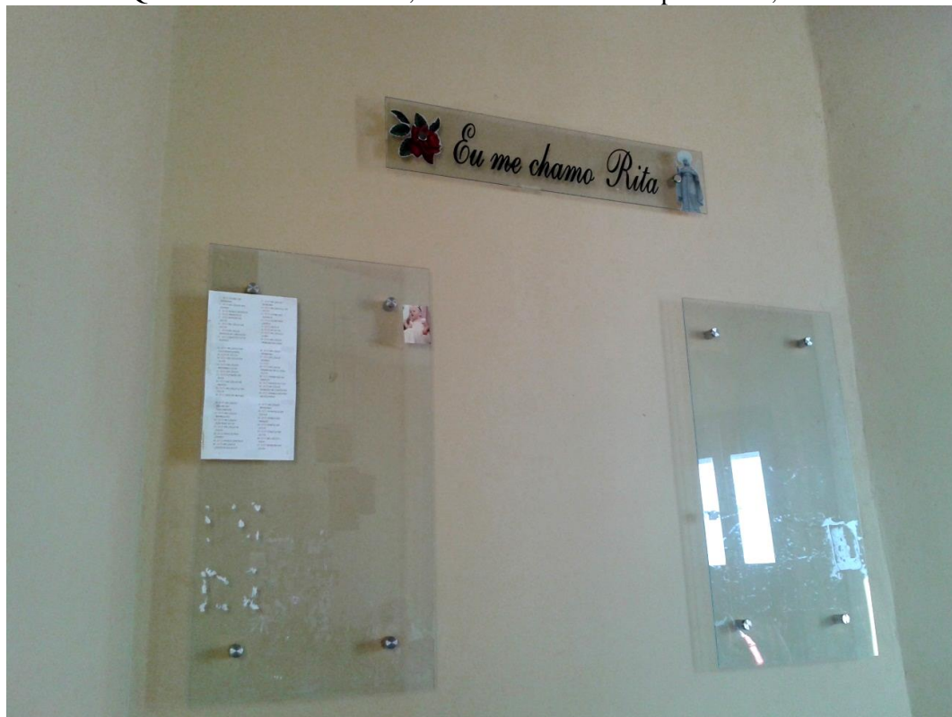
Apêndice A.1 – Quadro Eu me chamo Rita , localizado na Sala das promessas, no Alto de Santa Rita