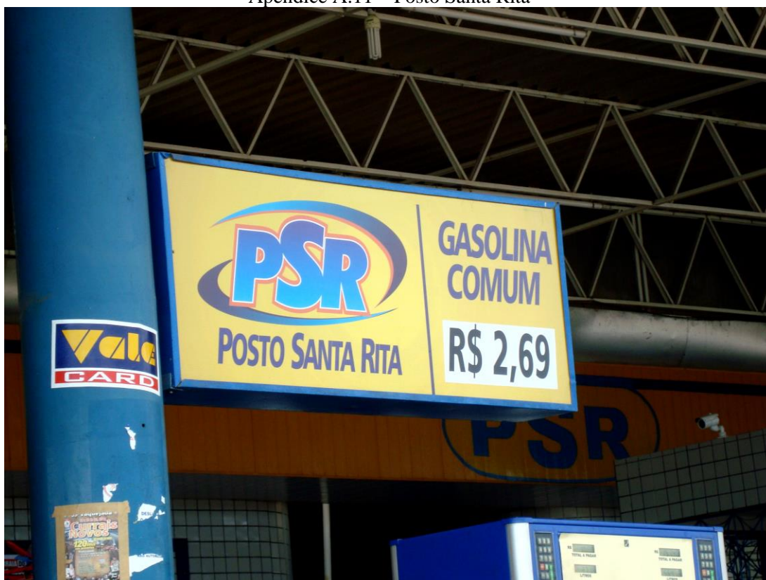
Apêndice A.11 – Posto Santa Rita