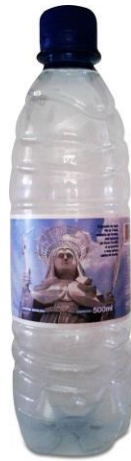
Figura 10 – Rótulo de garrafa de água mineral

Em termos de produtos comercializados na cidade, notadamente, tem-se a ilustração de garrafa de água mineral (Figura 10) de uma empresa potiguar, com o rótulo em homenagem a Santa Rita de Cássia. Nesse caso, representada por uma fotografia da estátua, localizada no Complexo Turístico e Religioso da cidade. Dentre as informações contidas no produto, destaca-se a de que o “Santuário de Santa Rita de Cássia, Madrinha dos Sertões, está localizado em Santa Cruz/RN. Lá se encontra a maior estátua católica do mundo”.