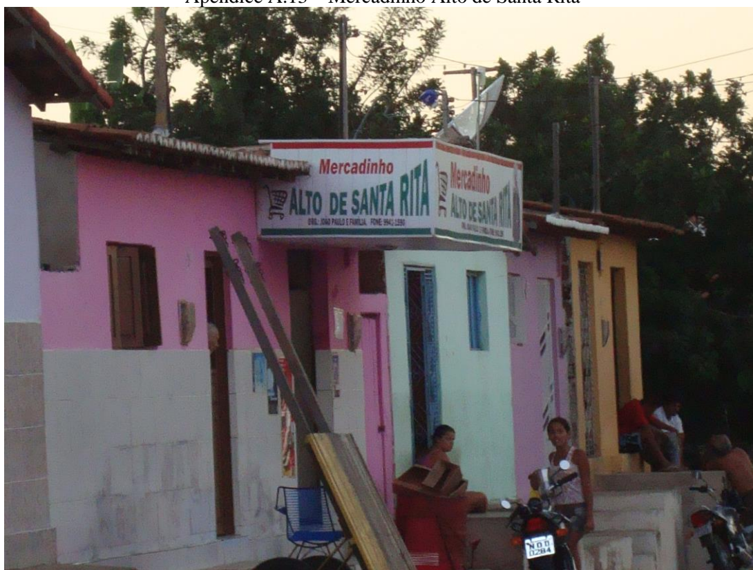
Apêndice A.13 – Mercadinho Alto de Santa Rita