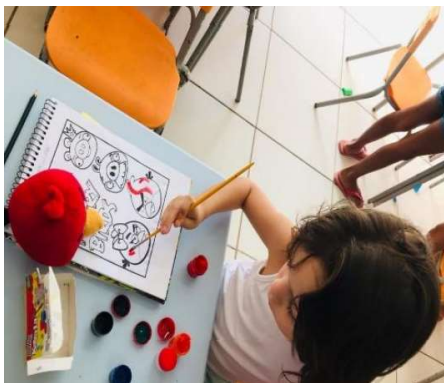
Figura 2 - ATIVIDADE DE PINTURA

Apesar de seu interesse nessa atividade, pude perceber que J também não segurava o pincel da forma convencional. Sua coordenação motora fina, como já relatado anteriormente, apresentava-se com um déficit. Apesar disso, isso não foi motivo de incômodo para o menino, como foi a atividade com lápis grafite. Portanto, investimos mais nestes tipos de atividades que proporcionavam prazer ao garoto e conseqüentemente poderia fortalecer sua mão, podendo trazer avanços motores. A figura 2 ilustra J no momento da atividade de pintura.