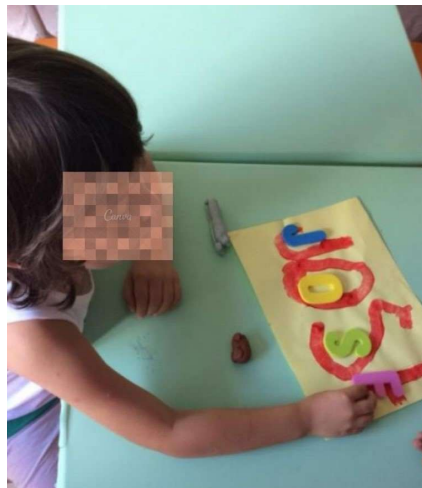
Figura 5 - ATIVIDADE PARA ENCONTRAR AS LETRAS DO PRIMEIRO NOME

Todas as vezes que eu escrevia o nome, as letras eram ensinadas individualmente. A partir disso, comecei a utilizar o alfabeto móvel para construção do nome dele. Eu distribuía algumas letras de forma aleatória na mesa e solicitava que ele encontrasse aquelas que correspondiam ao seu nome. A figura 5 ilustra esta atividade