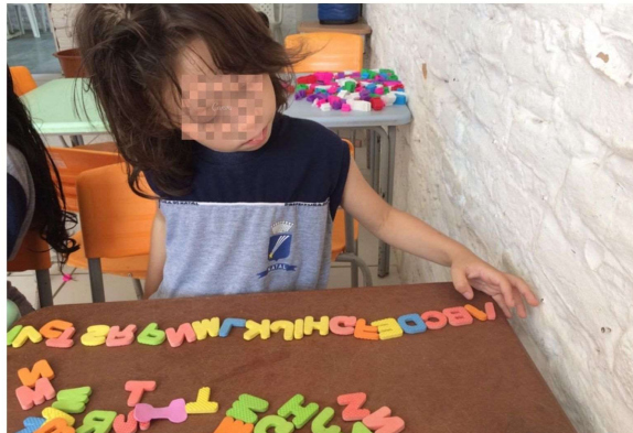
Figura 6 - ORGANIZAÇÃO DAS LETRAS EM ORDEM ALFABÉTICA

alcance e, pouco a pouco, ele foi utilizando esse recurso nos momentos em que a professora deixava as crianças livres para brincadeira, sem atividade direcionada. Essa prática mostrou-se efetiva pois observamos que J passou a colocar as letras em ordem alfabética sem a ajuda das docentes. Isso é observado na figura 6, onde J coloca as letras do alfabeto em ordem durante uma atividade livre de sala.