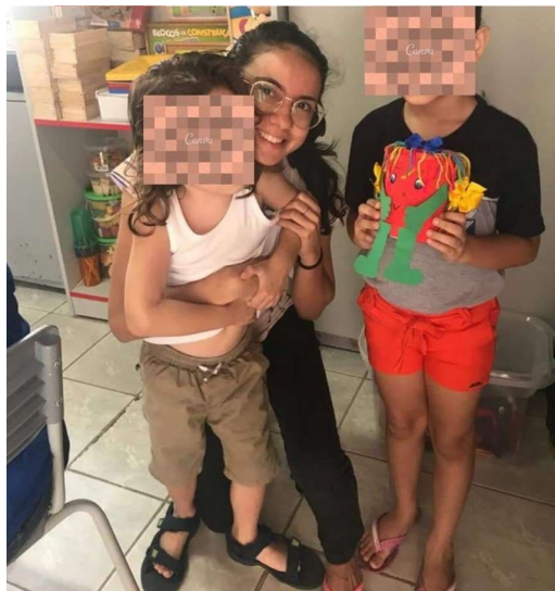
Figura 12 - CONFECÇÃO EM DUPLA DA “BONECA DE LATA”