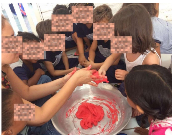
Figura 11 – CONFEÇÃO DE MASSINHA DE MODELAR