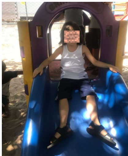
FIGURA 1 - J NO PARQUE

Sabendo disso, um dos auxiliares de serviço geral (ASG) da escola se disponibilizou a fazer com que J tentasse brincar nos outros espaços do parque, o que as professoras já haviam tentado, mas não tiveram sucesso. Dia após dia o ASG vinha quando a turma de J estava lá e gradualmente conseguiu mudar o interesse dele pelo brinquedo. Ele pegava na mão de J e descia pelo escorregador junto com o menino, e, quando conseguiu deixar o garoto confiante de que poderia fazer aquilo sozinho, começou a se ausentar desse momento, fazendo com que o menino tivesse a iniciativa de ir independente em busca do outro brinquedo no parque. A figura 1 ilustra J no parque, no escorrega: