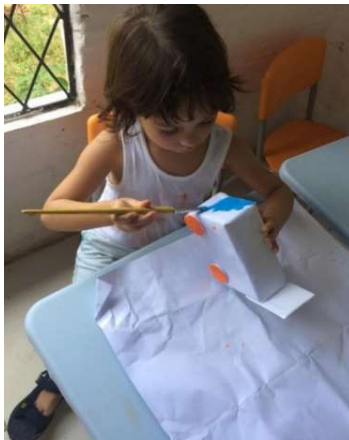
Figura 10 - CONFEÇÃO DE CARRO

interessado pela confecção do carro. A figura 10 mostra o carro reciclável que J confeccionou com a ajuda das professoras.