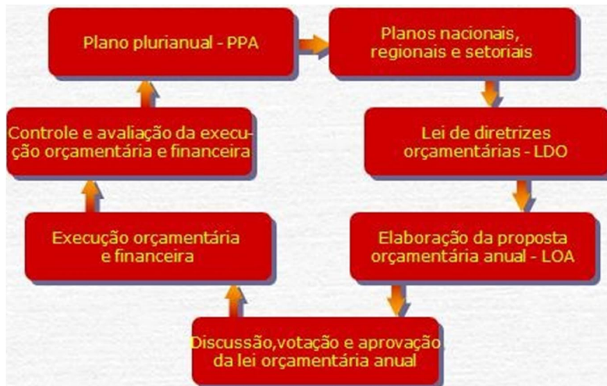
Figura 1 – Ciclo Integrado de planejamento e orçamento público

LOA, como uma forma de planejar, executar e avaliar a gestão do orçamento na administração pública.