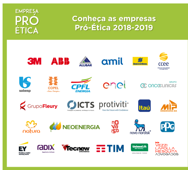
Imagem 5: Empresas que receberam a certificação “Pró-Ética” pela Controladoria-Geral da União na edição 2018-2019 (CGU, 2019).

No biênio avaliativo correspondente aos anos de 2018 e 2019, das 26 empresas contempladas com tal certificação, 4 correspondem ao setor de “Eletricidade e gás”, com destaque para duas grandes empresas do setor de distribuição, que figuram com grande notoriedade: a Enel e a Neoenergia: