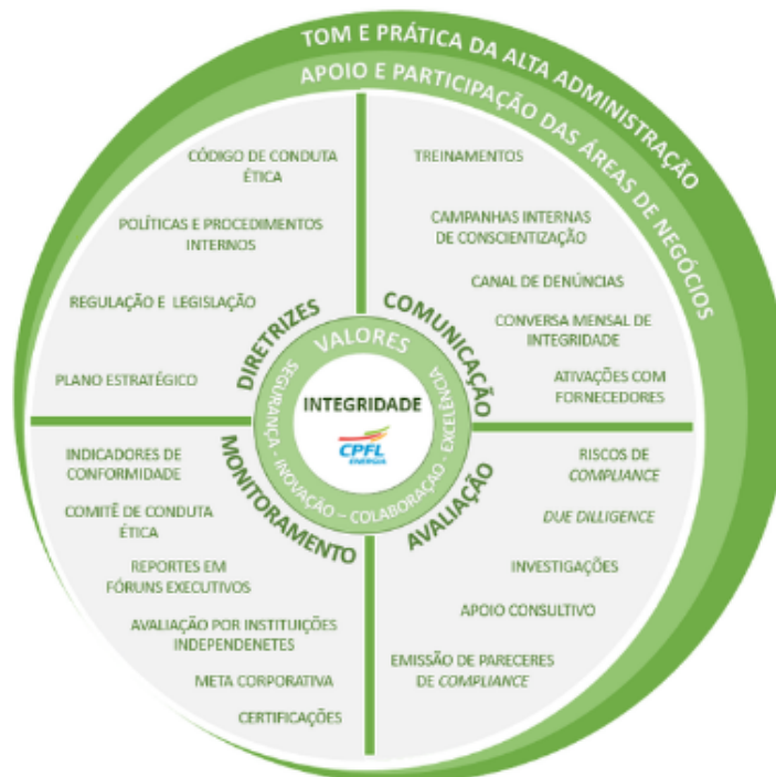
Imagem 6: Estrutura do Programa de Integridade da CPFL Energia (CPFL, 2024).

Quanto ao Programa de Integridade do Grupo CPFL, este foi instituído com o propósito de prevenir danos de natureza financeira, jurídica e reputacional, por meio de quatro principais dimensões: diretrizes, comunicação, avaliação e monitoramento. A abrangência envolve desde colaboradores, fornecedores que representam as empresas do grupo nas relações com agentes públicos, parceiros comerciais, bem como membros da alta administração. O modus operandi pode ser demonstrado esquematicamente mediante a imagem a seguir: