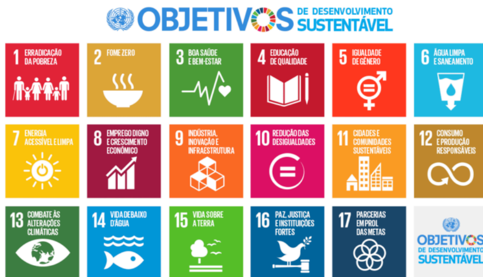
Imagem 8: Objetivos de Desenvolvimento Sustentável (ONU, 2024).

À luz de tais metas, a LAC conversa diretamente com o Objetivo 16, o qual busca “promover sociedades pacíficas e inclusivas para o desenvolvimento sustentável, proporcionar acesso à justiça para todos e construir instituições eficazes, responsáveis e inclusivas em todos os níveis”. Ou seja, o impacto de uma Lei Federal sobre a Administração Pública e o setor privado acaba influenciando tais agentes na busca pela transparência e integridade (Cardoso; Rodrigues, 2024).