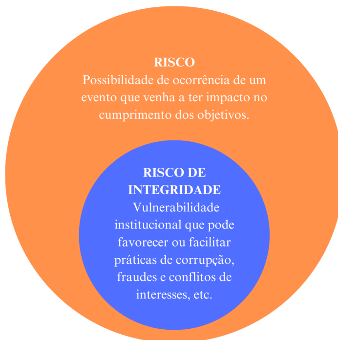
Imagem 1 (adaptada): Diferenciação entre os riscos “gerais” e os riscos de integridade (ITI, 2018, p. 11).

Para classificar e diferenciar os demais riscos com o foco desse trabalho (que levará em conta sobretudo os riscos de integridade), a imagem abaixo descreve tal diferenciação de forma mais didática: