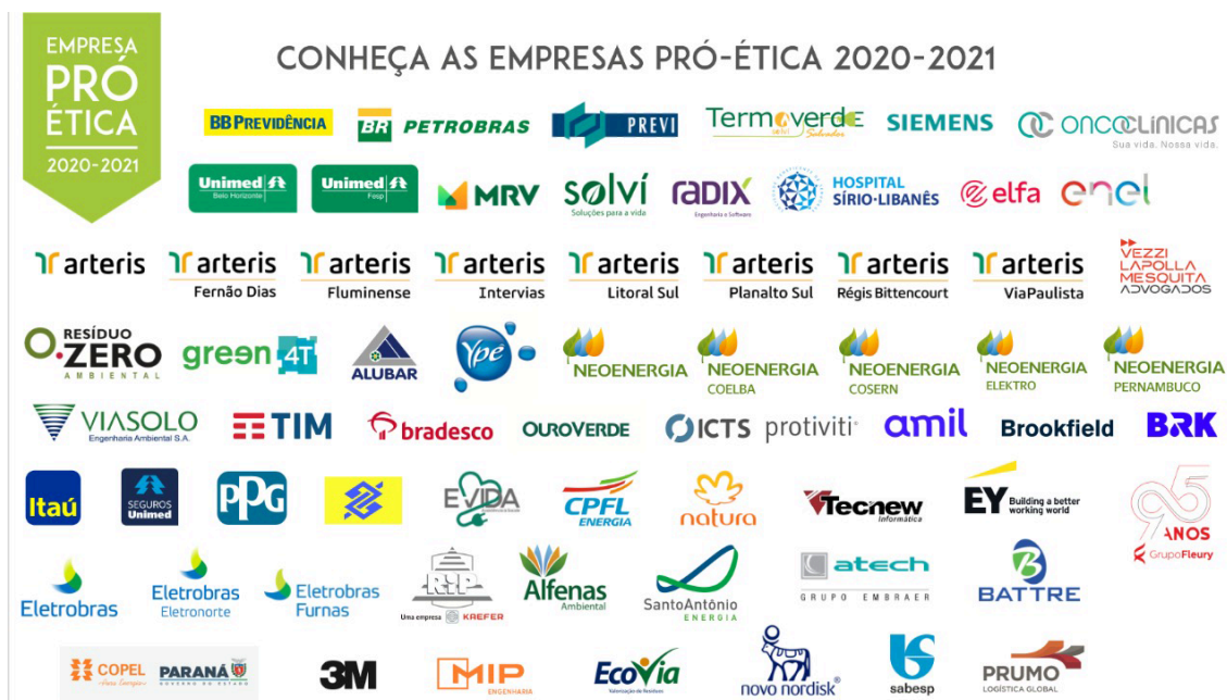
Imagem 4: Empresas que receberam a certificação “Pró-Ética” pela Controladoria-Geral da União na edição 2020-2021 (CGU, 2021).

No biênio avaliativo correspondente aos anos de 2018 e 2019, das 26 empresas contempladas com tal certificação, 4 correspondem ao setor de “Eletricidade e gás”, com destaque para duas grandes empresas do setor de distribuição, que figuram com grande notoriedade: a Enel e a Neoenergia: