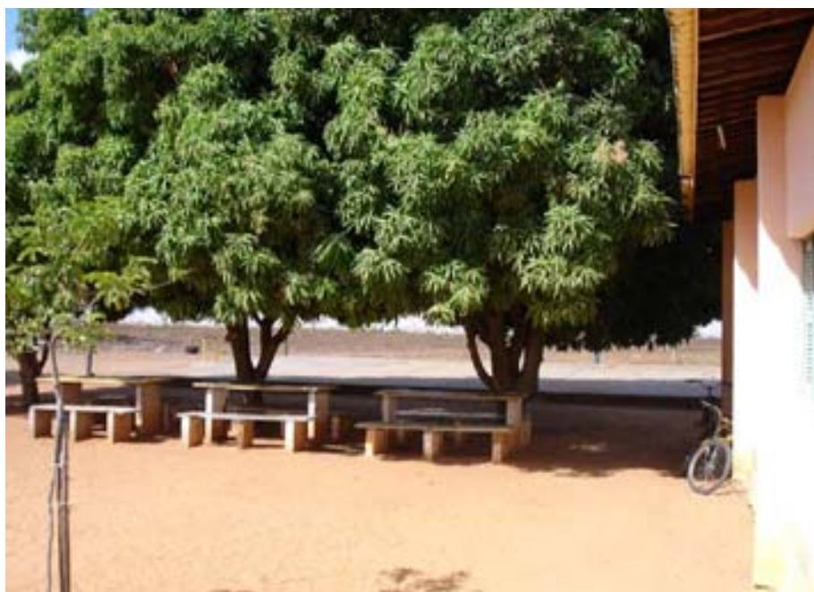
Figura 3: Pátio da escola e piso da quadra

O que torna o espaço da escola um pouco mais agradável, proporcionando o entrosamento e realização de brincadeiras entre os alunos nos momentos de intervalo, é a existência de sete árvores grandes, que dão sombra e tornam o pátio menos quente. Embaixo de algumas dessas árvores foram construídas três mesas de alvenaria, onde eles brincam e alguns sentam na hora da merenda, conforme pode ser constatado na figura 3: