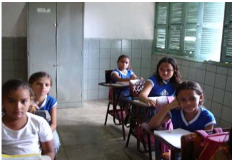
Figura 04: Disposição das carteiras na classe do 4º ano

Na figura a seguir, é possível observarmos a disposição das carteiras na classe do 4º ano, que evidencia a forma como era organizada.