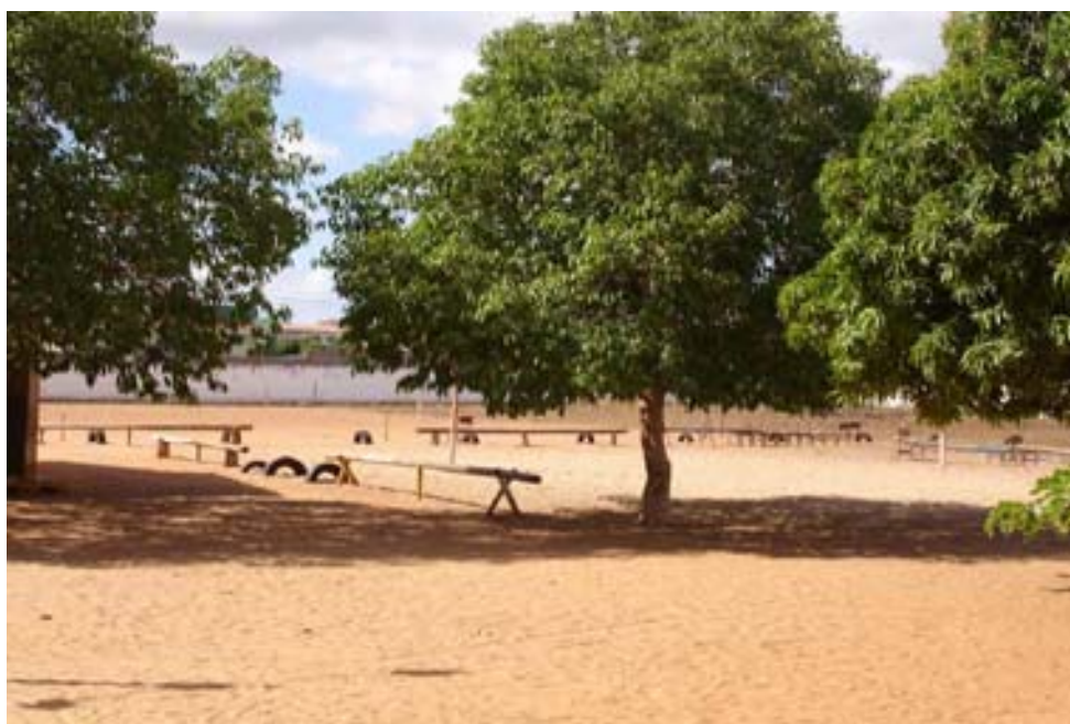
Figura 2: Brinquedos existentes no pátio da escola

A quadra esportiva não tem cobertura, o que dificulta e, em muitos casos, impossibilita a realização de atividades esportivas e/ou culturais, devido ao calor, durante o dia, e à falta de iluminação no turno noturno. No pátio, existem alguns brinquedos, feitos de pneus e madeira (Figura 2 27 ), que foram confeccionados por iniciativa do professor de Educação Física.