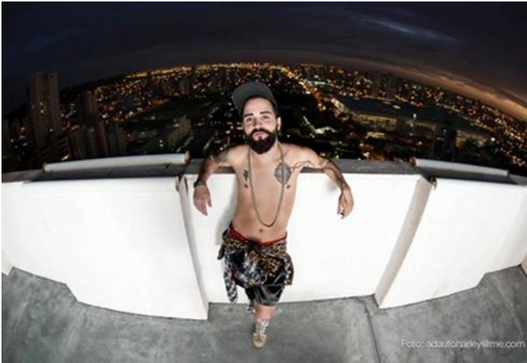
Imagem 3 – Entrevistado 3: Tatuagem como arte

emoções, histórias e sentimentos, para os quais vale a pena cada dor quando escritos na pele. Muito mais que uma marca corporal, o entrevistado abaixo afirma: “É você externar coisas que estão atreladas à sua personalidade, ao seu modo de vida, às coisas que você lê, tudo que compõem... Enfim, nossa cultura, é uma forma de externar isso de uma forma artística” (informação verbal). 5