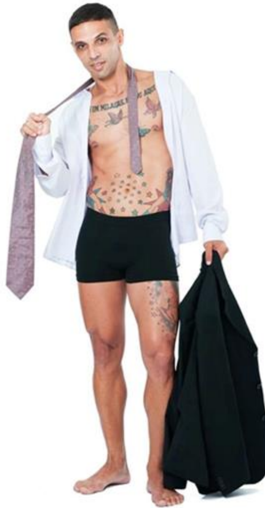
Imagem 6 – Entrevistado 5: Tatuagens e uniformidade de imagens