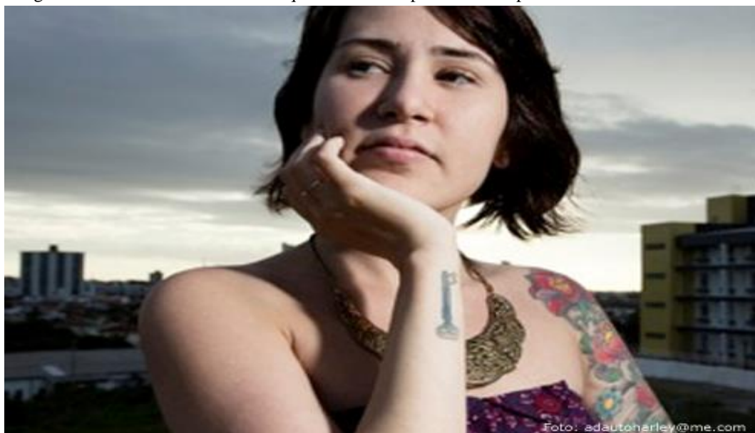
Imagem 5 – Entrevistada 2: A chave que fecha as experiências do passado

Abaixo, temos uma experiência desse palimpsesto. O sujeito em questão cobriu o nome de um amor que já não fazia mais sentido e que acabou. Como palimpsesto, ela recorreu a uma imagem que desse conta desse apagamento superficial. Acreditamos que a escritura anterior continua tão presente em sua carne quanto o cover up . O que ocorre é que os outros não veem, mas ela, ao olhar o que fora tatuado, uma chave, sabe que ali esconde-se uma cicatriz em forma de experiência mal vivida e que fora apagada, mas lá está. Podemos ver na imagem abaixo da entrevistada 2, uma chave que pode servir para abrir portas do sentimento, de segredos, ou para fechar e esquecer em qualquer lugar no passado, lembranças de sua constituição subjetiva que não faz mais sentido.