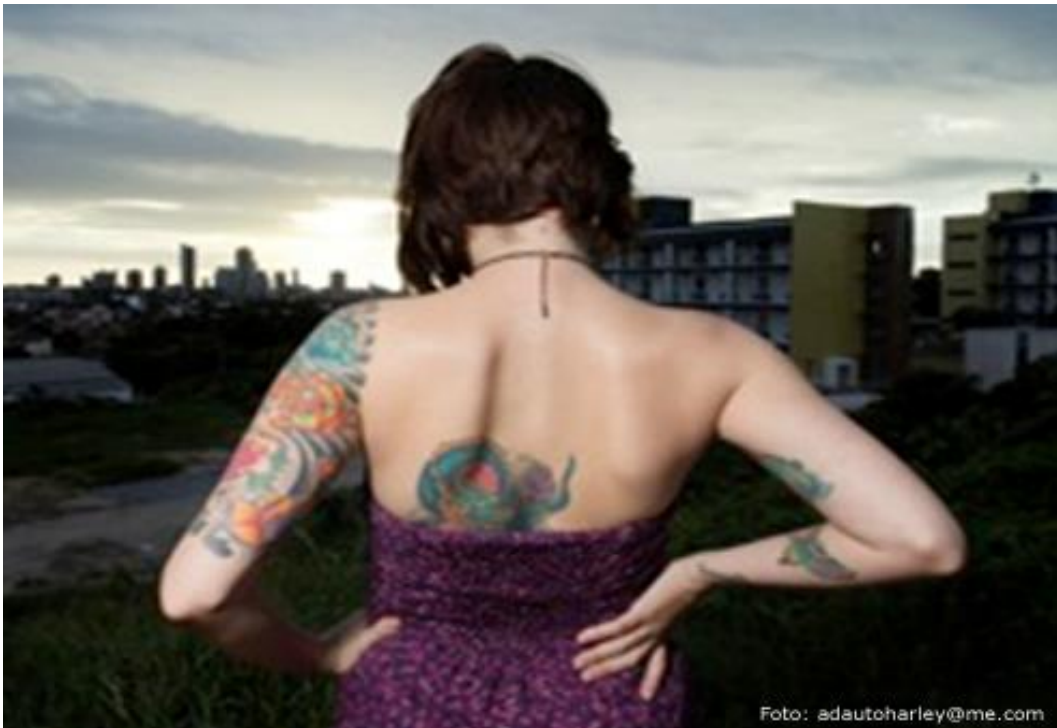
Imagem 4 – Entrevistada 2: Escritas de amores e desamores

Podemos problematizar a escrita e suas possibilidades, que são realizadas nos corpos do sujeito. Será a escrita, como fora apontada por Plutarco, uma operadora de verdades, transformando então em ethos ? Essa etopoiética configurada como impressão, seja como um livro denotando verdades particulares, contribuindo para a formação subjetiva, ao qual se classifica como hypomnemata — documentos escritos do século I e II, ou como correspondência, melhor dizendo, textos enviados para ajudar ao interlocutor essa formação do ethos . É importante trazer essa forma de escrita para o campo da techné enquanto tecnologias que compreendem o cuidado de si. Essas eram tecnologias da escrita de suas experimentações com o afã de ajudar aos outros e é uma arte de conhecer-se, de trato consigo mesmo para manutenção de suas experiências. Abaixo, uma pele que denota a escrita de si com vieses hypomnemata do século I e II. A seguir observamos a entrevistada 2.