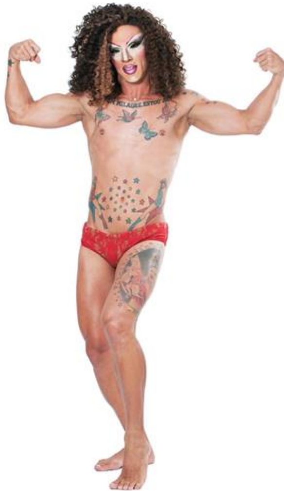
Imagem 7 – Entrevistado 5