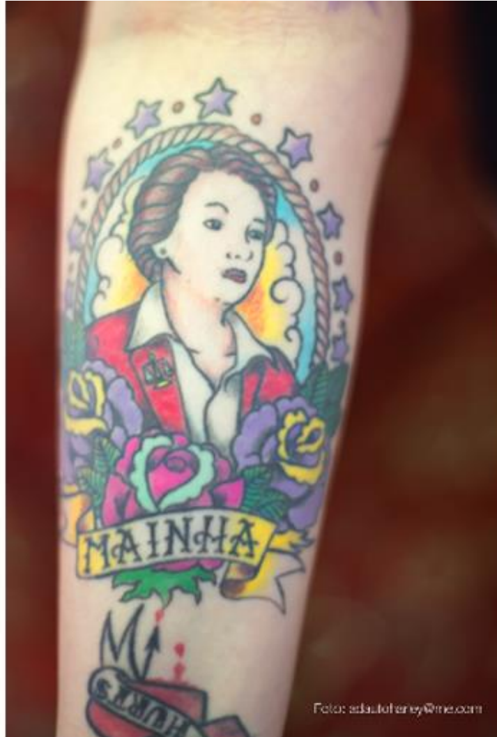
Imagem 8 – Entrevistada 4

contra o que há de horroroso nisto tudo, uma carcaça mineralizada em vez de pele, para repelir o que existe de traumático na dor que tudo isso nos provoca”.