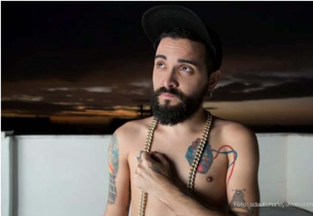
Imagem 14 – Entrevistado 3