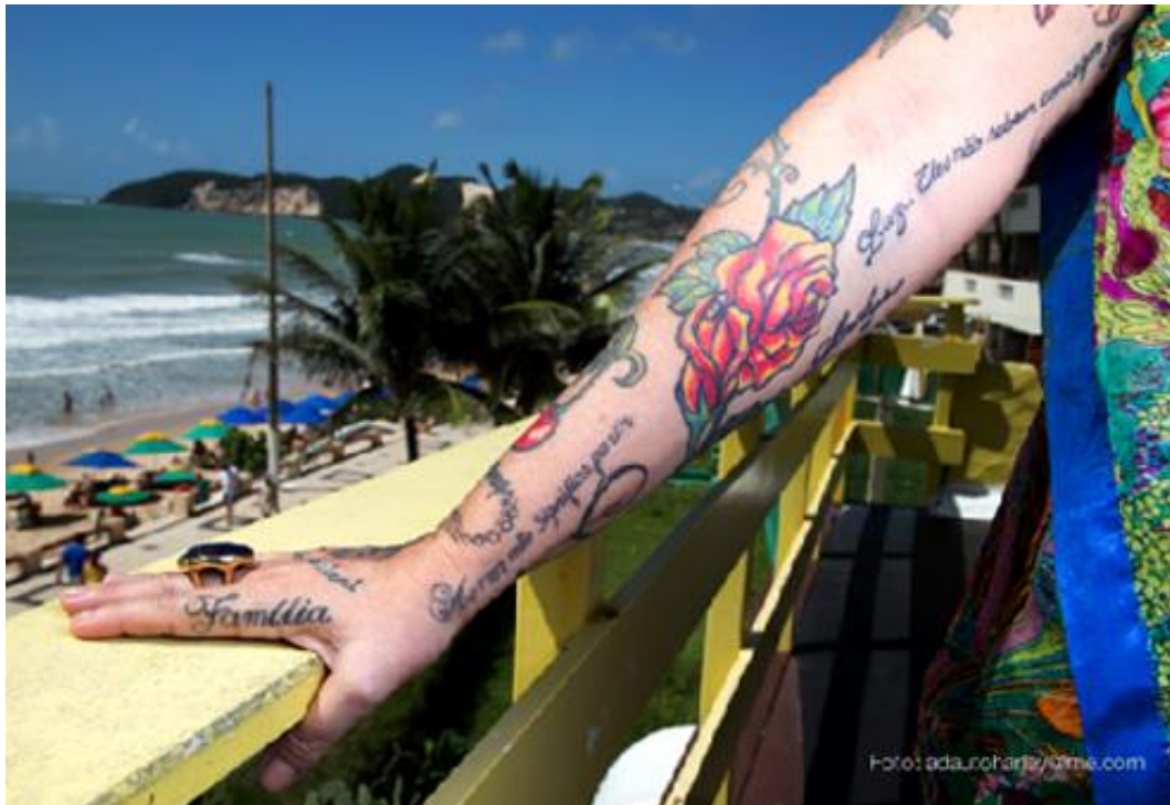
Imagem 9 – Entrevistada 1