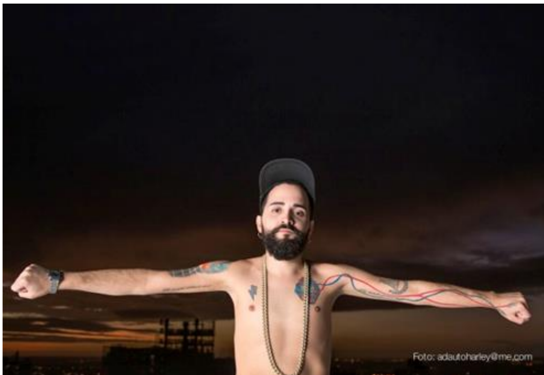
Imagem 10 – Entrevistado 3

contratempos, de perigos que podem nos extraviar. Assim, aprender a arte do cuidado de si, de técnicas para nos assegurar, é importante. Nossos entrevistados apontaram para uma trajetória de vida em que doenças lhes desestabilizaram, perda de pessoas queridas e mesmo risco de morte foram apresentadas como perigos de viver. Para tanto, tornaram-se comuns as tatuagens a partir de práticas discursivas que traduzem sentidos de agradecimento e testemunho de vida após essa fase tempestuosa de vida.