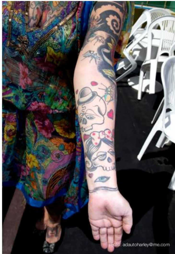
Imagem 11 – Entrevistada 1

sonhos e experiências que são riscadas e dão uma nova pele, inserindo-os no social esteticamente adornado. Abaixo, a entrevistada 1 traz esses adornos que reinventam a pele, o corpo sob uma linguagem plural.