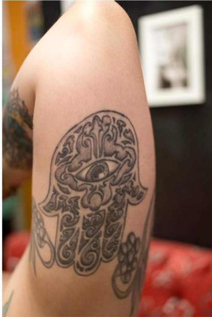
Imagem 17 – Entrevistada 4