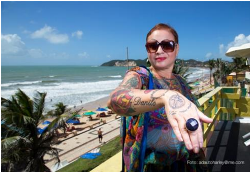
Imagem 12 – Entrevistada 1