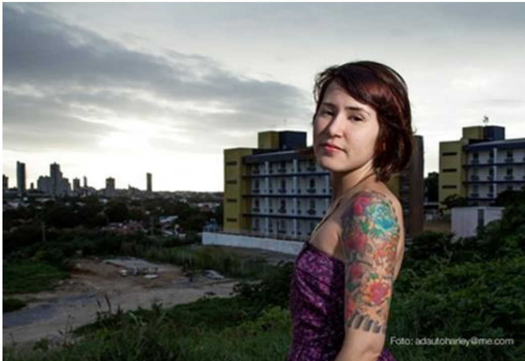
Imagem 13 – Entrevistada 2