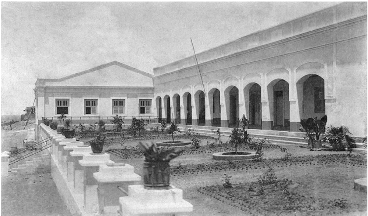
Hospital de Caridade "Jovino Barreto" (fachada lateral).

Em 1927, o Hospital, nas palavras de Araújo (1983), contava com um maior número de clínicas e uma fachada mais apropriada. Prossegue, afirmando que funcionavam as Clínicas Médica e Cirúrgica, Oftalmologia, Fisioterapia, Laboratório de Análises e Pavilhão de Maternidade.