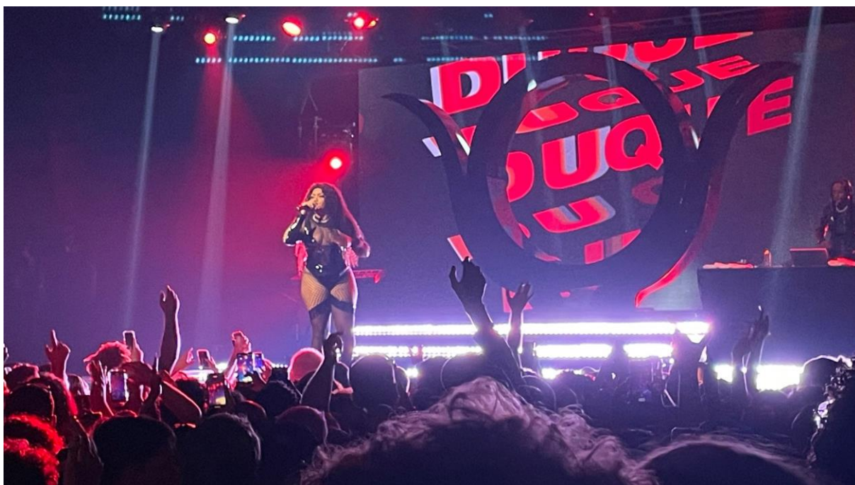
Figura 3 - Rapper Duquesa performando em show

Em síntese, Duquesa não apenas conquistou visibilidade em um mercado competitivo e historicamente masculino, ela também abriu caminhos. Sua trajetória representa mais do que uma ascensão individual: ela simboliza a emergência de novas vozes no rap nacional, sobretudo de mulheres negras e periféricas que, por muito tempo, foram marginalizadas ou silenciadas nesse espaço. Ao ocupar o microfone, Duquesa transforma o palco em lugar de fala e legitima outras experiências, deslocando a centralidade de narrativas antes dominadas por olhares masculinos e heteronormativos.