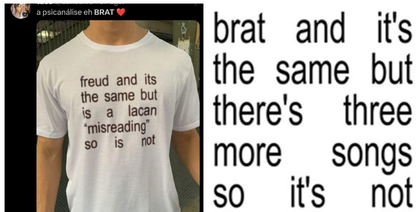
Imagem 7 – Camisa desenhada por Natanael Palazin, inspirada na capa deluxe de Brat , associada à psicanálise • Imagem 8 – Capa da página da artista no Spotify