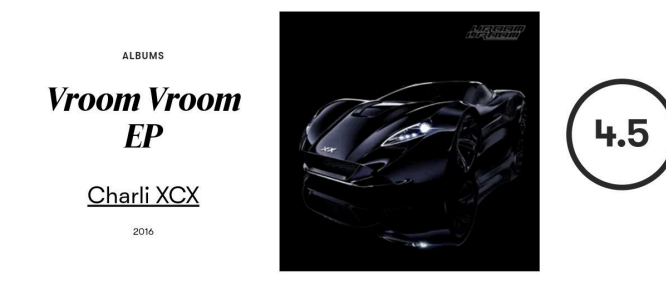
Imagem 4 – A revista Pitchfork avaliou com 4.5/10 o extended play “ Vroom Vroom ”

Em 2016, Vroom Vroom ( Imagem 4 , a seguir), em particular, marcou uma virada radical em sua carreira, misturando elementos de hyperpop 8 com uma estética futurista, embora inicialmente tenha sofrido resistência de sua própria gravadora e da crítica. O EP não só redefiniu a trajetória artística de Charli, mas também a estabeleceu como uma figura fundamental no pop alternativo e no movimento PC Music . Projetos subsequentes, como a mixtape Pop 2 (2017), reforçam esse ethos independente, com colaborações que desafiam convenções, incluindo Sophie e Caroline Polachek, elevando-a como uma artista inovadora.