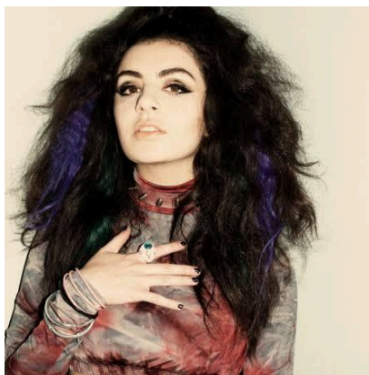
Imagem 2 – Charli em foto de divulgação do álbum True Romance

A ascensão de XCX no pop alternativo realmente começou com seu álbum True Romance (2013) (vide Imagem 2 , a seguir), um marco essencial para sua carreira, pois apresentou ao público seu estilo autêntico e exploratório. Combinando influências de synth-pop 3 e darkwave 4 , o álbum trouxe faixas como Stay Away e Nuclear Seasons , que foram bem recebidas pela crítica e destacaram Charli como uma artista disposta a experimentar sonoridades e temas que fugiam da fórmula do pop convencional (Deusner, 2011). True Romance atraiu a atenção de uma base de fãs que buscava algo diferente, estabelecendo-a como uma das artistas mais promissoras da cena pop alternativa.