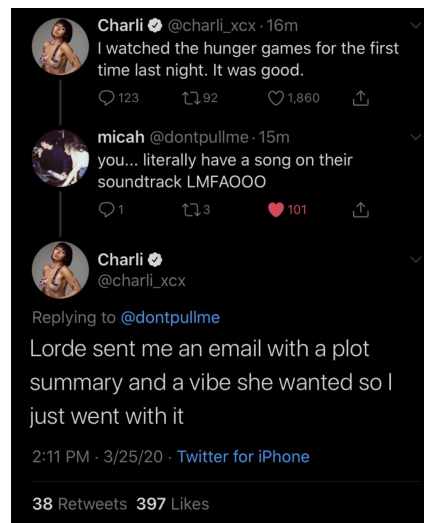
Imagem 9 – Charli revela em seu X para os fãs que nunca havia visto a franquia Jogos Vorazes , mesmo tendo uma canção na trilha sonora