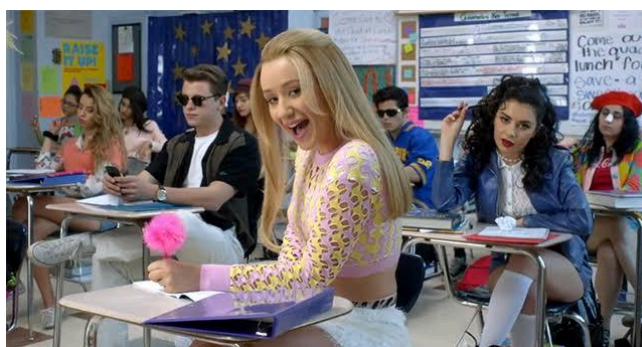
Imagem 3 – Iggy Azalea e Charli no videoclipe de Fancy

O ano de 2014 é o primeiro grande ponto de virada na carreira de XCX: a canção Fancy ( Imagem 3 , a seguir), lançada com Iggy Azalea vende 9,1 milhões de cópias (IFPI, 2015); Boom Clap é trilha sonora do filme A Culpa é das Estrelas , atingindo a oitava colocação na Billboard Hot 100 , sendo a primeira vez que ela chegou aos dez primeiros colocados sozinha (Trust, 2014). Com Sucker (2014), sendo antecedido por dois grandes hits, vieram as expectativas comerciais: I Love It , Fancy e Boom Clap colocaram-na em destaque nas paradas e trouxeram uma nova dimensão à sua carreira, mas também geraram uma cobrança por sucessos de massa, o que impactou diretamente o desenvolvimento do álbum.