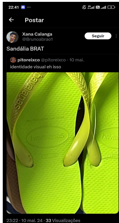
Imagem 11 – Internautas relacionam o verde a Brat , o que reforça a sua identidade visual

reforça a atitude presente em todo o projeto, desde as músicas até mesmo a forma de agir. Esse conjunto forte criado pode amplificar a presença do álbum nas redes sociais e nas plataformas de streaming (Morrison; Sage, 2021). O fenômeno de replicação e discussão gerado pela capa demonstra seu potencial para influenciar a percepção pública e o sucesso comercial do lançamento (vide Imagem 11 , a seguir).