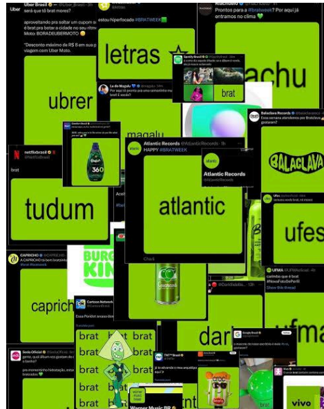
Imagem 10 – Reinterpretações da capa do álbum Brat feitas por marcas e instituições