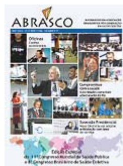
Figura 5 - XIV Congresso da Associação Internacional de Política de Saúde, X Congresso da Associação Latino Americana de Medicina Social e IV Congresso Brasileiro de Ciências Sociais e Humanas em Saúde em Salvador, Jul/07

Em epílogo constata este autor que a globalização levou os Estados a perderem sua capacidade de formular e programar políticas nacionais de desenvolvimento e, de se focalizarem no ajuste fiscal que reside na volúpia permeada pela compressão do tempo sobre o espaço das pressões da mundialização financeira. A crescente evidência das iniquidades em saúde tiveram a devida ressonância de sua denuncia no âmbito da sociedade civil organizada. A ABRASCO, entidade “top” na linhagem acadêmica nacional da área teve, como temáticas centrais de seus Congressos em 2000 e 2007, a “Iniquidade em Saúde” e a Equidade e a Ética” no cuidado à saúde.