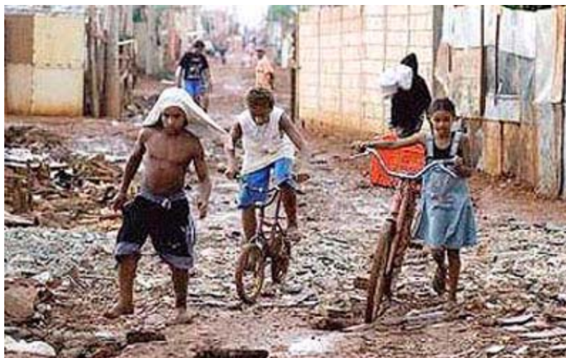
Figura 4 – Crianças transitam por rua com lixo e lama em favela no RJ.

[...] embora o país tenha conseguido elevar alguns padrões básicos de bem-estar social, como a expectativa de vida, a mortalidade infantil e a qualidade da nutrição, ainda precisa investir em políticas de saúde, sociais e econômicas para alcançar um bom patamar de saúde coletiva. (FREESE et al., 2007).