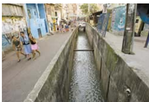
Figura 3 – Valão da favela da Rocinha, Rio de Janeiro.

Acrescentou o porta voz que no processo de favelização “[...] a população mais pobre apresenta maior mobilidade espacial, portanto, torna-se mais difícil garantir saneamento a esta parte da sociedade, mesmo investindo em áreas carentes fixas e identificáveis”. (BRASIL, 2006e.). Os dados da PNAD comprovam que o saneamento piorou para os mais pobres: os domicílios com rede de esgoto ou fossa entre os 40% de menor renda no Brasil caíram de 59% para 55% entre 2001 e 2004. Em 2006, a expansão de cobertura de mantém na relação inversamente proporcional das ações de saneamento e a expansão imobiliária com favelização.